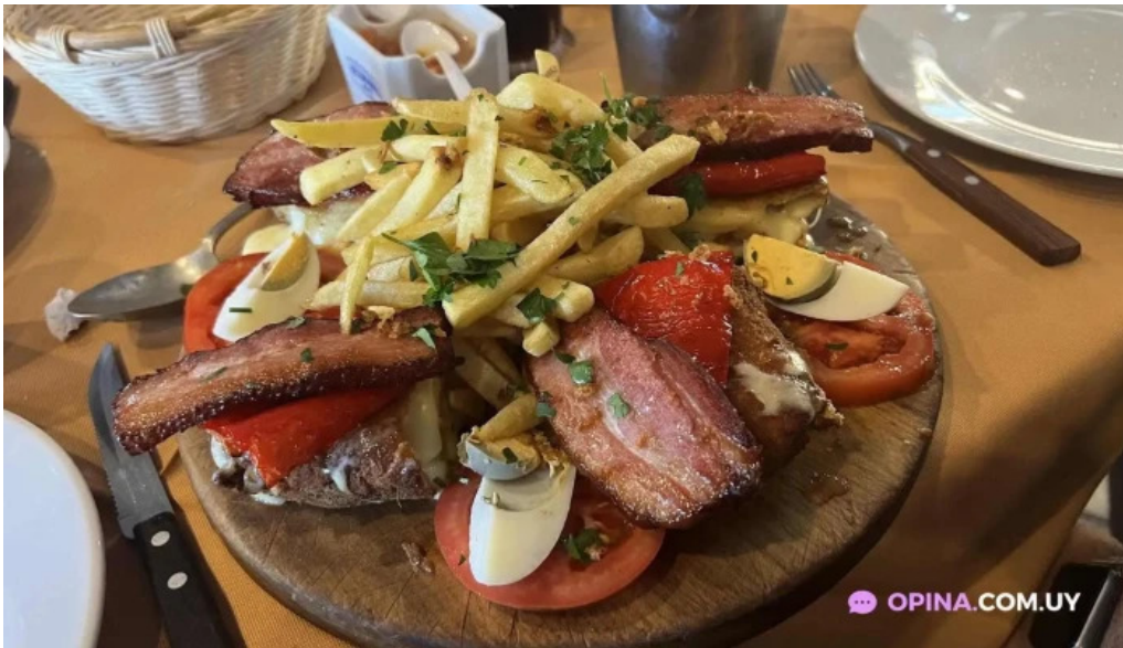
Parador fito comida y bebida