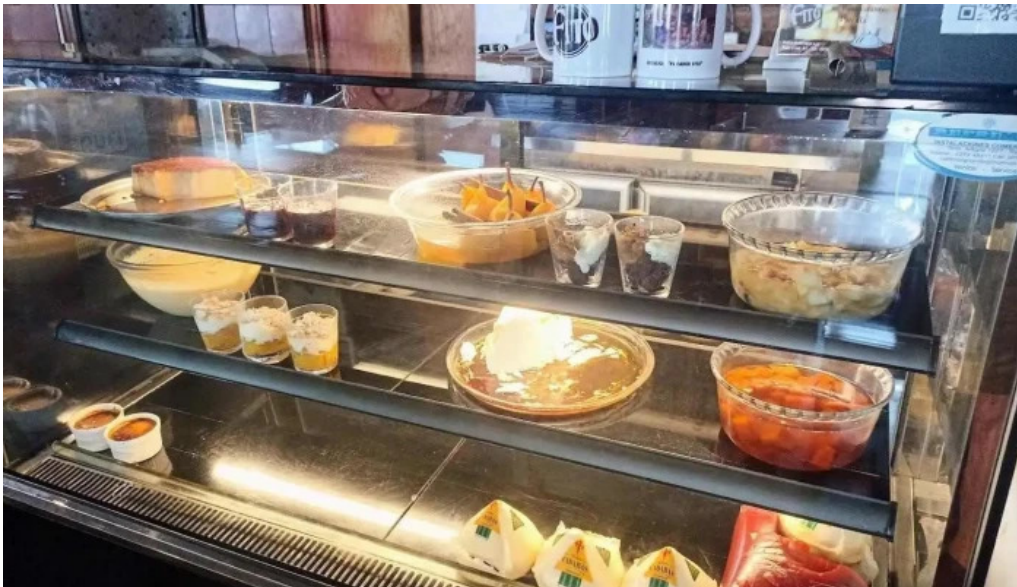
Parador fito comida reconfortante