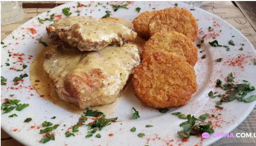
Parador fito tomates verdes fritos