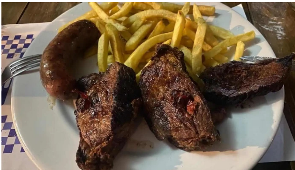
Parador fito churrasco