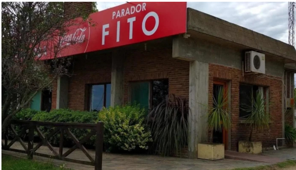
Parador fito piedras de afilar