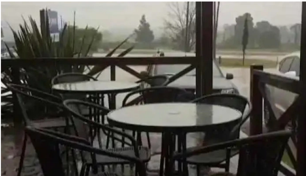
Parador fito videos