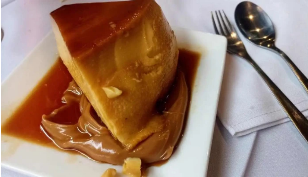
Parador fito flan