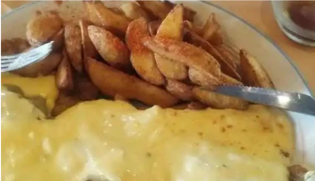
Parador fito mas recientes