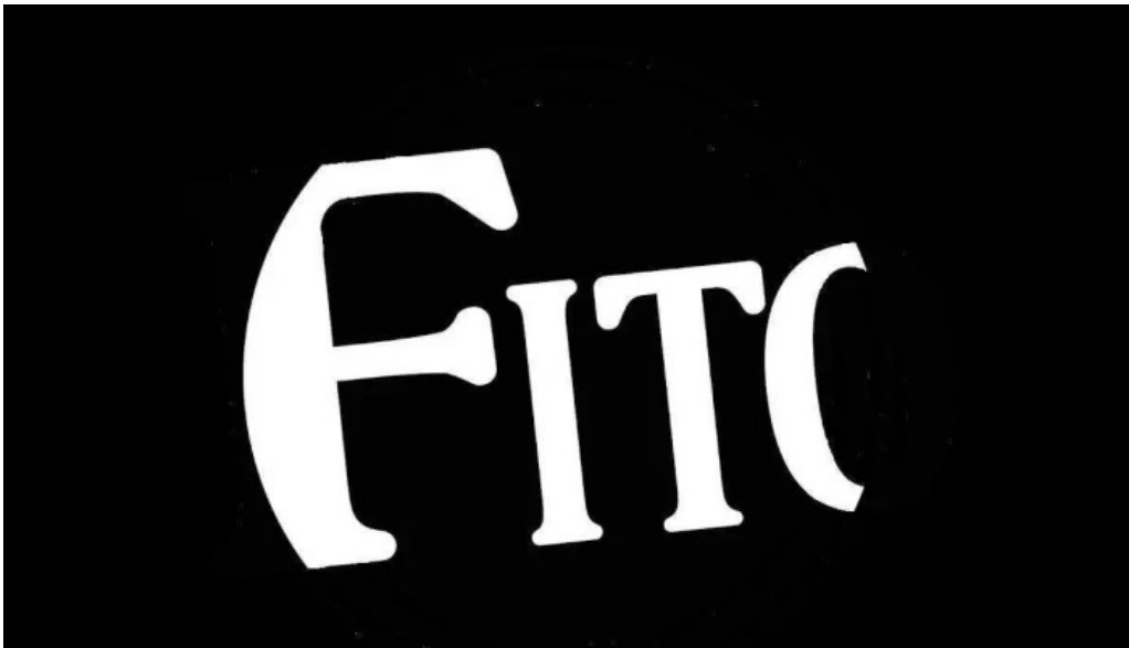
Parador fito del propietario