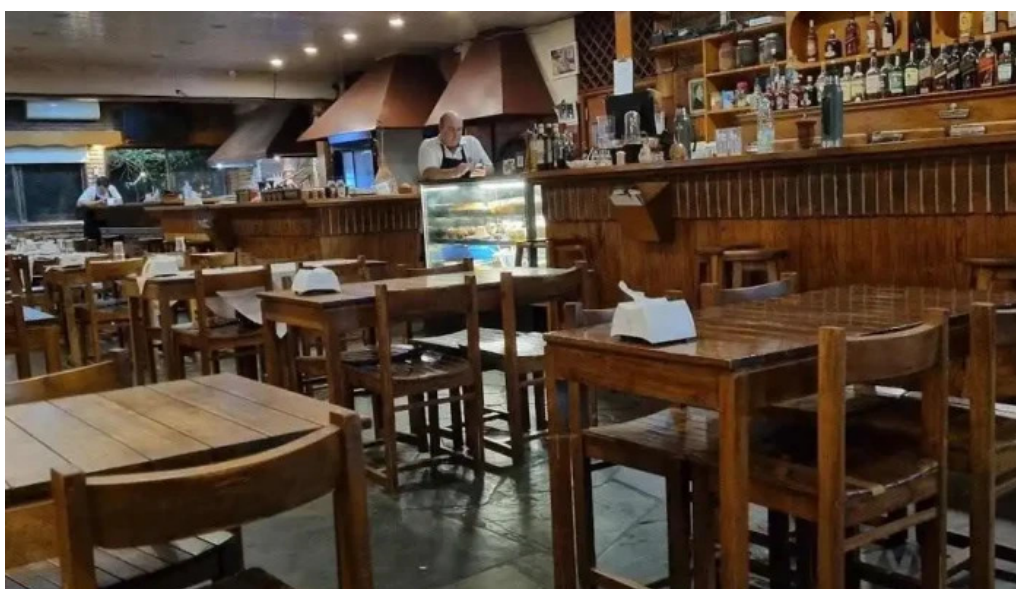
Parador fito ambiente