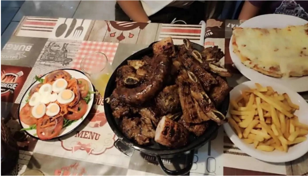
Parador el pepe comida y bebida