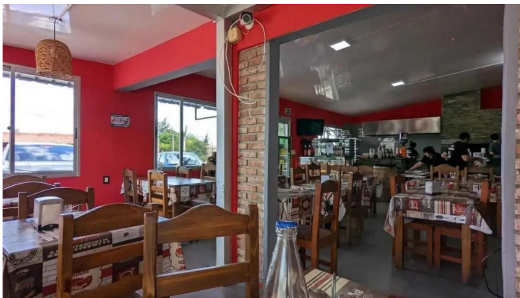
Parador el pepe ambiente