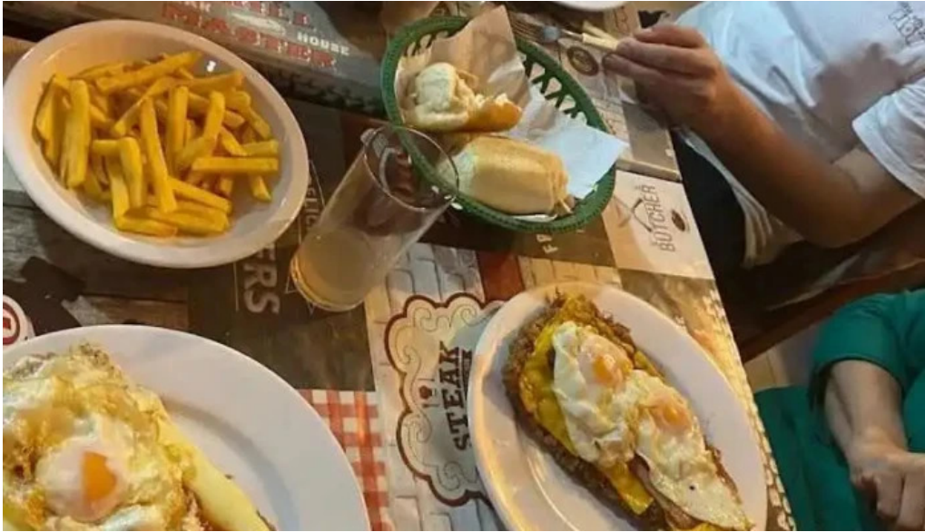
Parador el pepe mas recientes