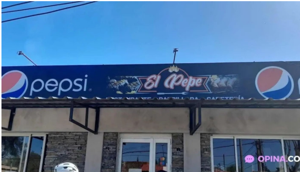
Parador el pepe todas