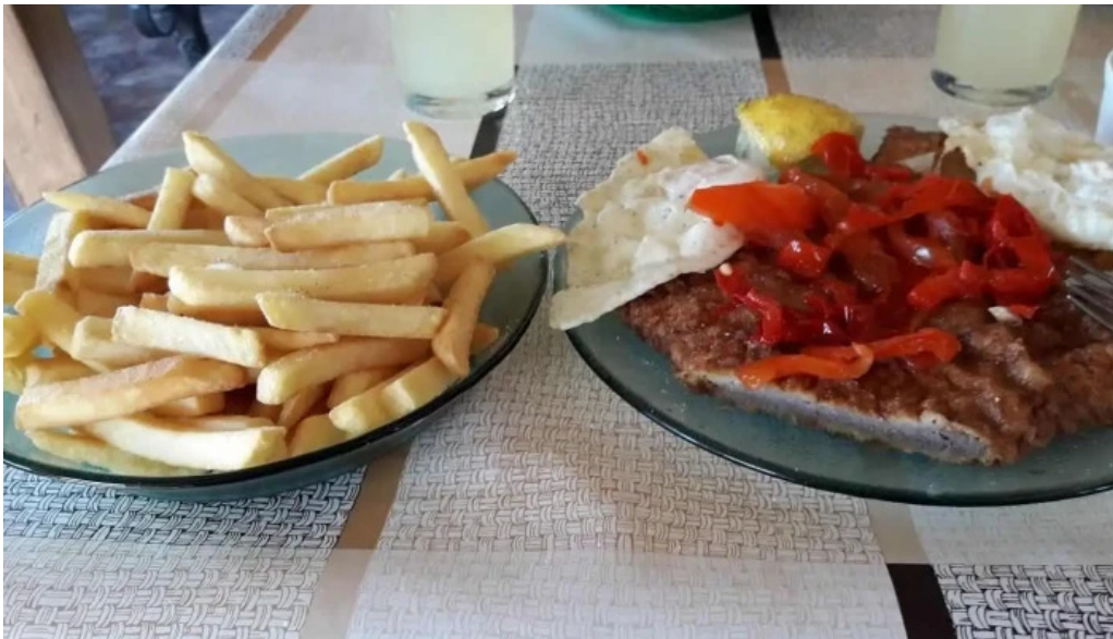
Parador el pepe comida reconfortante