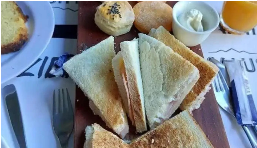
Ziba comida reconfortante