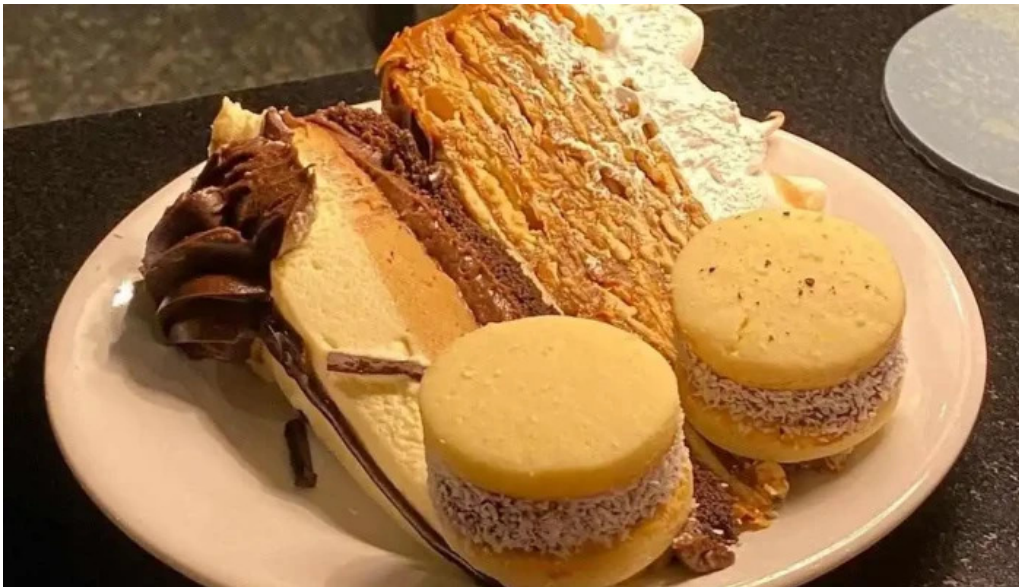
Ziba comida y bebida