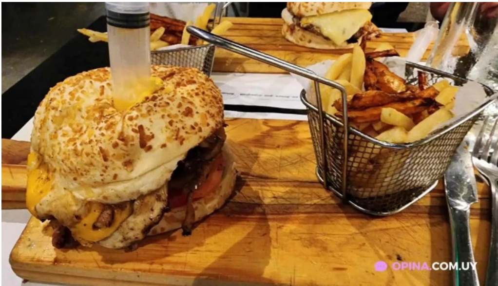
Ziba papas fritas