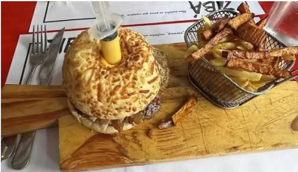
Ziba mas recientes