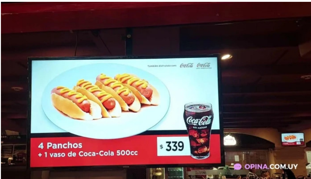
Restaurante y cerveceria la mostaza menu