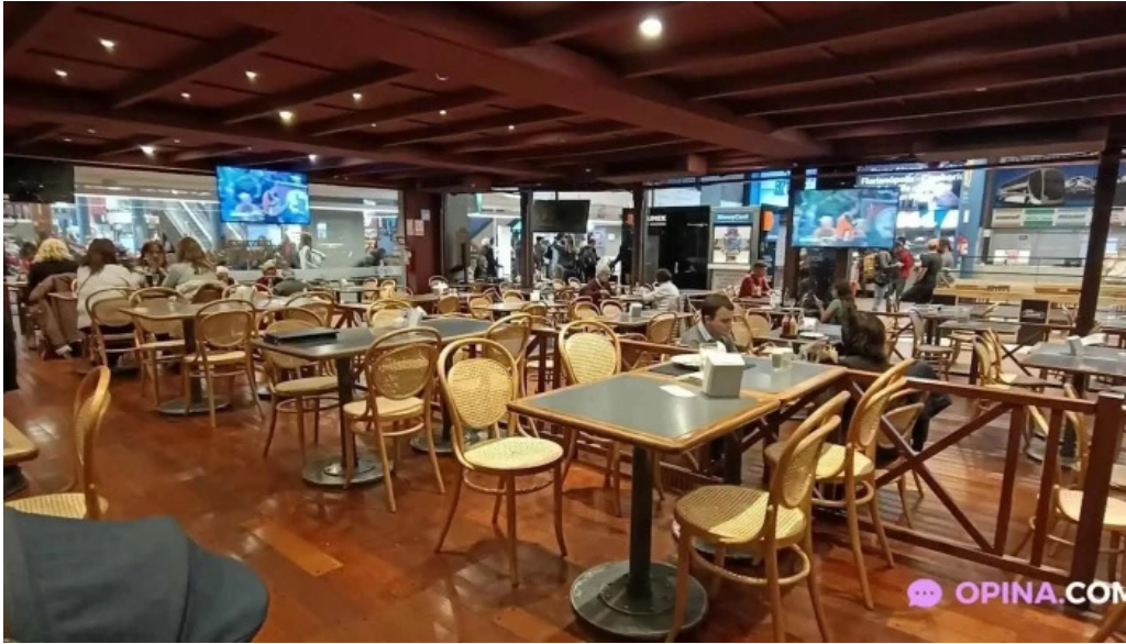
Restaurante y cerveceria la mostaza todas