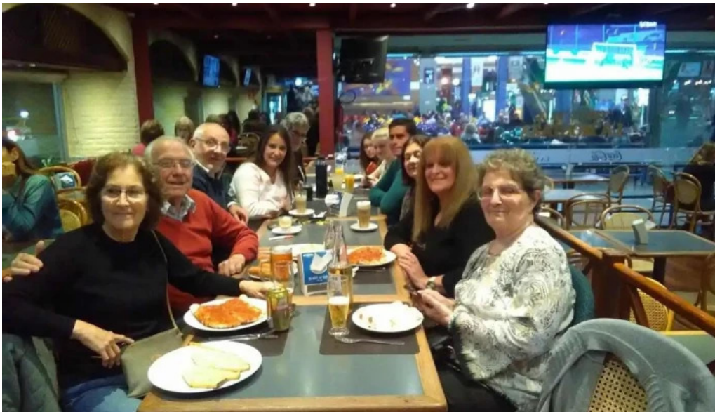
Restaurante y cerveceria la mostaza ambiente