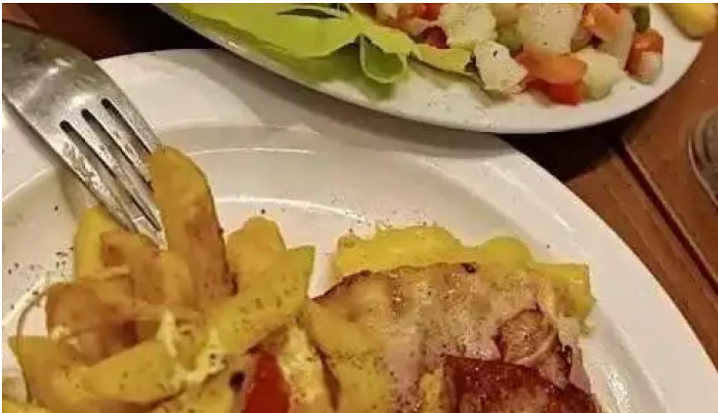
Restaurante y cerveceria la mostaza papas fritas