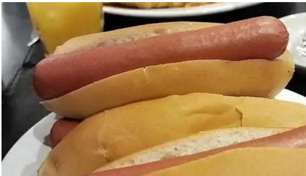
Restaurante y cerveceria la mostaza videos