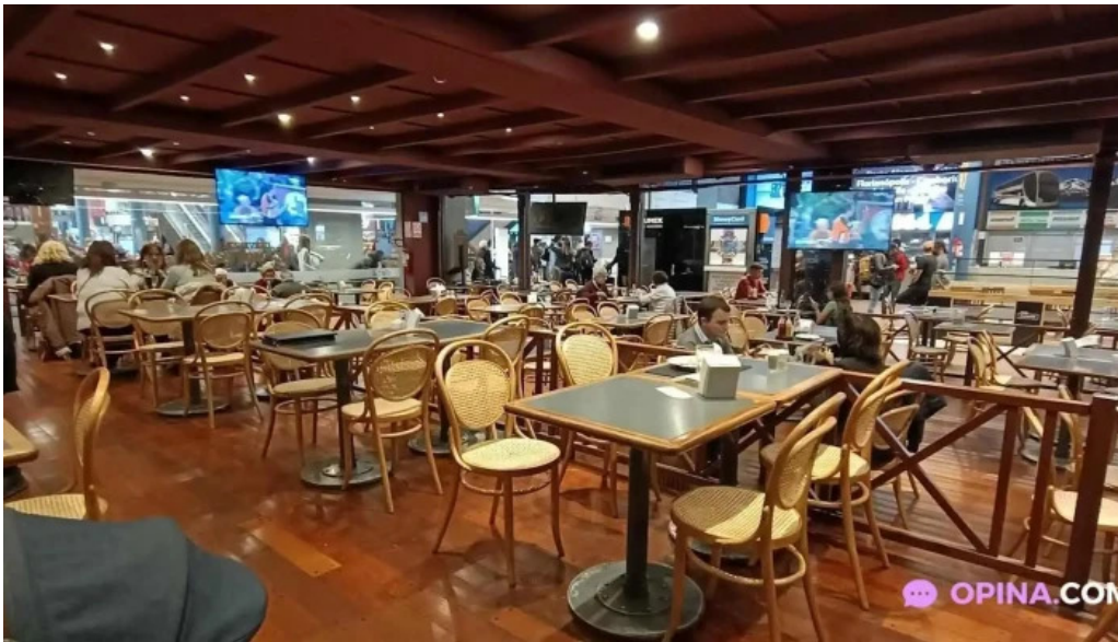
Restaurante y cerveceria la mostaza montevideo