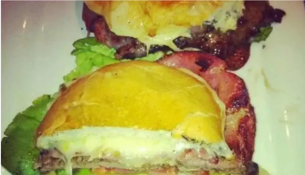
Restaurante y cerveceria la mostaza comida reconfortante