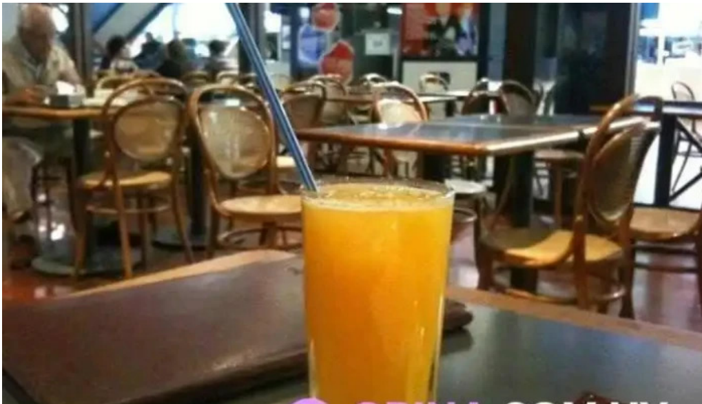
Restaurante y cerveceria la mostaza comida y bebida