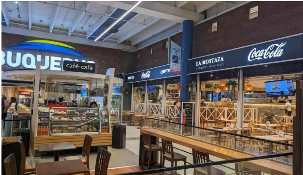
Restaurante y cerveceria la mostaza mas recientes