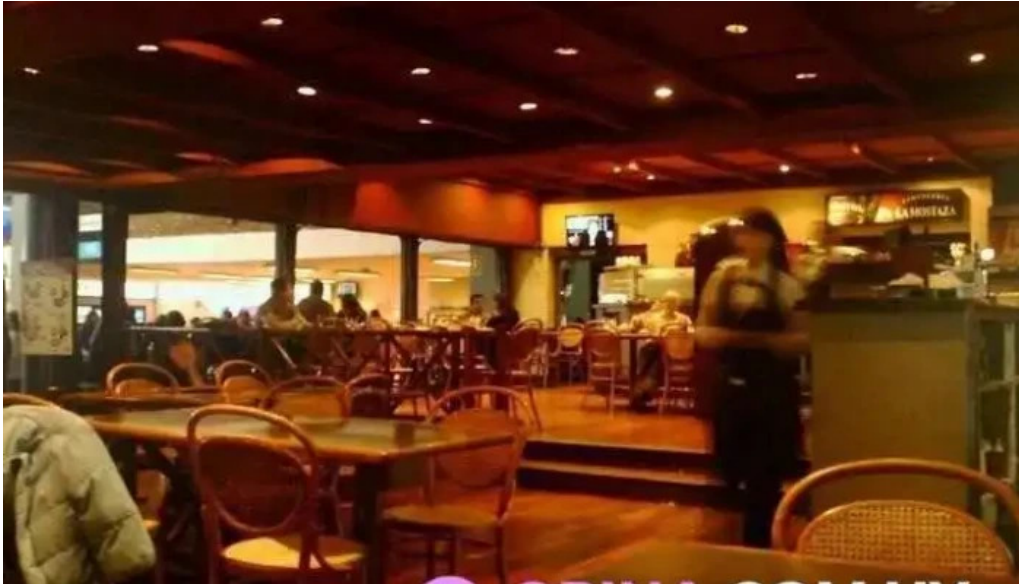
Restaurante y cerveceria la mostaza del propietario