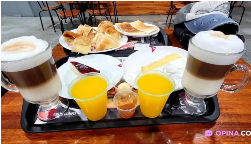
Lo de pepe comida y bebida