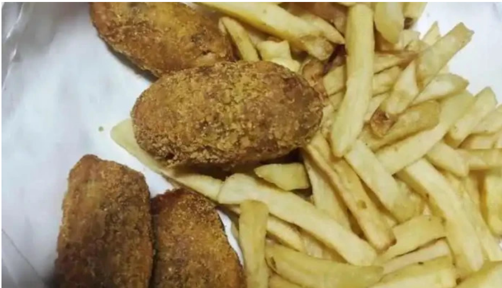
Lo de pepe papas fritas