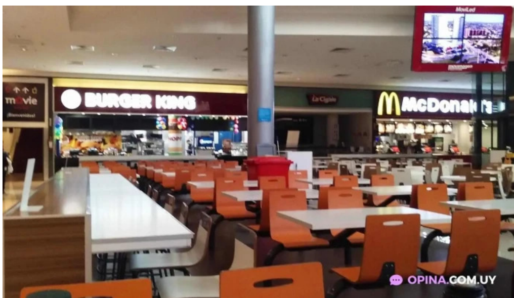
Lo de pepe ambiente