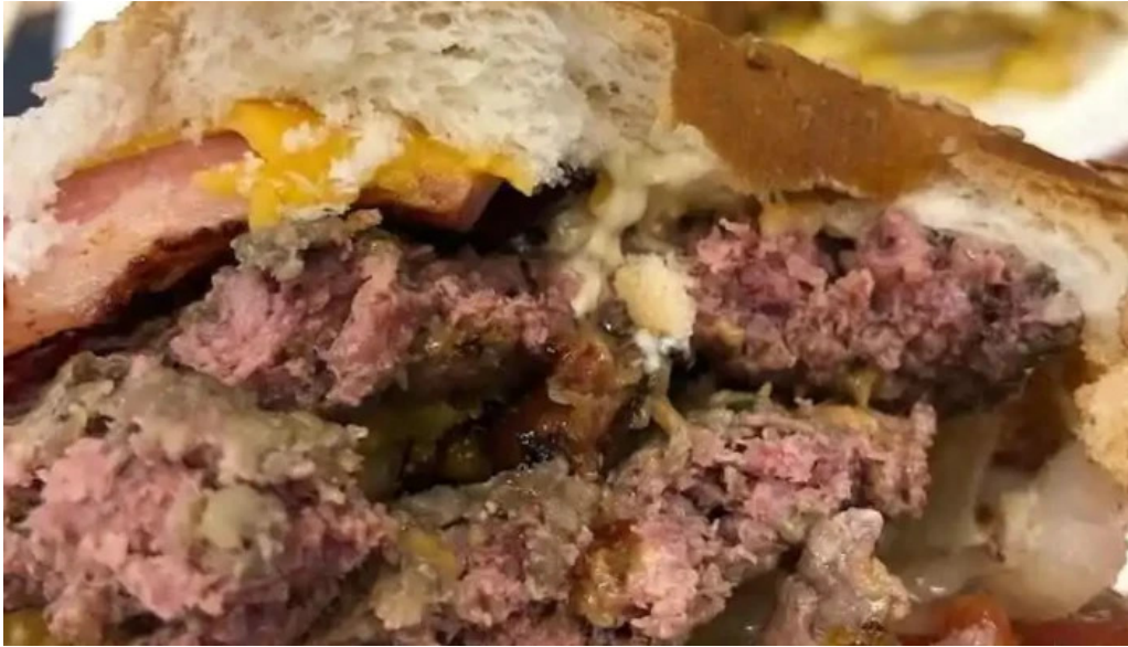
Lo de pepe hamburguesa