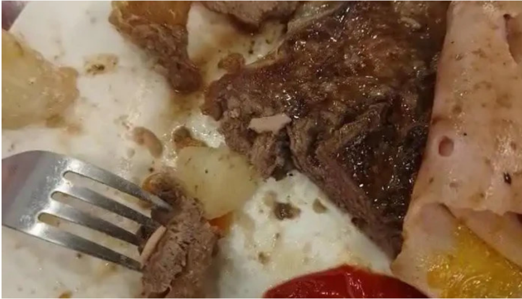
Lo de pepe mas recientes