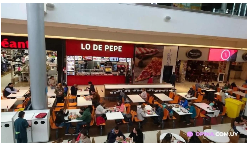
Lo de pepe todas