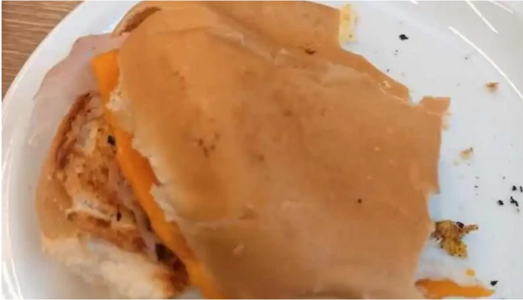
Lo de pepe sandwich de pollo