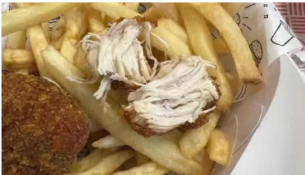
Lo de pepe comida reconfortante