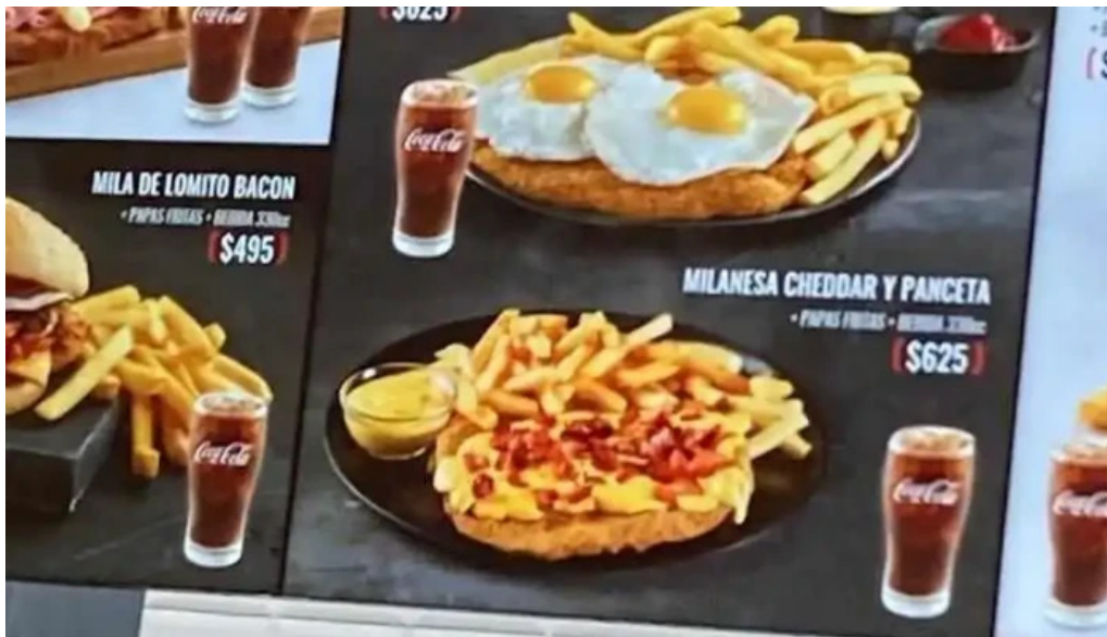
Lo de pepe menu