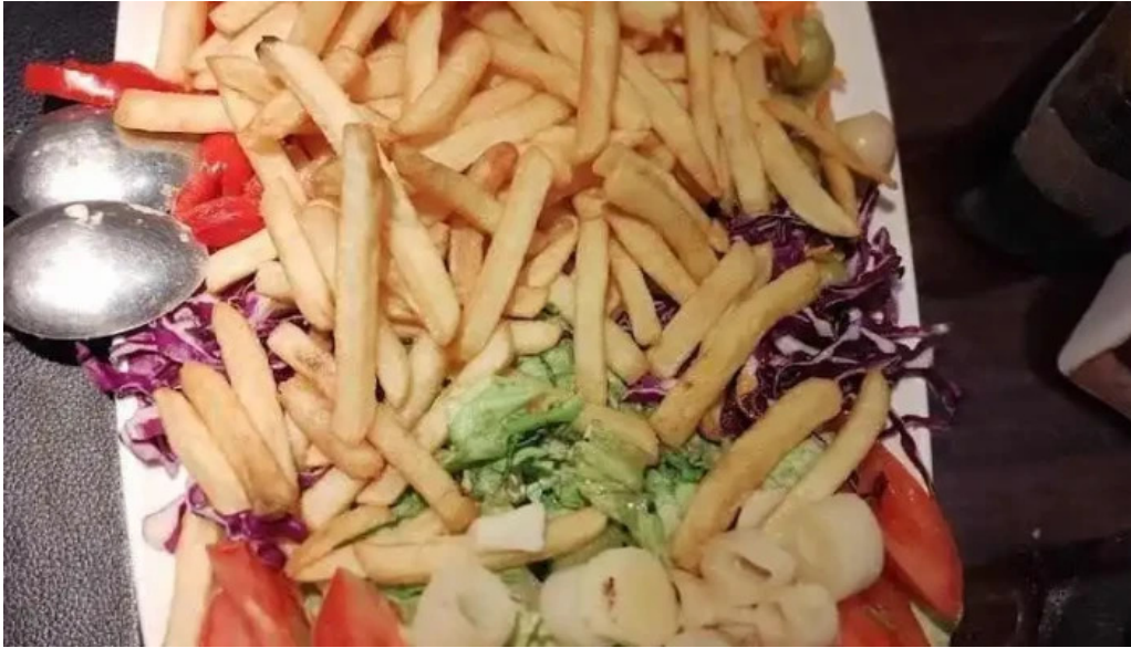
La pasiva papas fritas