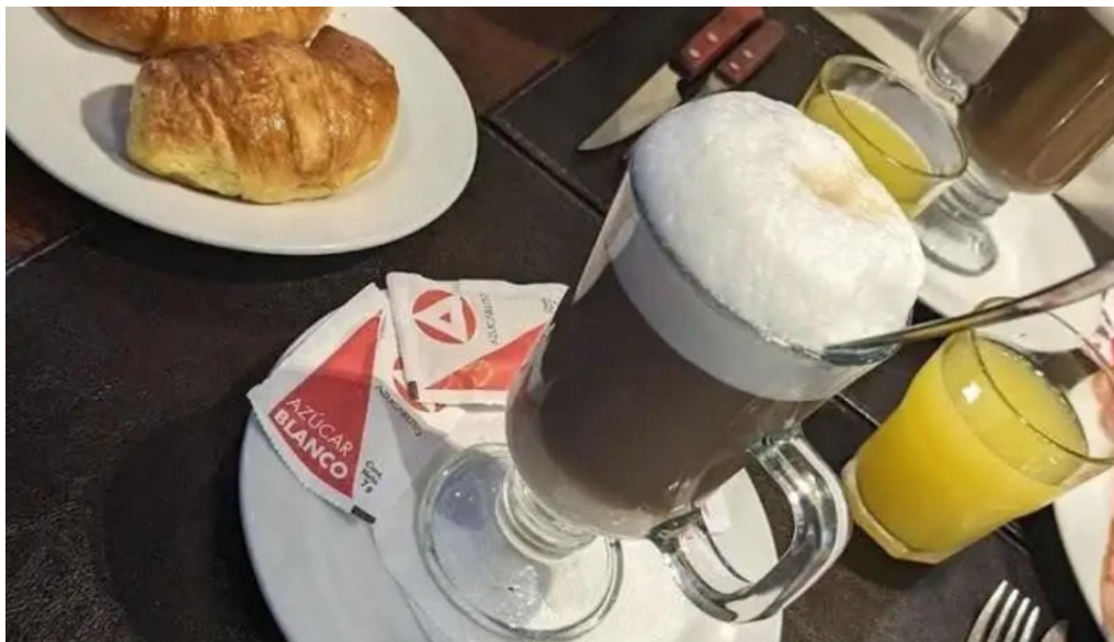
La pasiva mas recientes