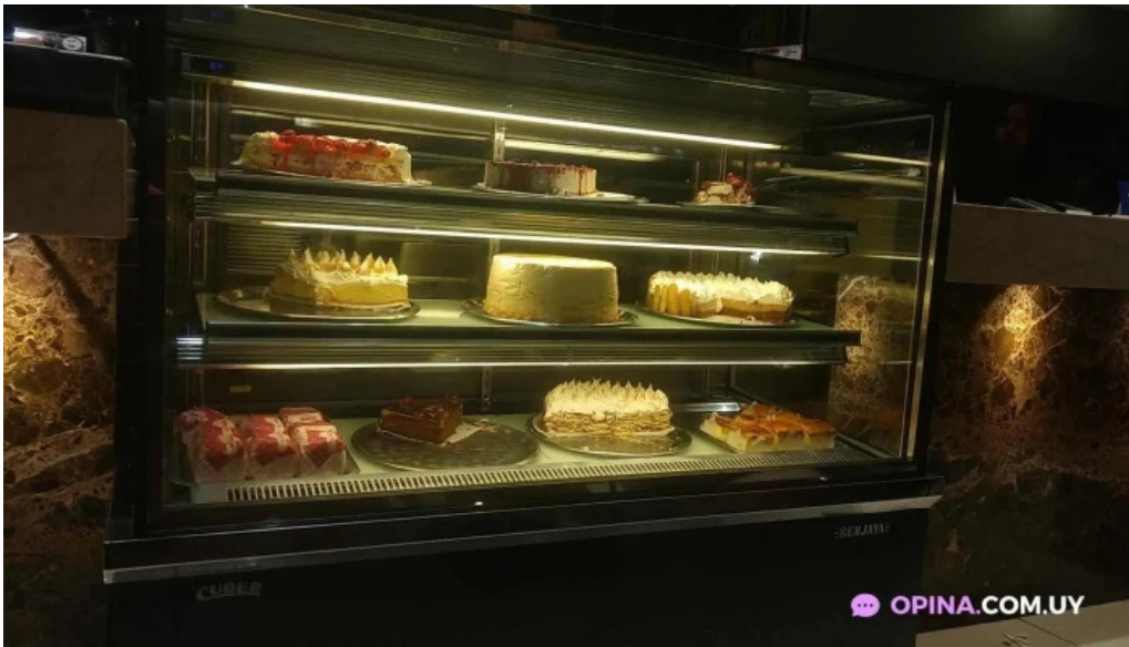
La pasiva comida reconfortante