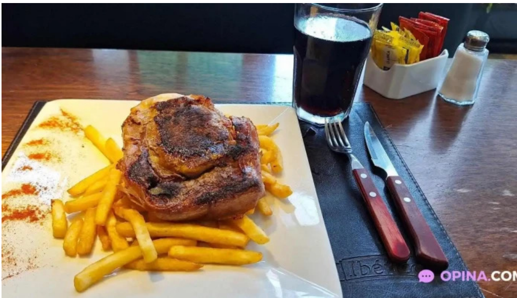
La pasiva filete