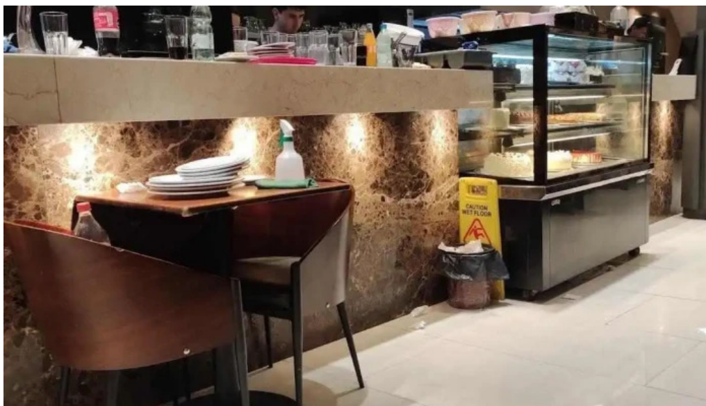
La pasiva ambiente