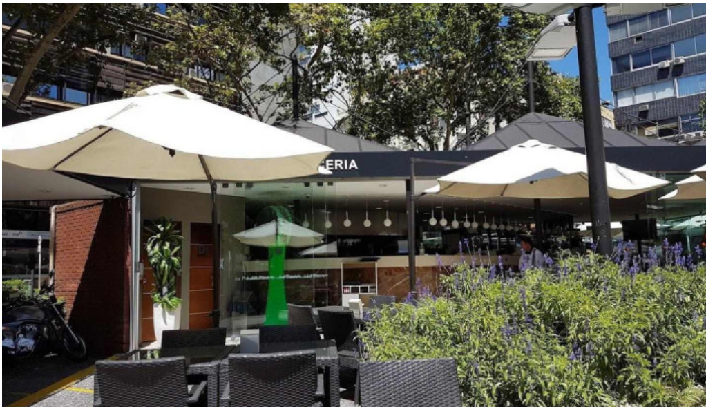
La pasiva montevideo