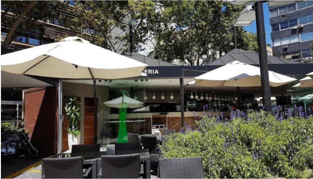
La pasiva todas