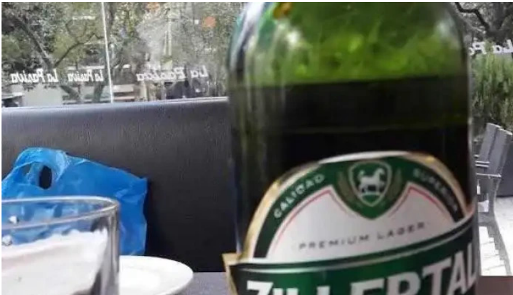
La pasiva cerveza