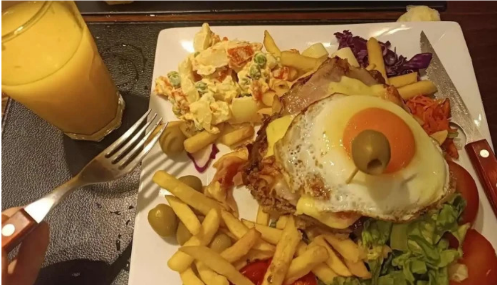
La pasiva comida y bebida