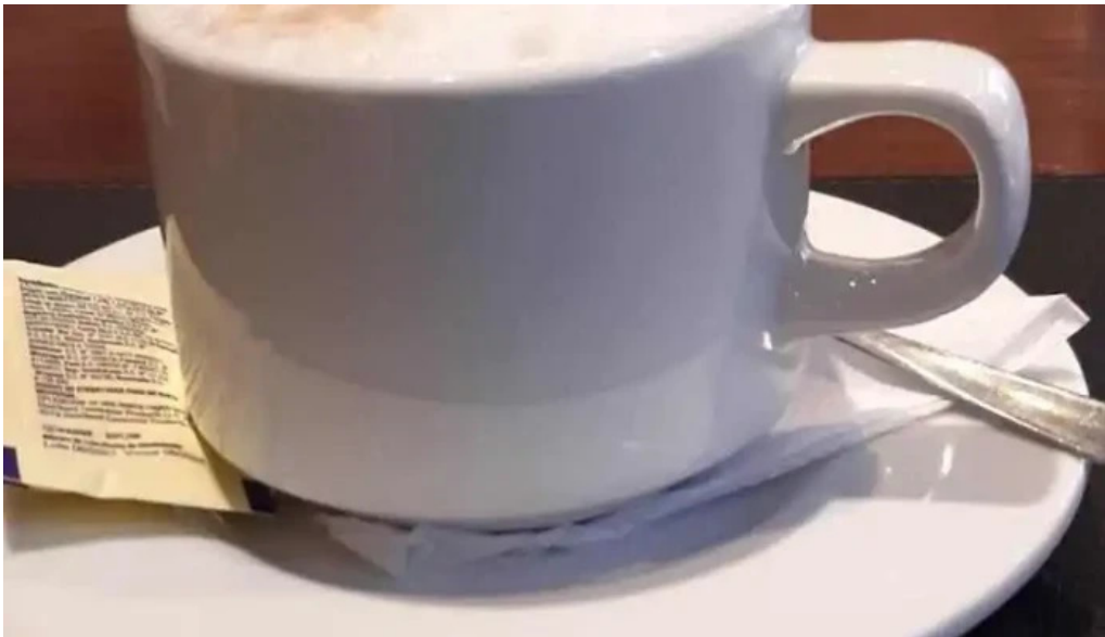
La pasiva capuchino