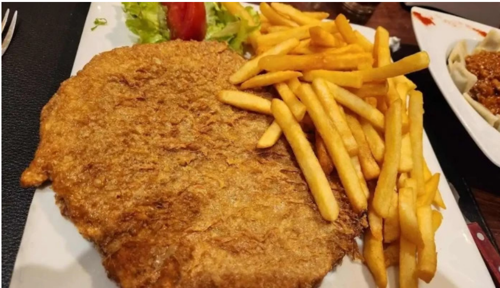
La pasiva san jacob