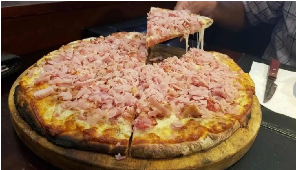
La pasiva pizza hawaiana