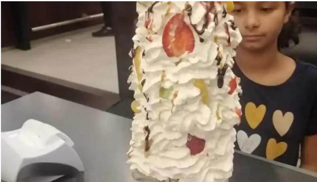
La pasiva helado