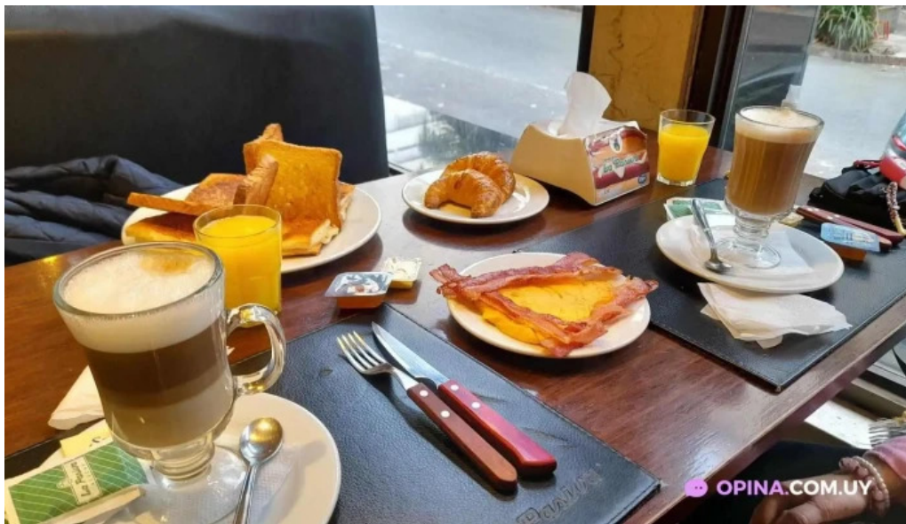
La pasiva jugo