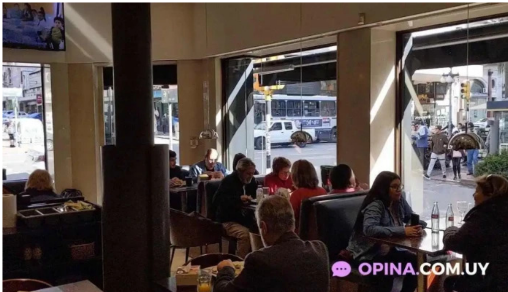
La pasiva videos