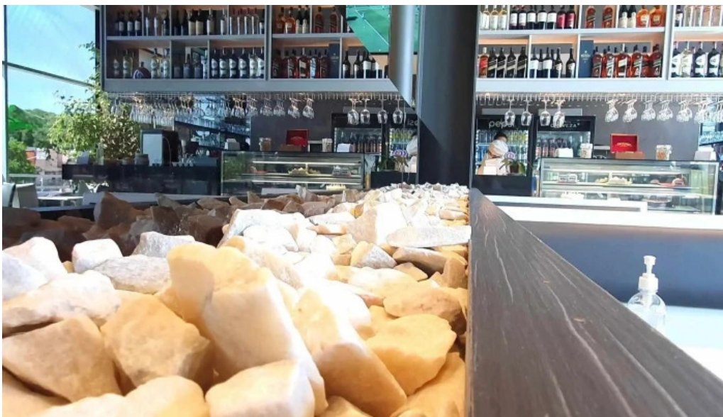
La pasiva todo