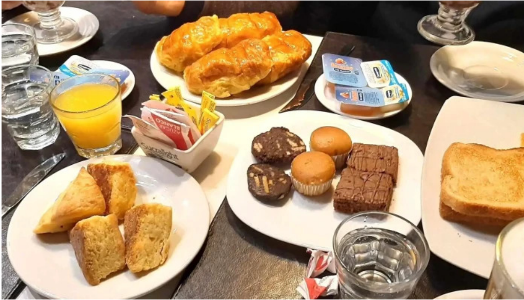
La pasiva comentario 8