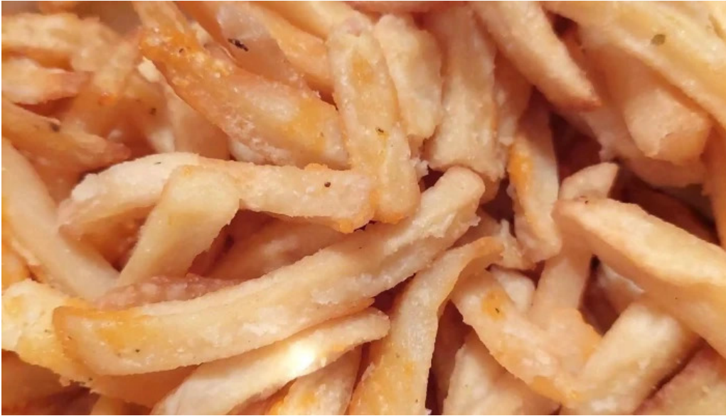
La pasiva comentario 6