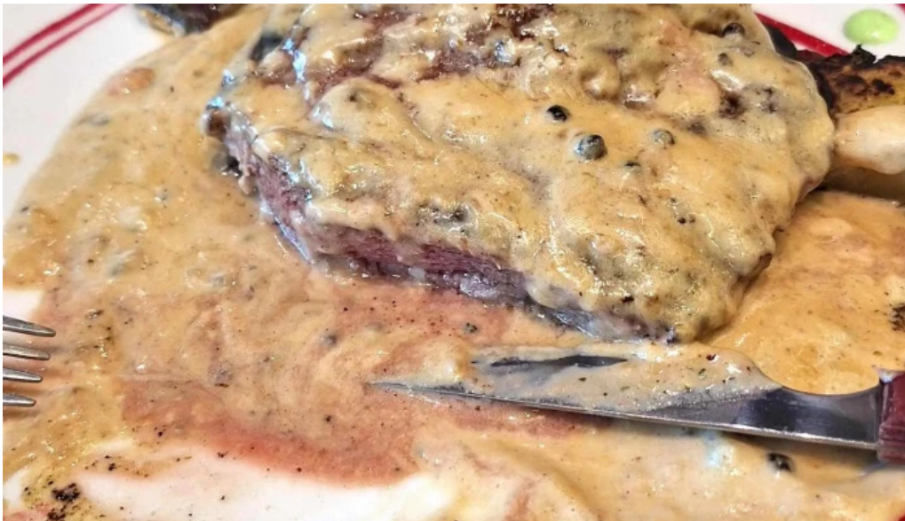
La pasiva comentario 3