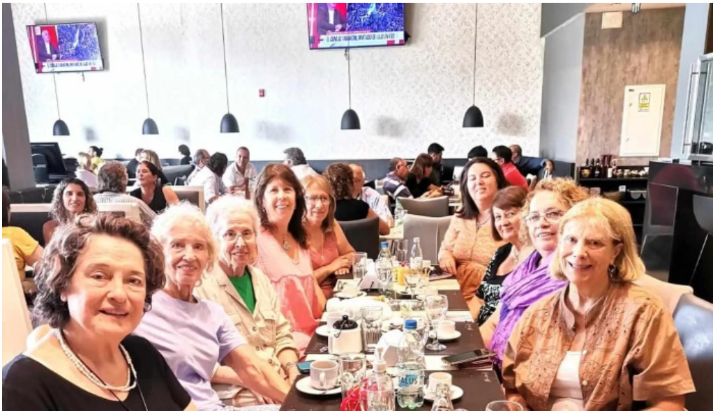
La pasiva comentario 9