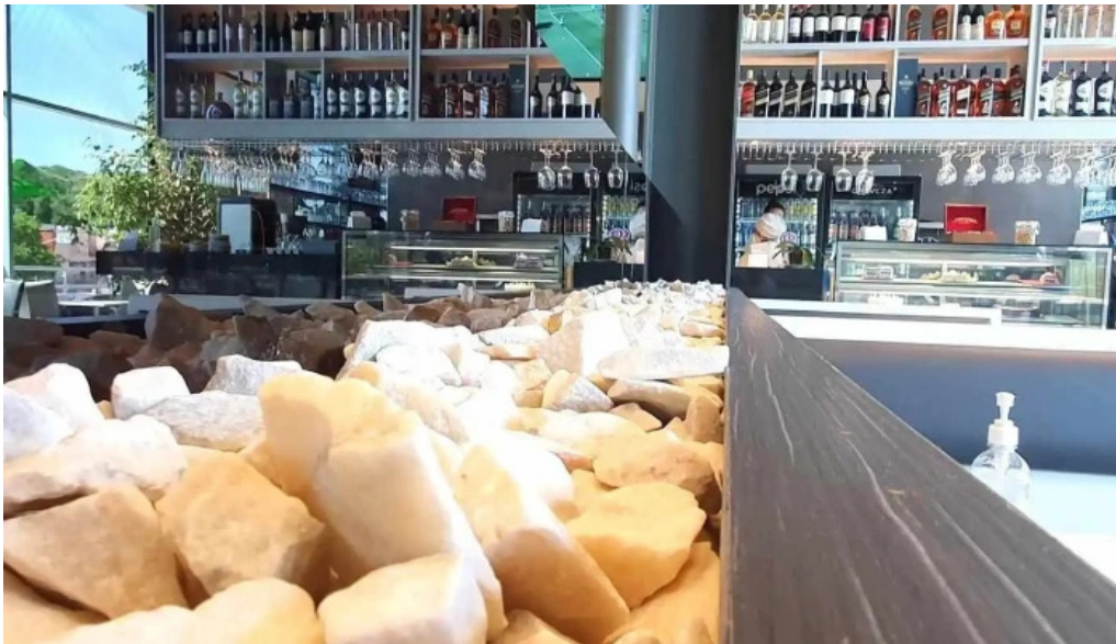
La pasiva montevideo