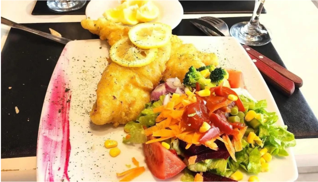
La pasiva comida reconfortante