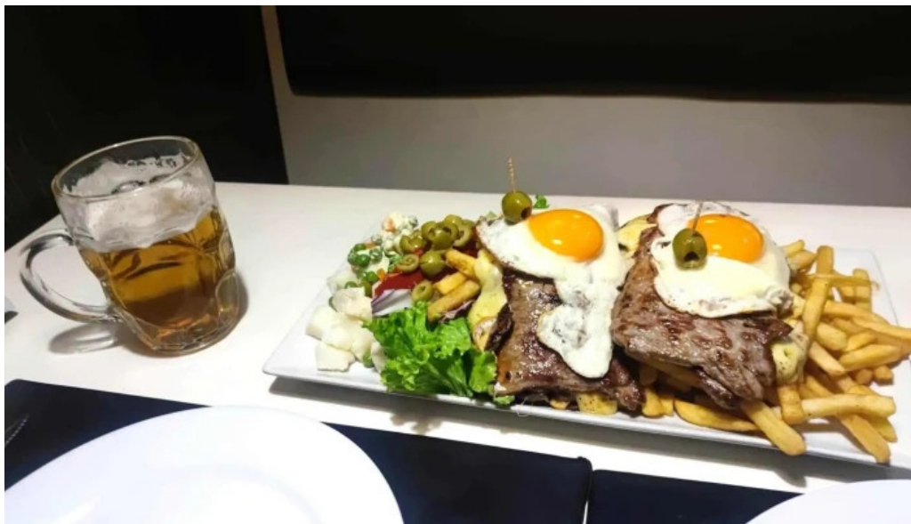
La pasiva comidas y bebidas