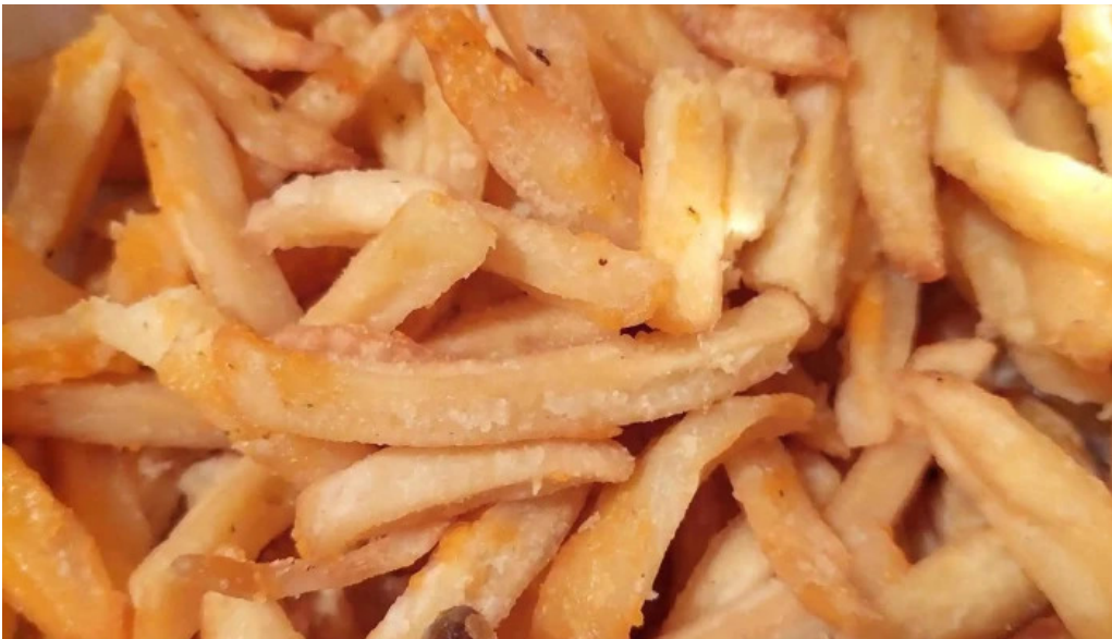
La pasiva comentario 5