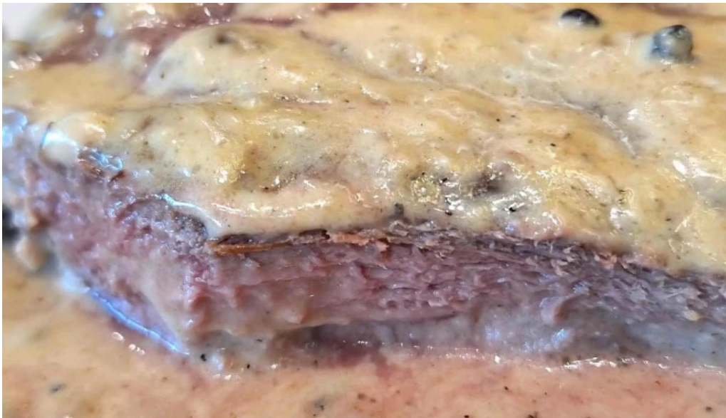
La pasiva comentario 2