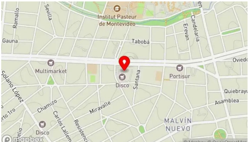
La pasiva mapa