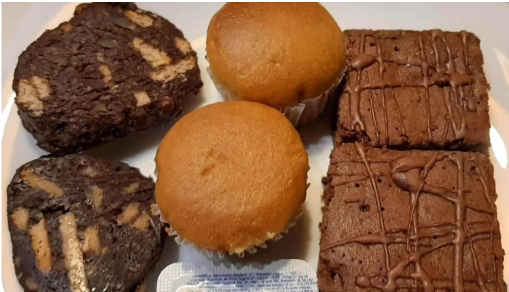
La pasiva comentario 7