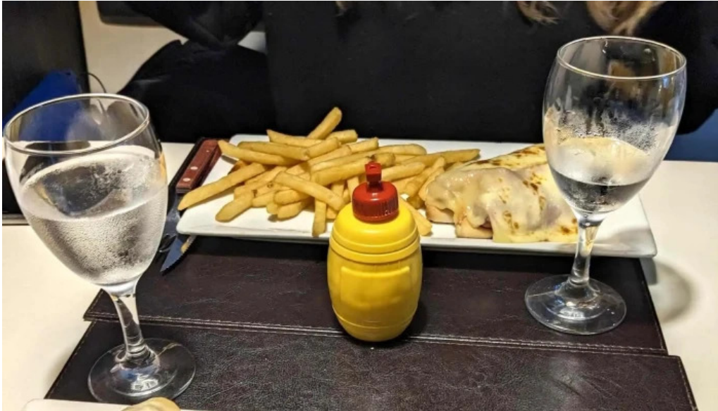
La pasiva comentario 4