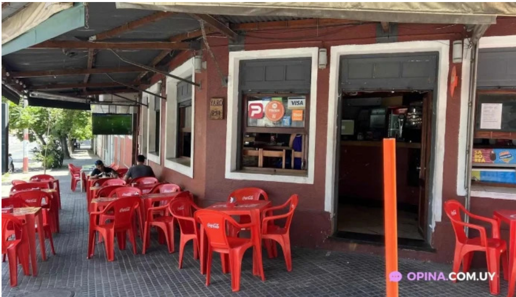
La isla montevideo