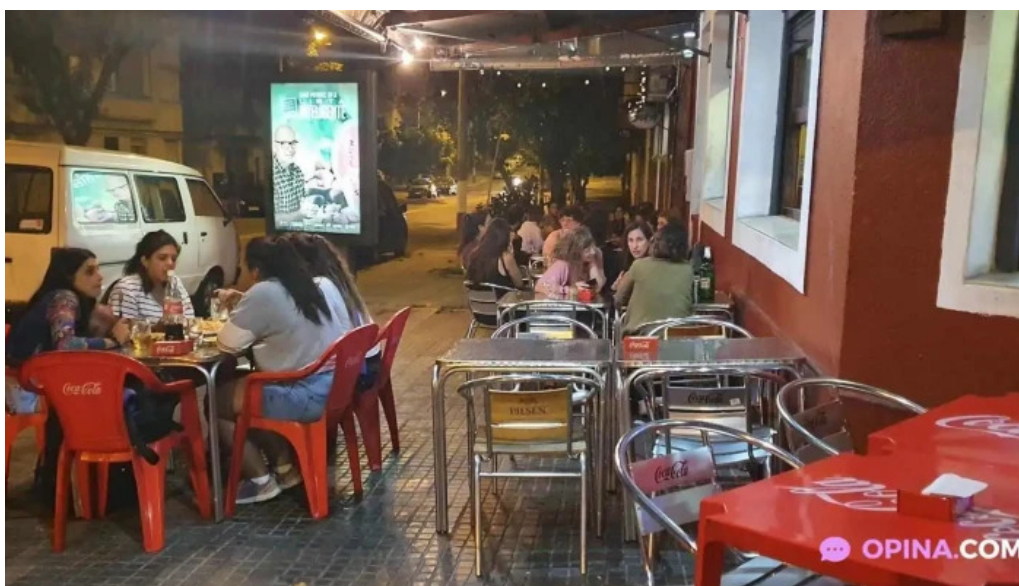
La isla ambiente