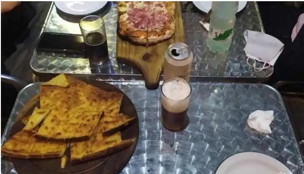
La isla comida reconfortante