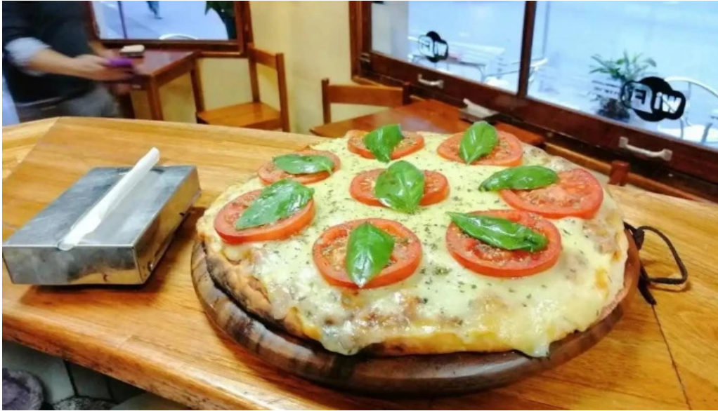
La isla comida y bebida