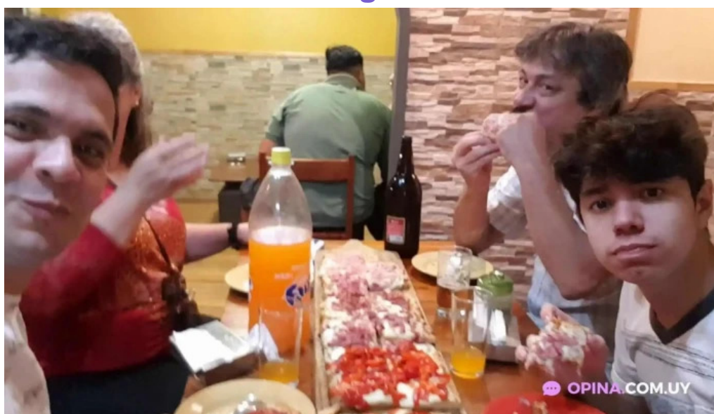
La isla videos