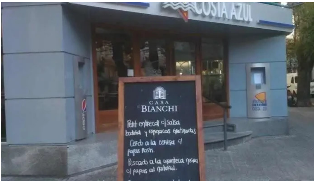
Costa azul menu