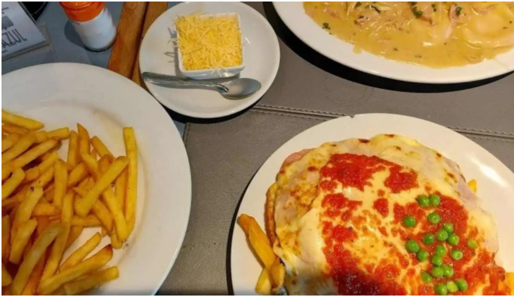
Costa azul milanese