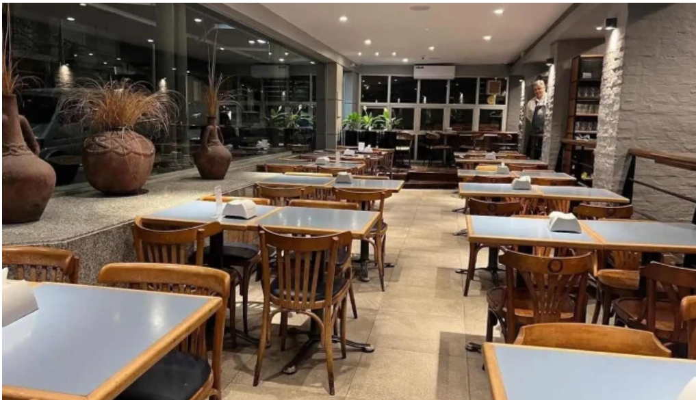
Costa azul todas