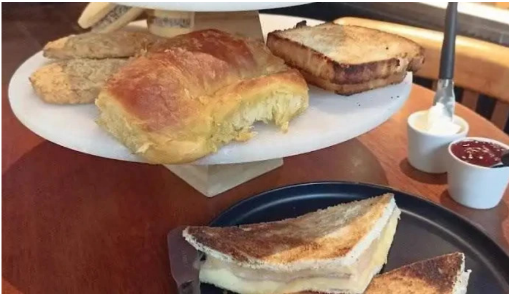
Costa azul comida reconfortante