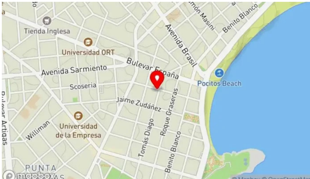
Costa azul mapa