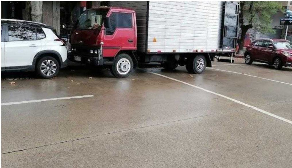
Costa azul mas recientes