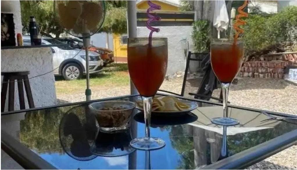
Costa azul todas