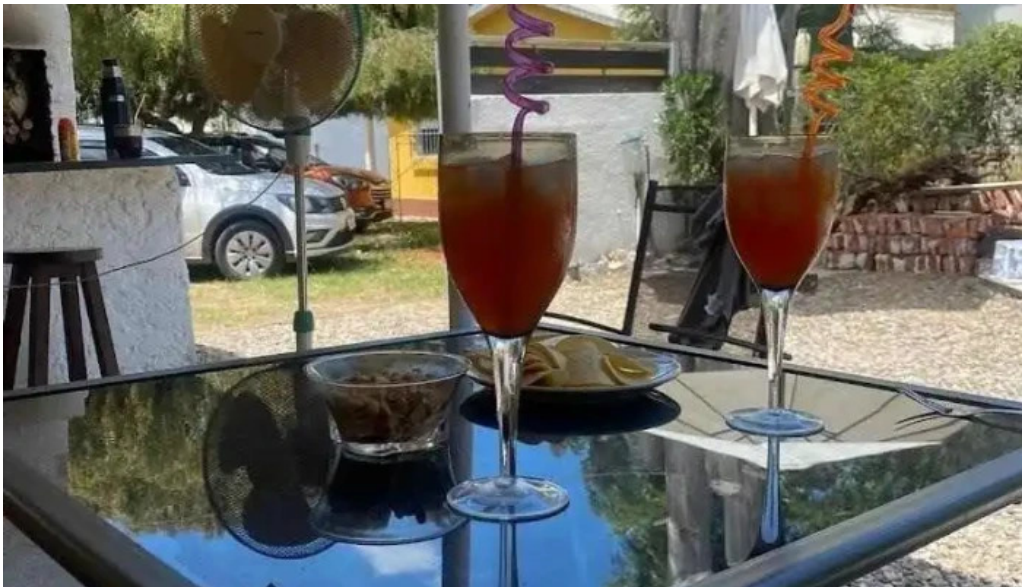
Costa azul montevideo