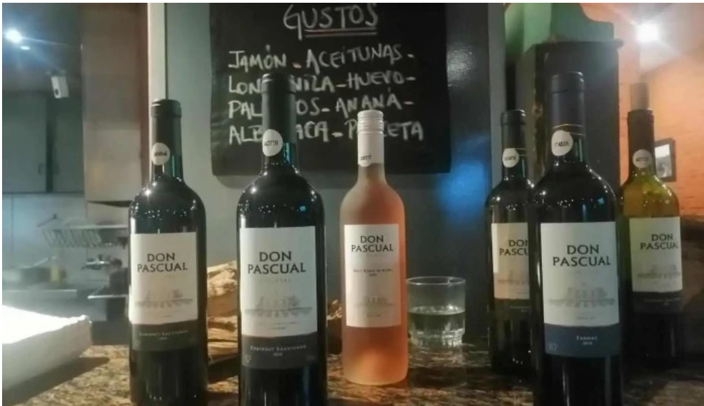
Costa azul menu