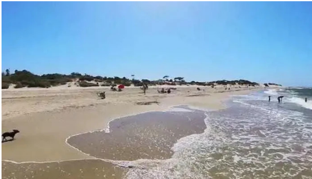
Costa azul videos