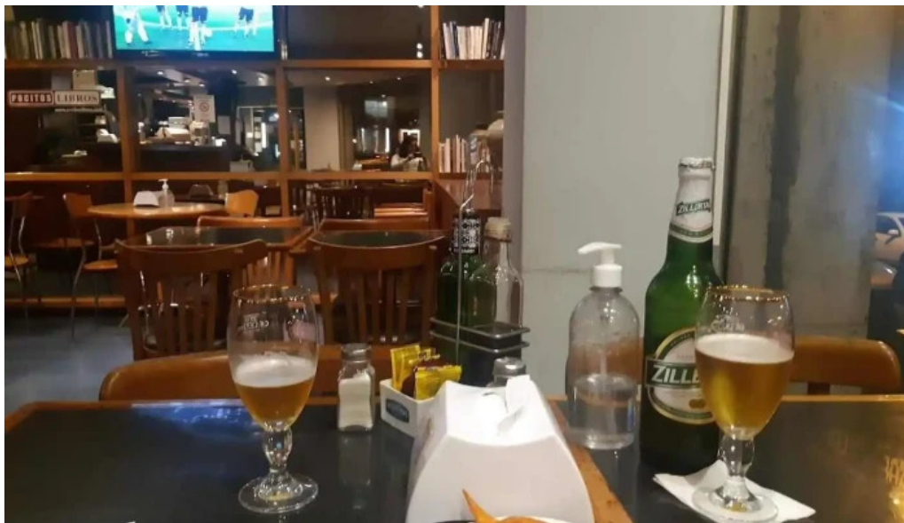
Costa azul comida y bebida