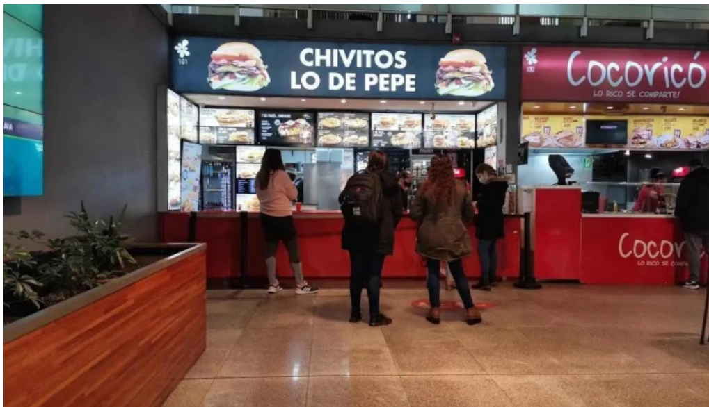
Chivitos lo de pepe montevideo