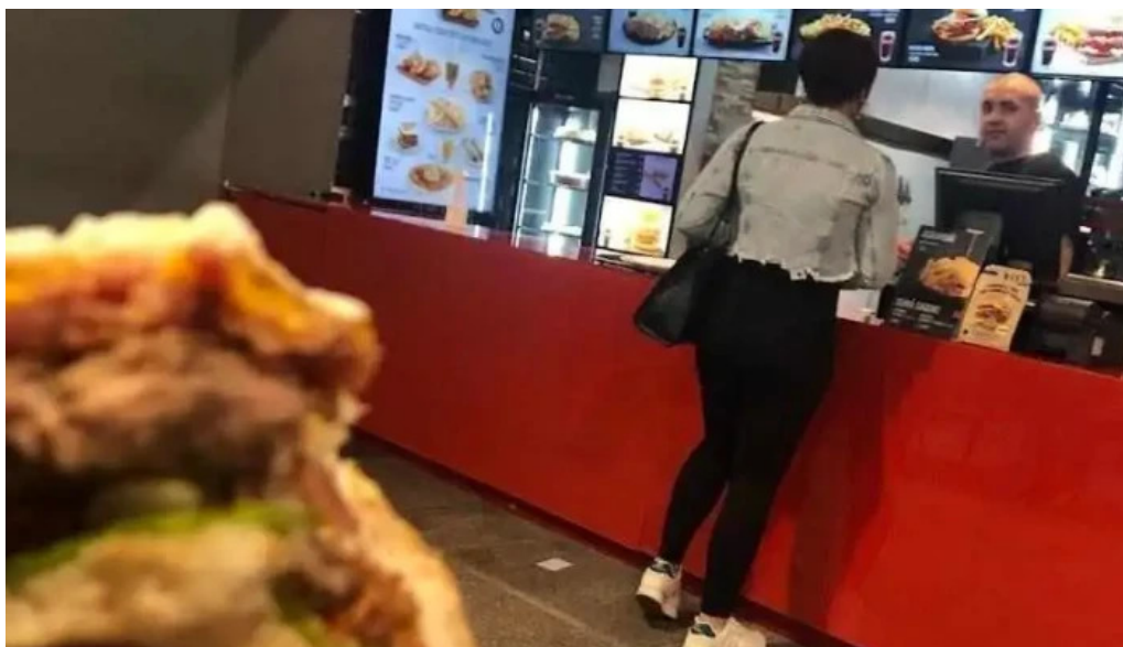
Chivitos lo de pepe comida reconfortante