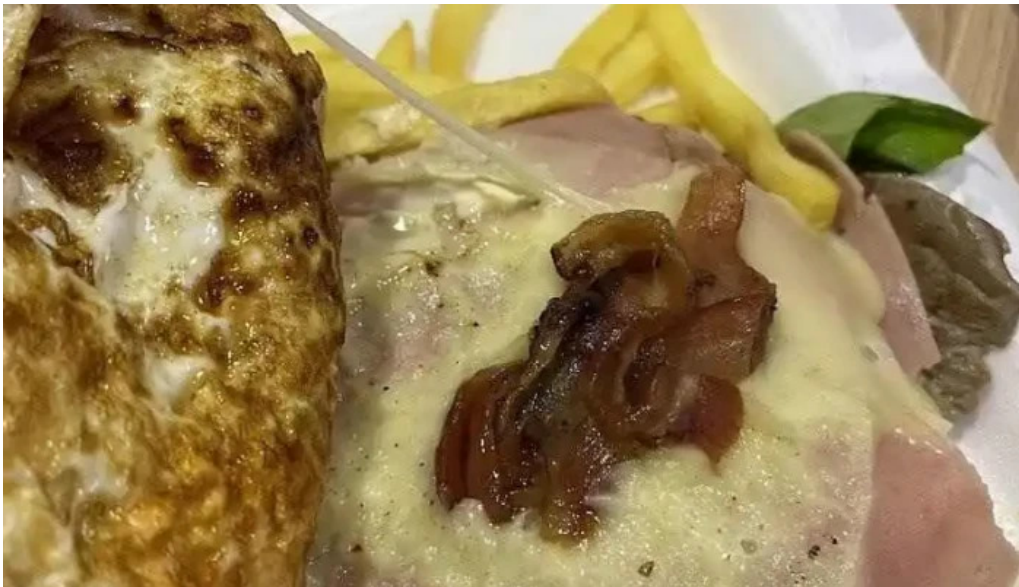
Chivitos lo de pepe mas recientes