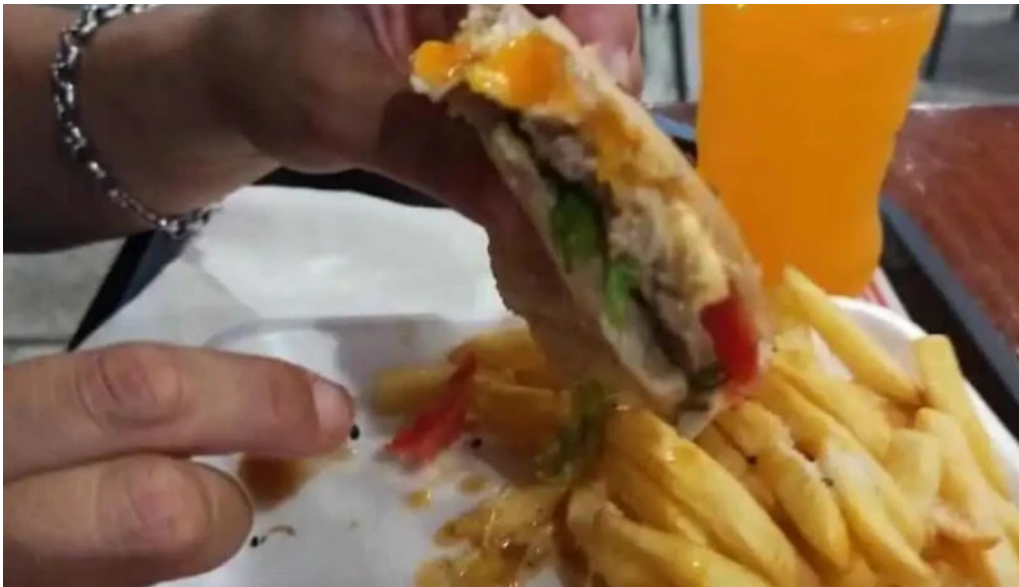
Chivitos lo de pepe comida y bebida