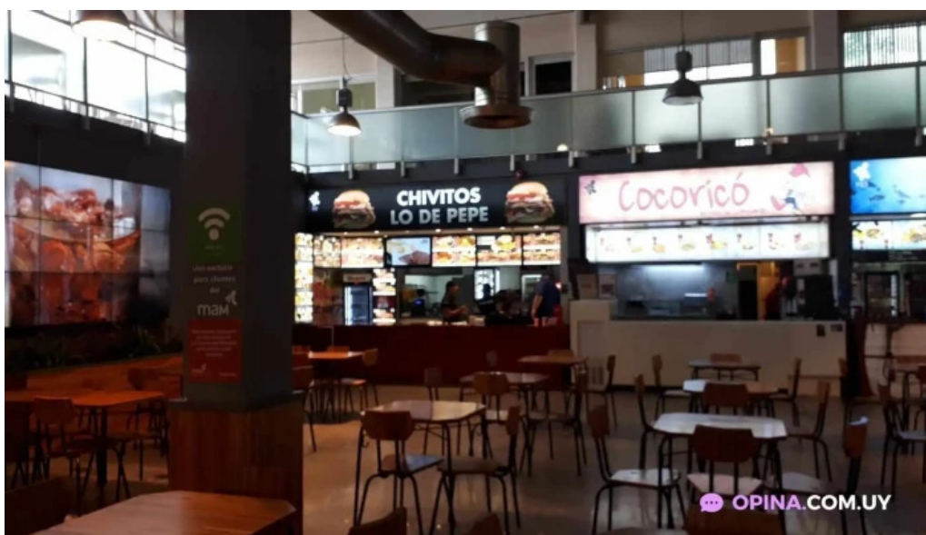
Chivitos lo de pepe ambiente