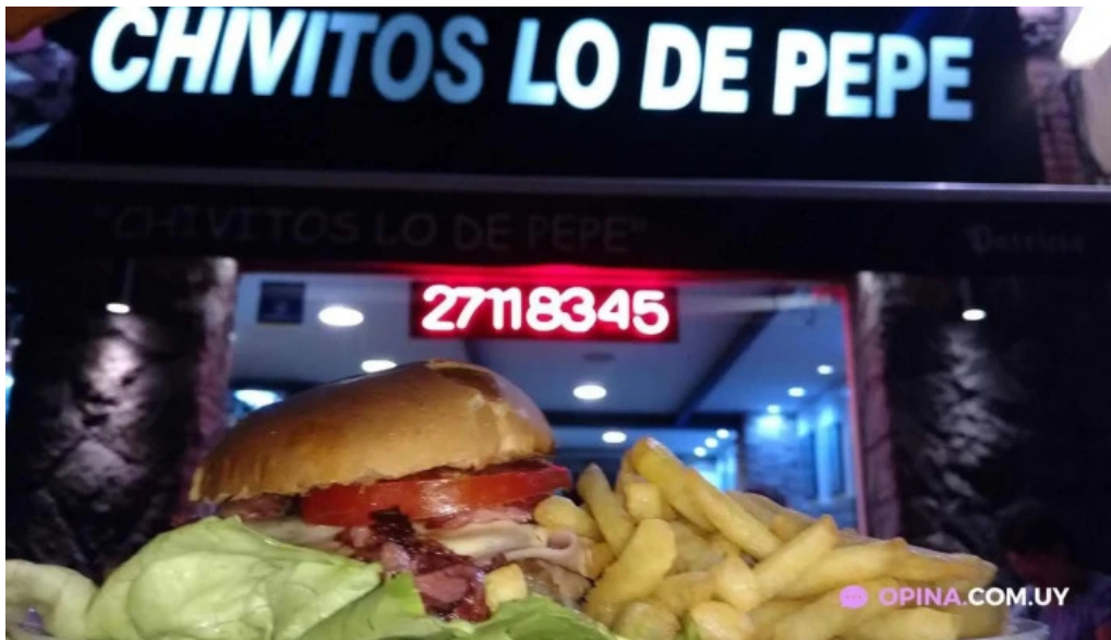
Chivitos lo de pepe papas fritas