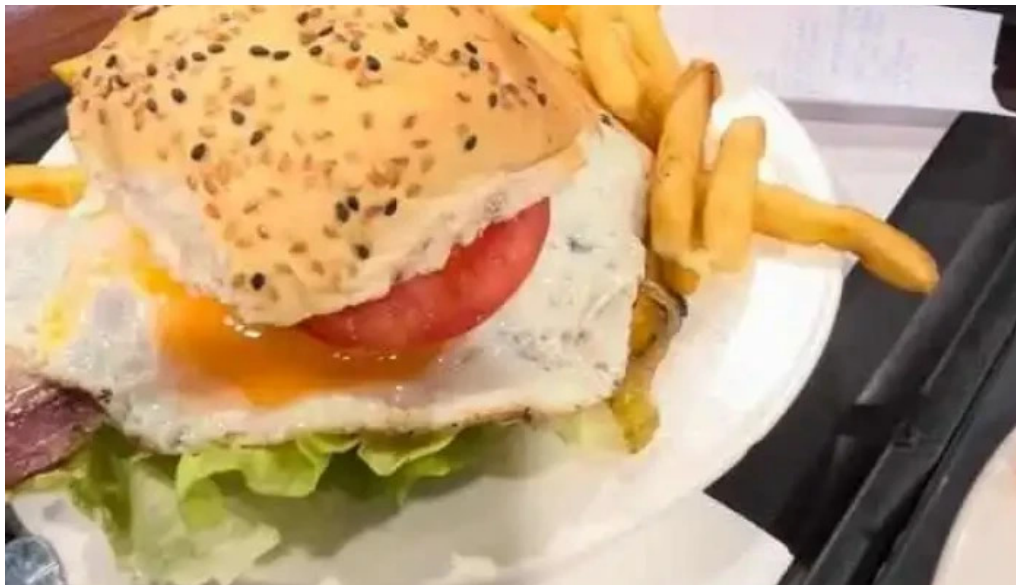
Chivitos lo de pepe videos