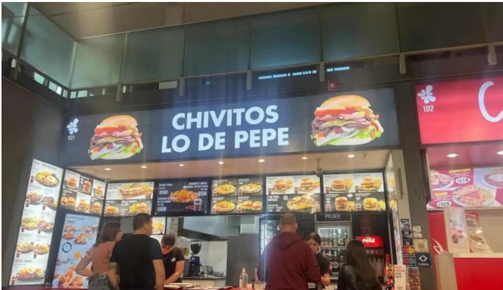
Chivitos lo de pepe menu