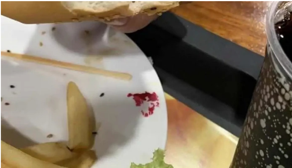
Chivitos lo de pepe hamburguesa