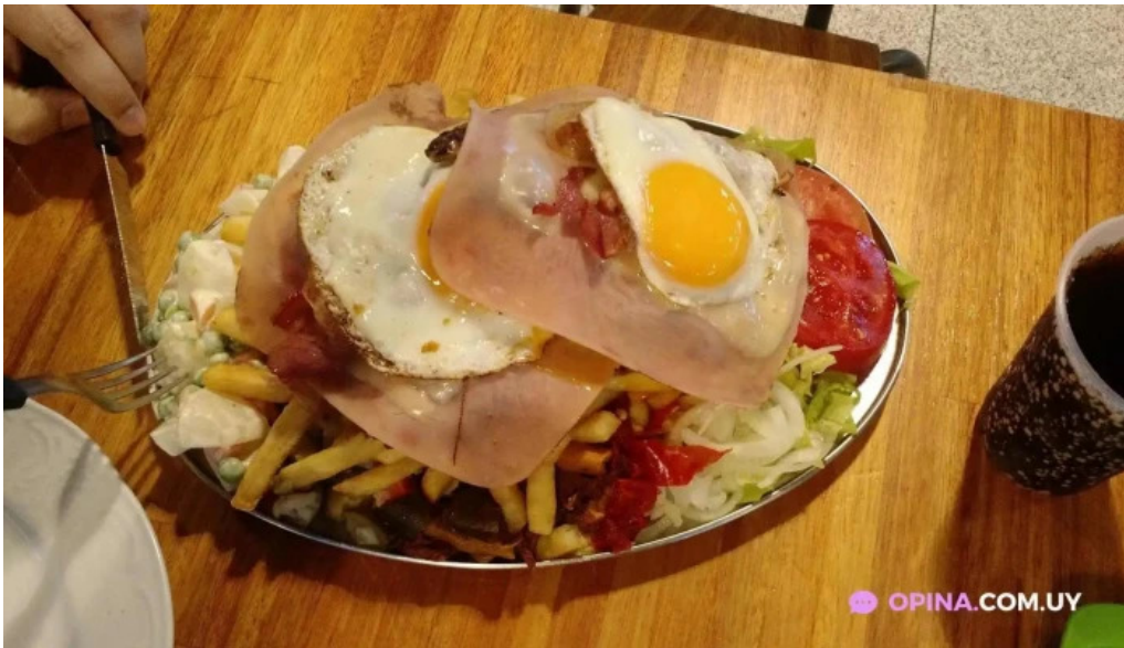
Chivitos lo de pepe milanesa