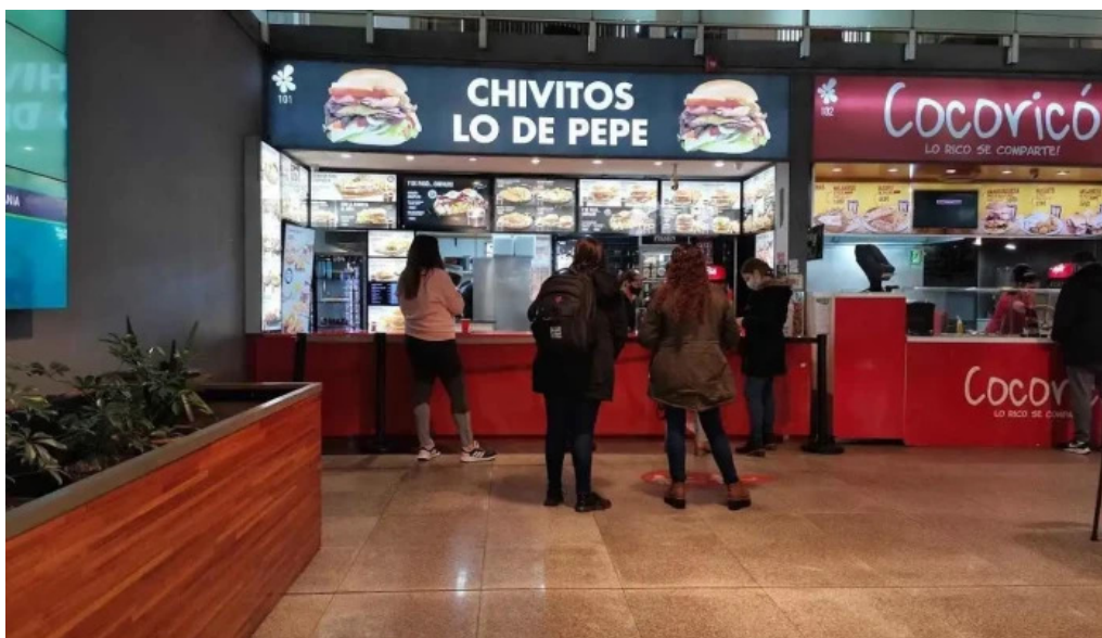
Chivitos lo de pepe todas