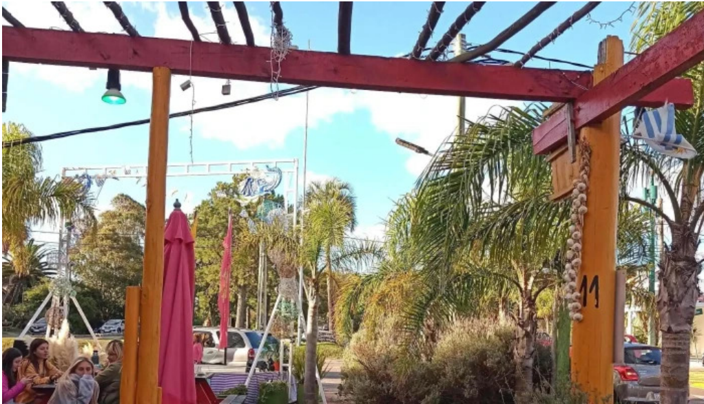
Medialunas calentitas comentario 4