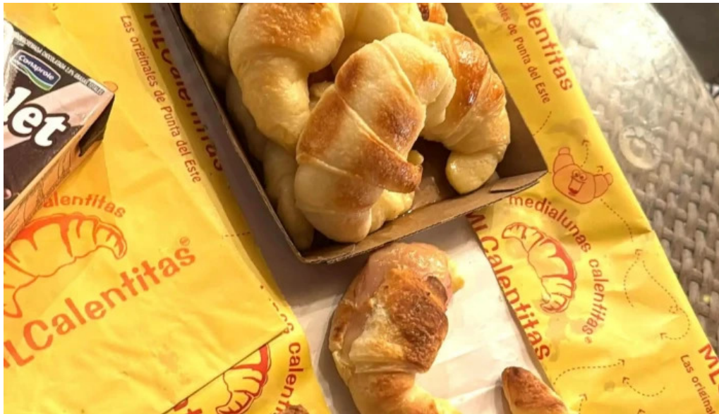
Medialunas calentitas comentario 1