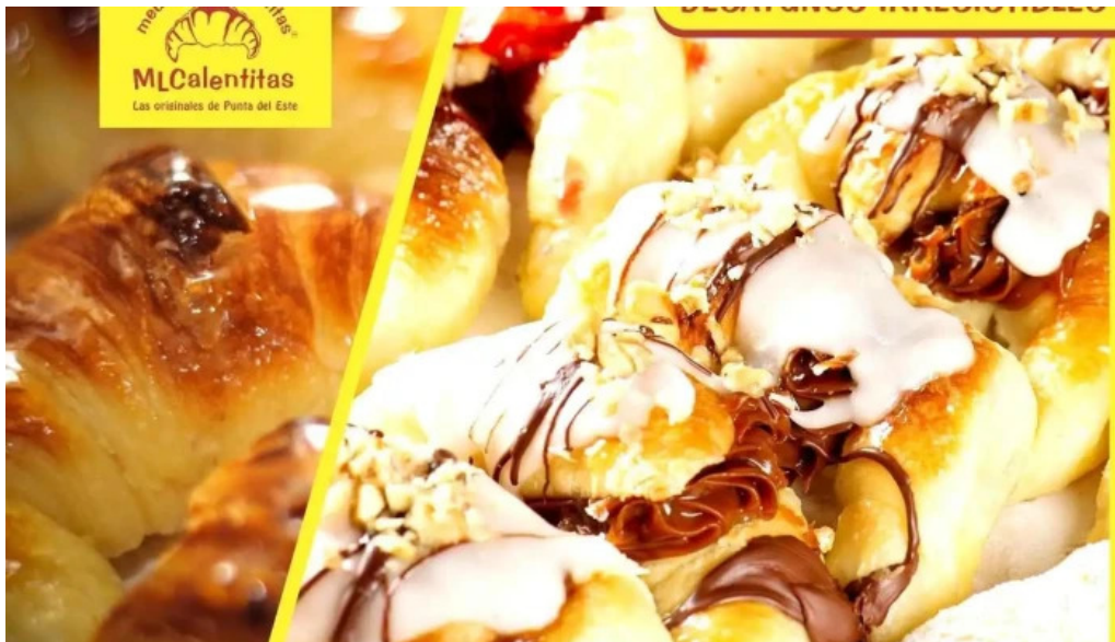
Medialunas calentitas comidas y bebidas