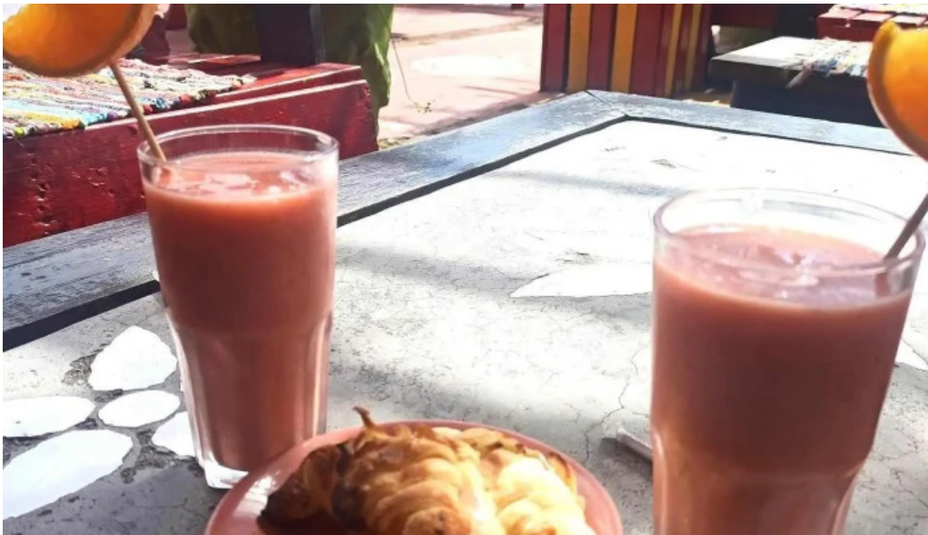
Medialunas calentitas jugo