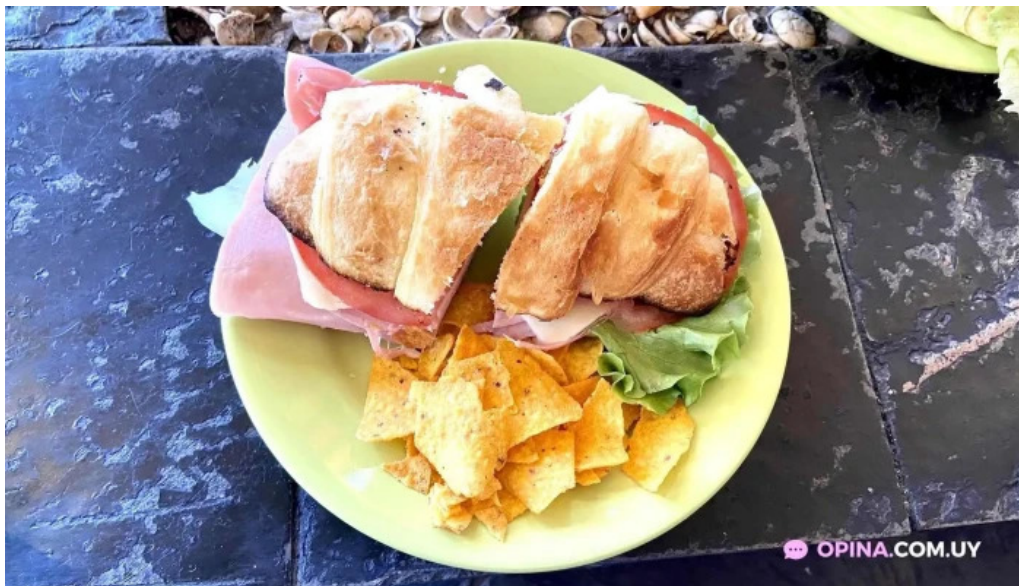
Medialunas calentitas comida reconfortante