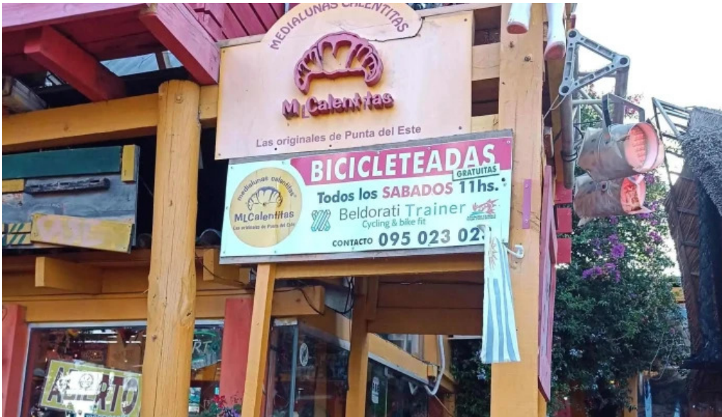
Medialunas calentitas comentario 3