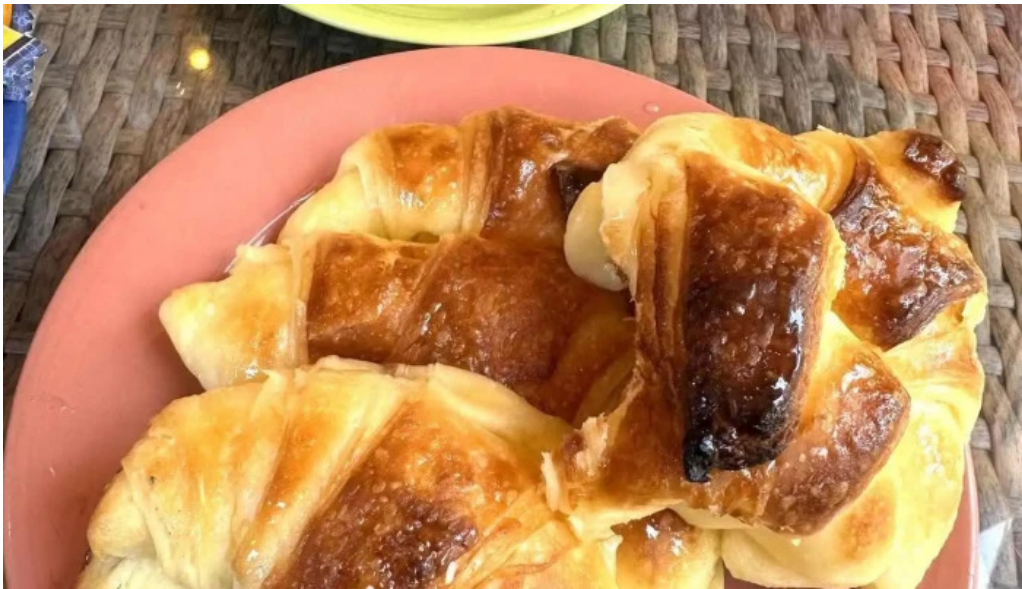
Medialunas calentitas croissant