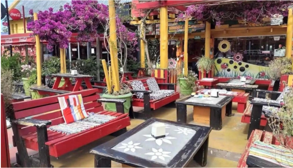
Medialunas calentitas la barra