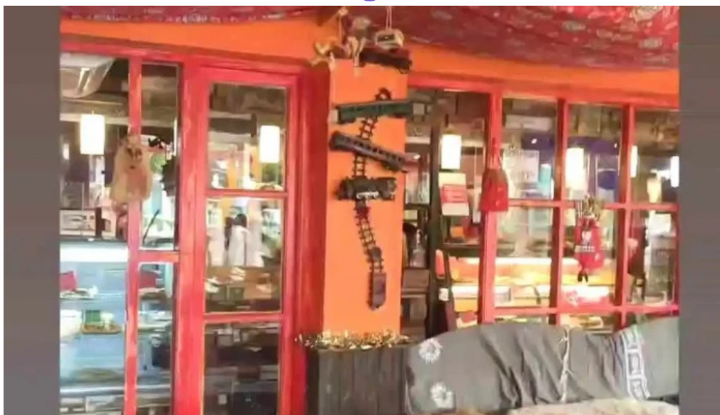
Medialunas calentitas videos