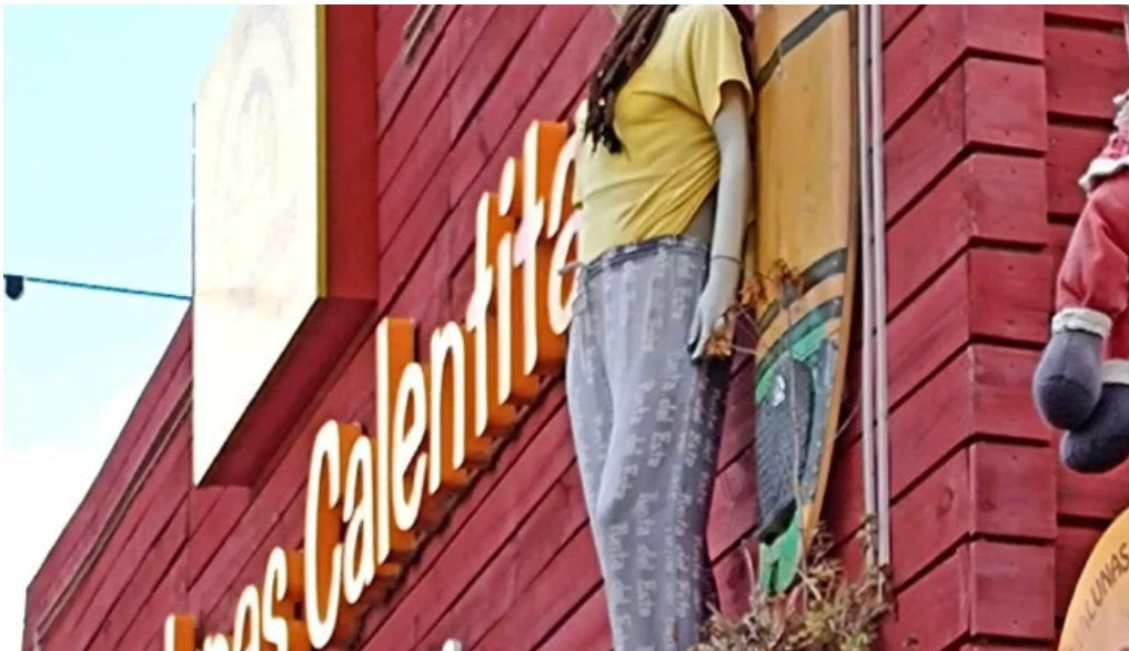
Medialunas calentitas comentario 2