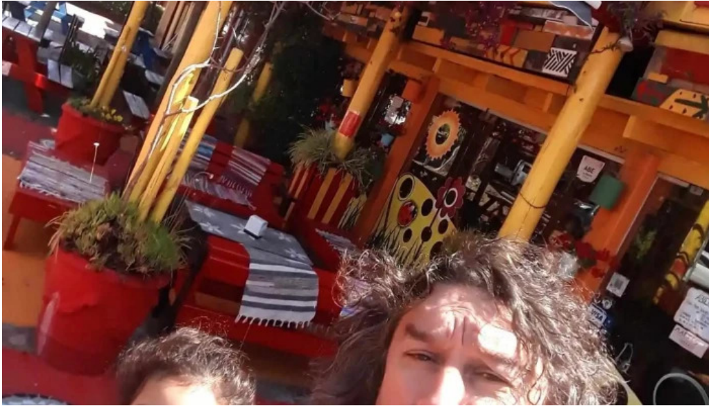
Medialunas calentitas del propietario