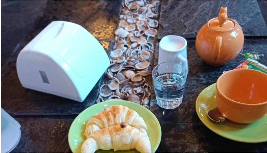
Medialunas calentitas comentario 5