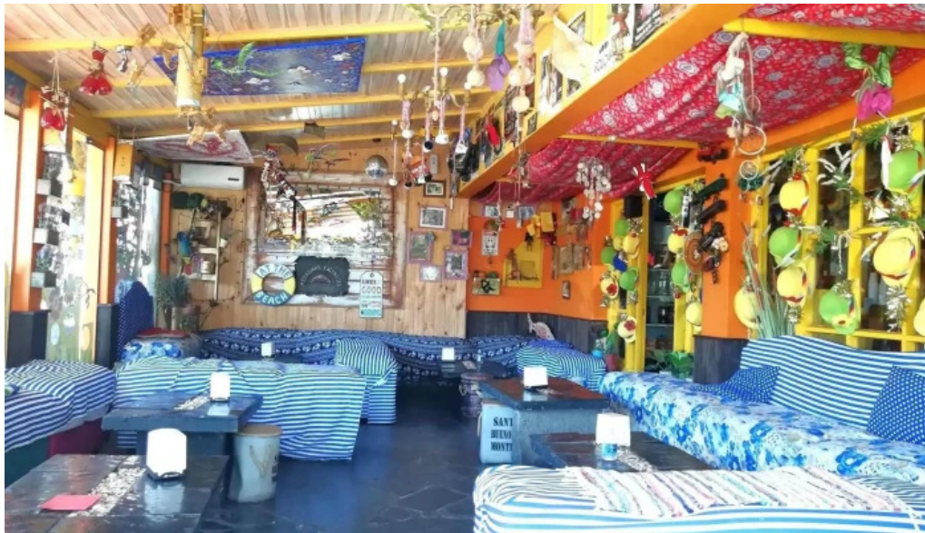
Medialunas calentitas ambiente