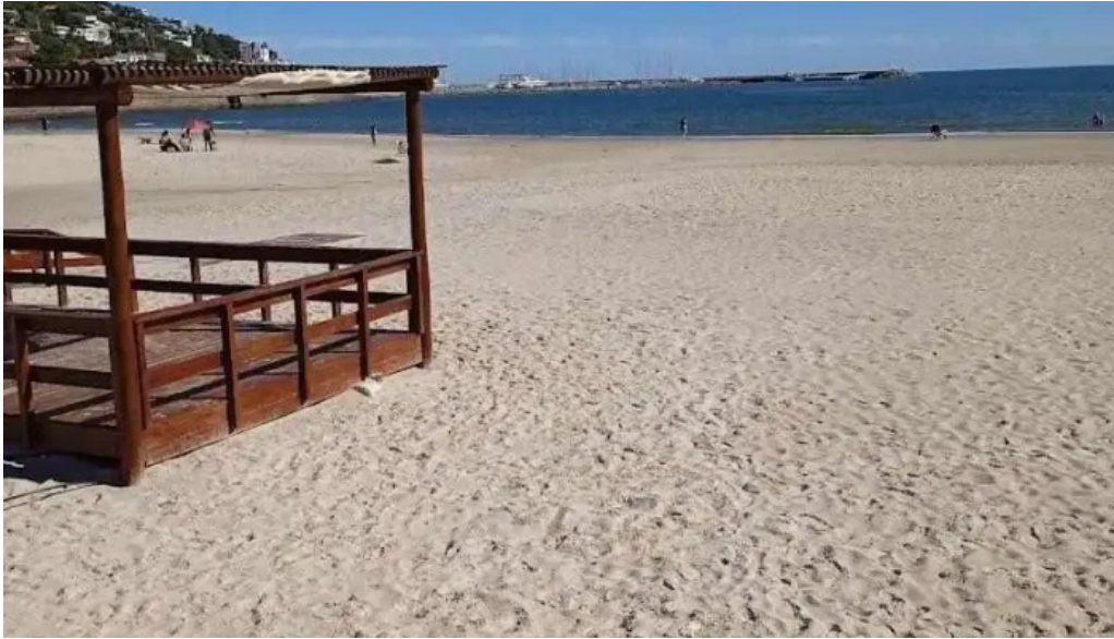
Mcdonalds mas recientes