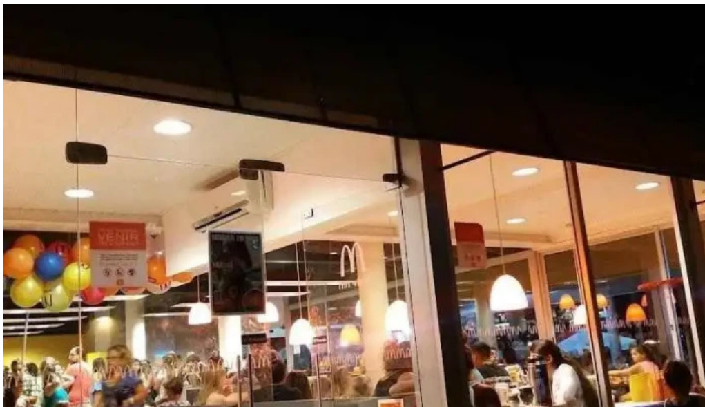
Mcdonald s piriapolis