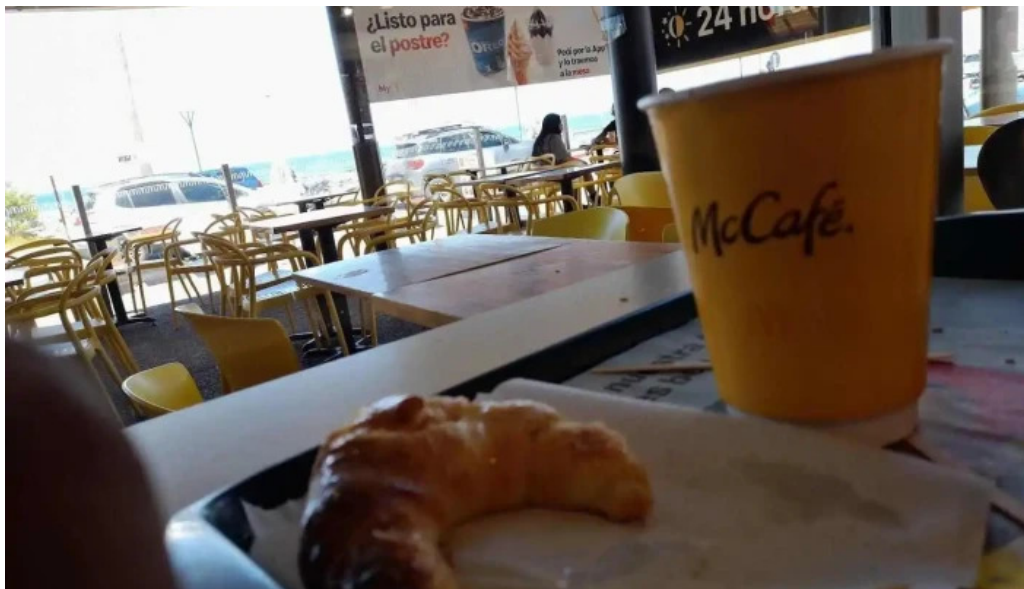
McDonalds comida y bebida