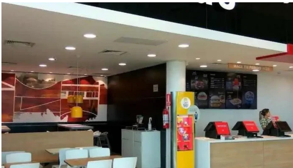
McDonald s las piedras