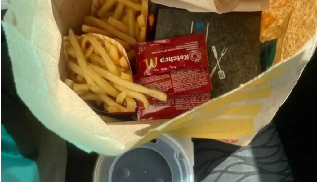
Mcdonalds papas fritas