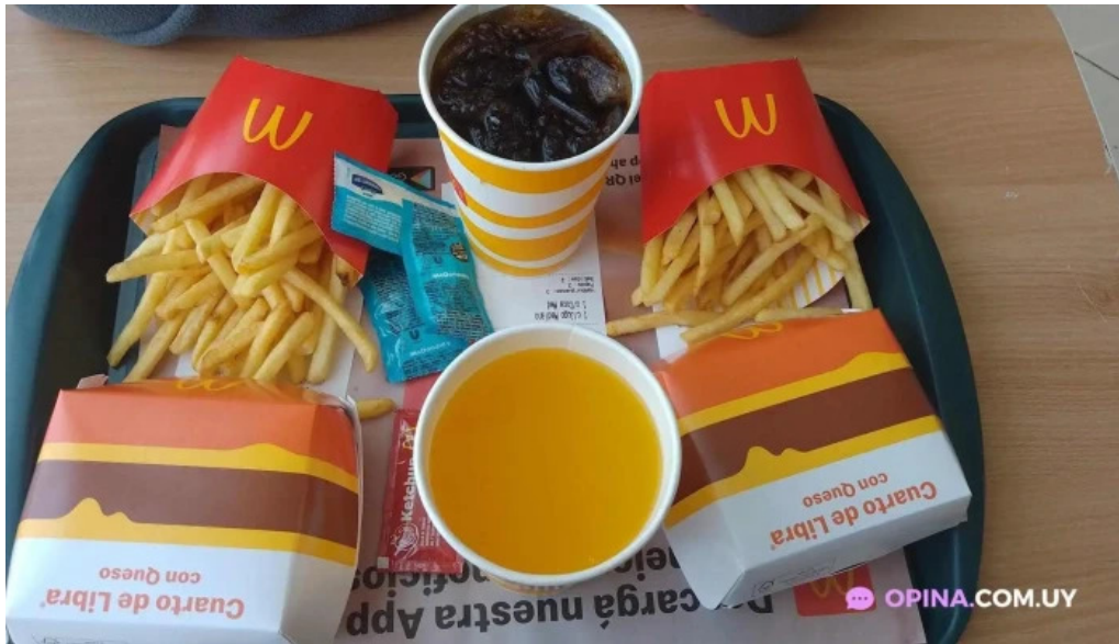
McDonalds comida reconfortante