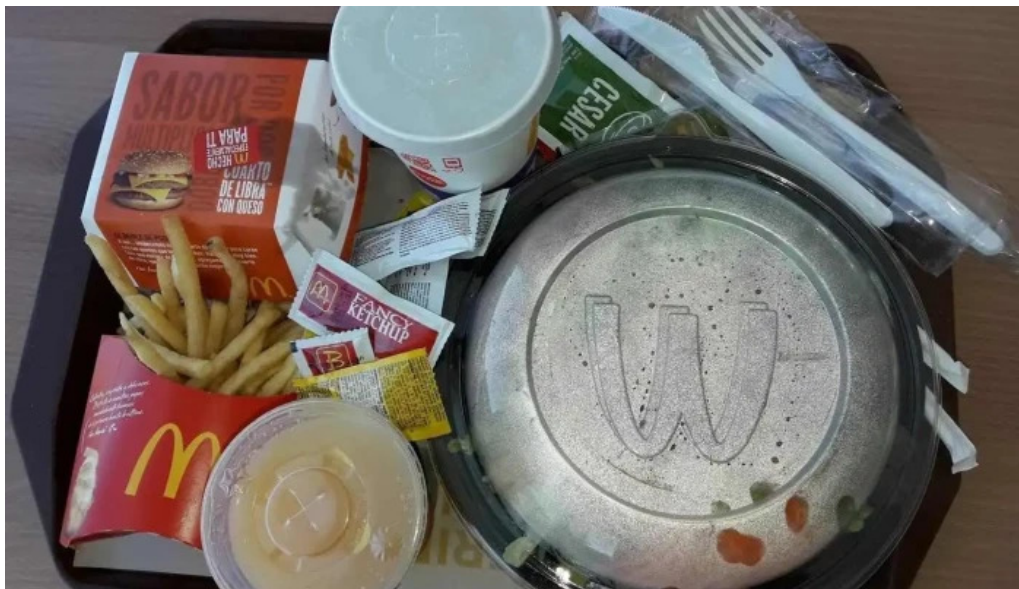
McDonalds comida y bebida