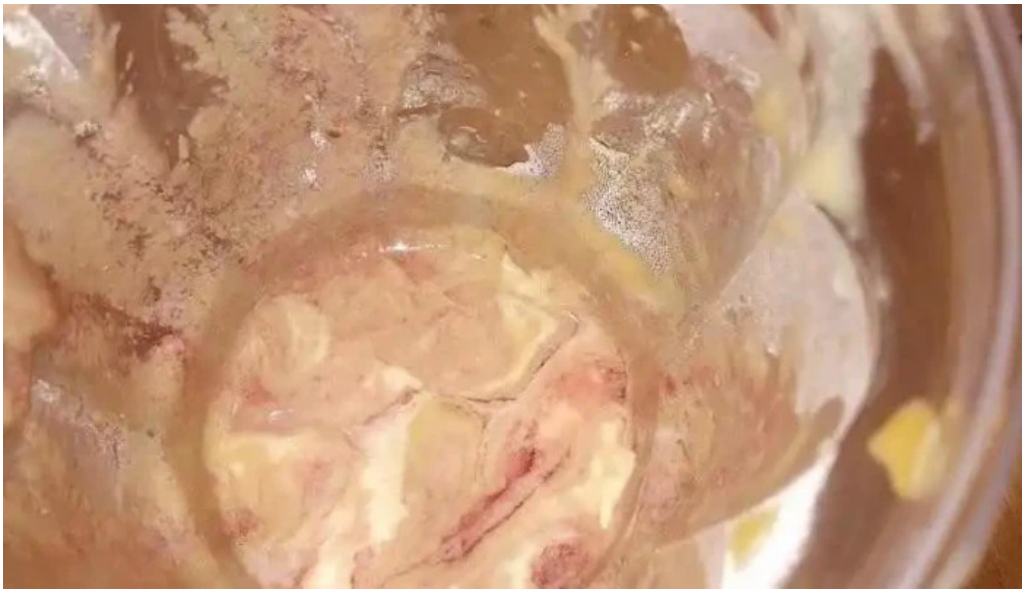
Mcdonalds mas recientes