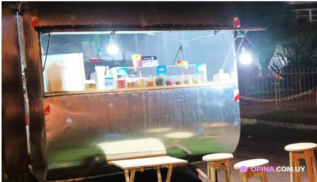
Lo de bargas del propietario