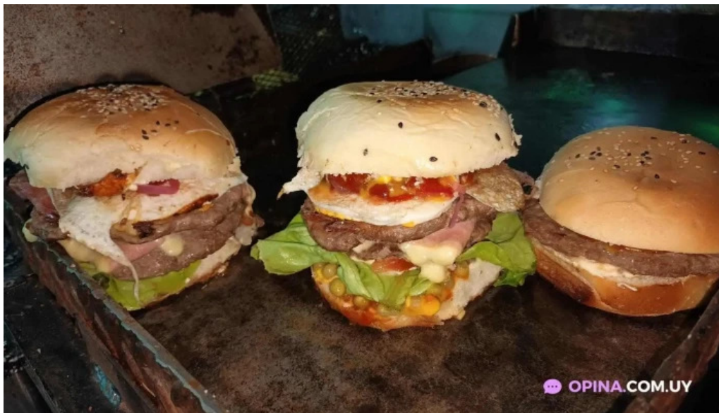
Lo de bargas comida y bebida