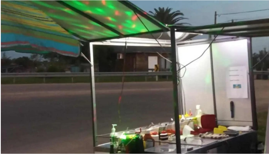
Lo de bargas treinta y tres