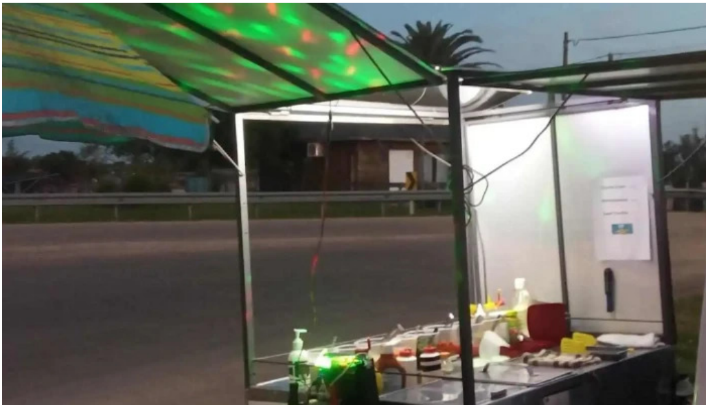
Lo de bargas todas