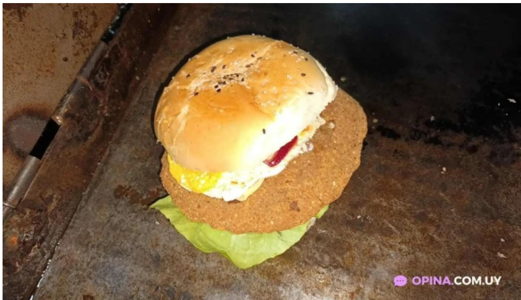
Lo de bargas hamburguesa