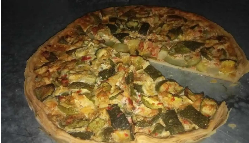
Lo de bargas comida reconfortante