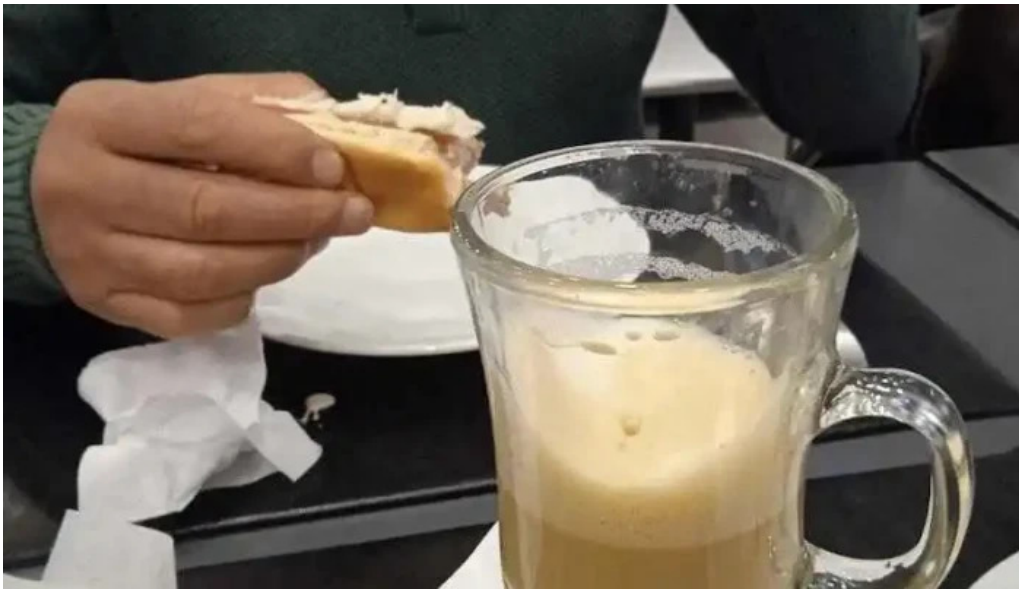
La pasiva comida y bebida