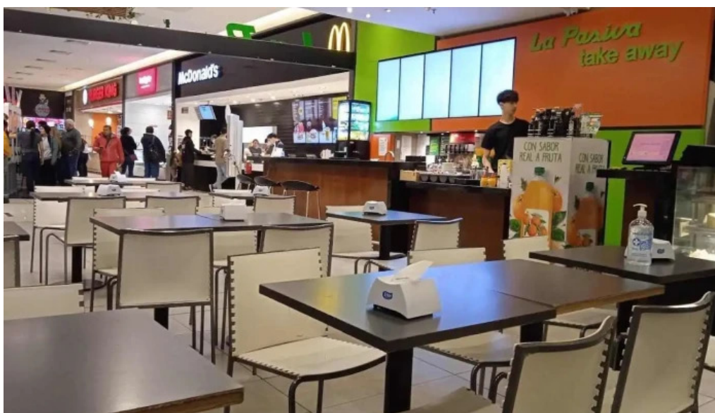
La pasiva ambiente