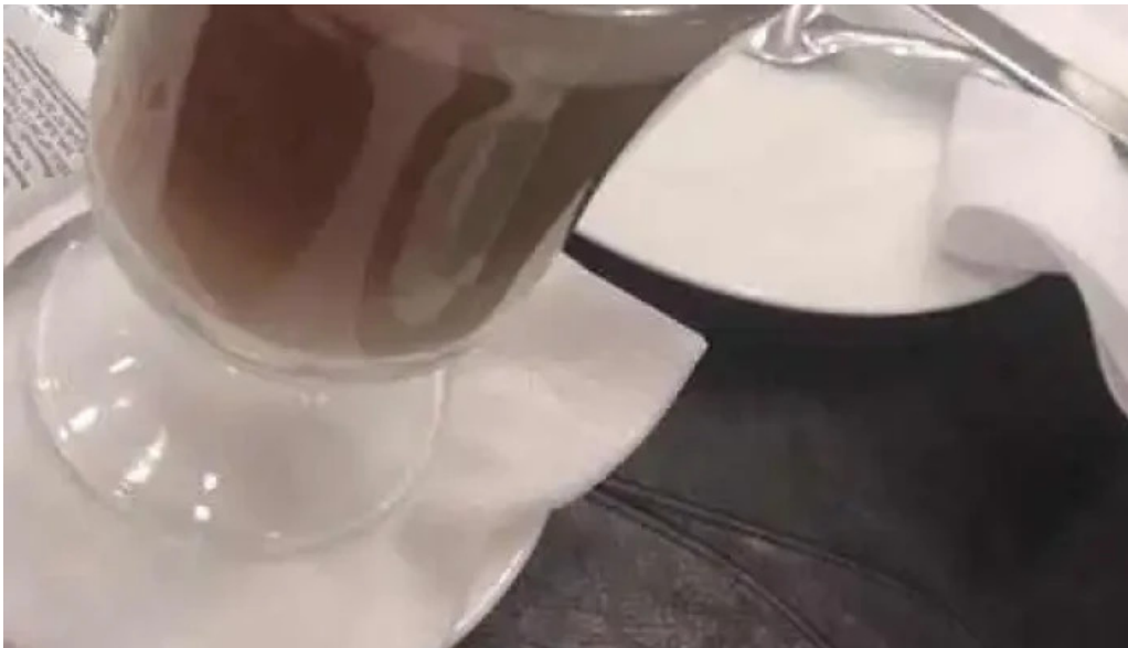
La pasiva capuchino