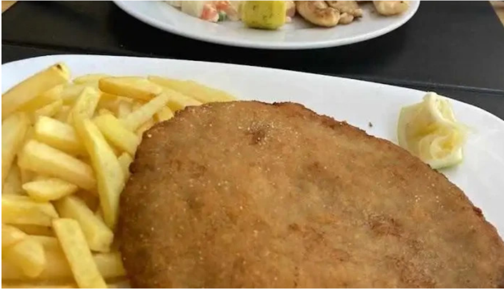
La pasiva papas fritas