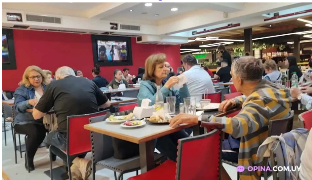
La pasiva videos