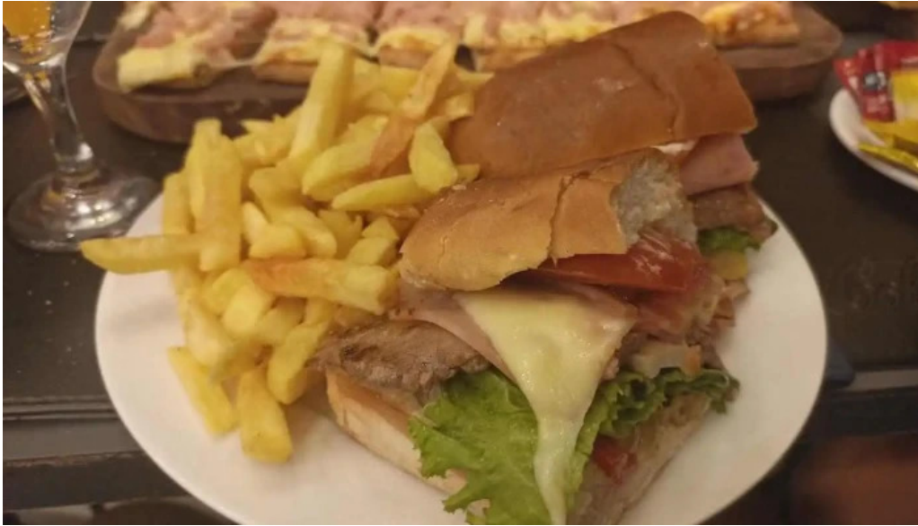
La pasiva comida reconfortante