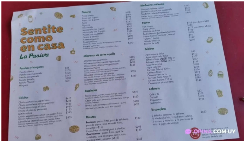
La pasiva menu