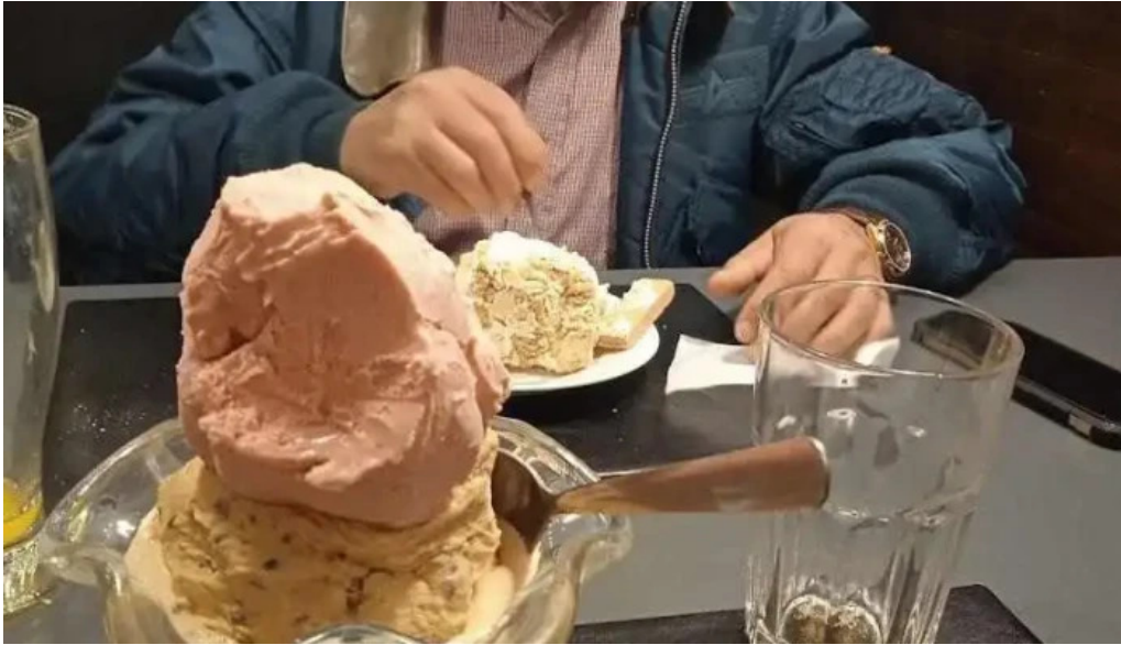
La pasiva helado