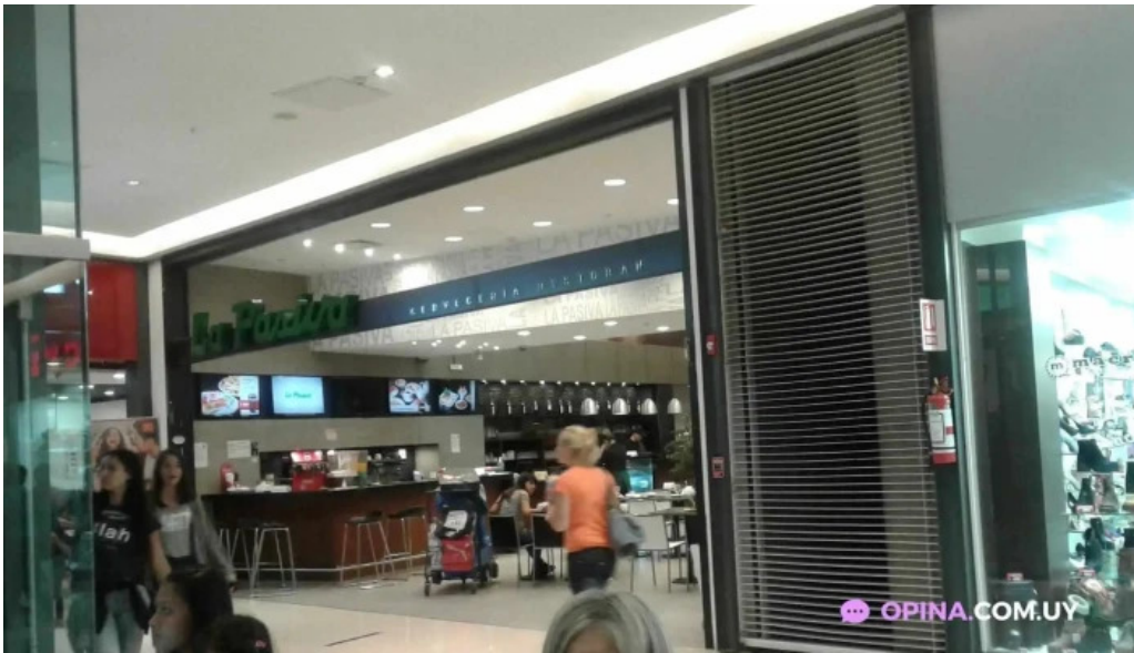
La pasiva montevideo