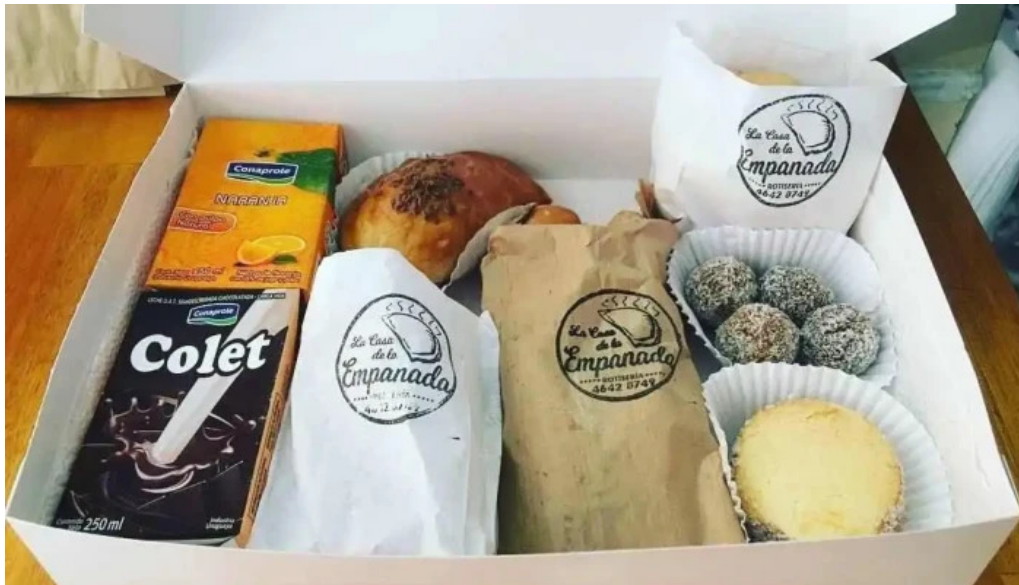
La casa de la empanada comida y bebida