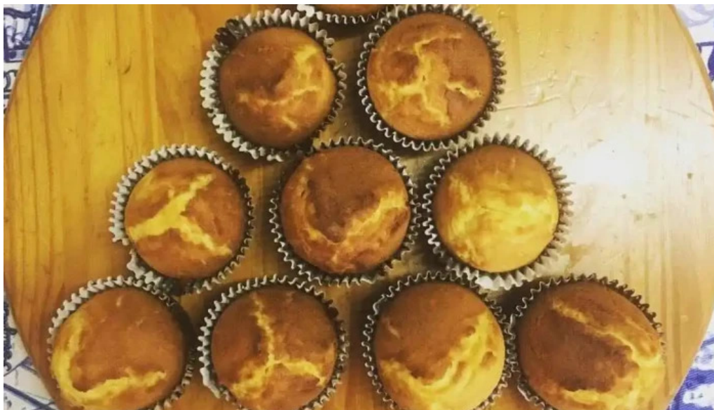
La casa de la empanada comida reconfortante