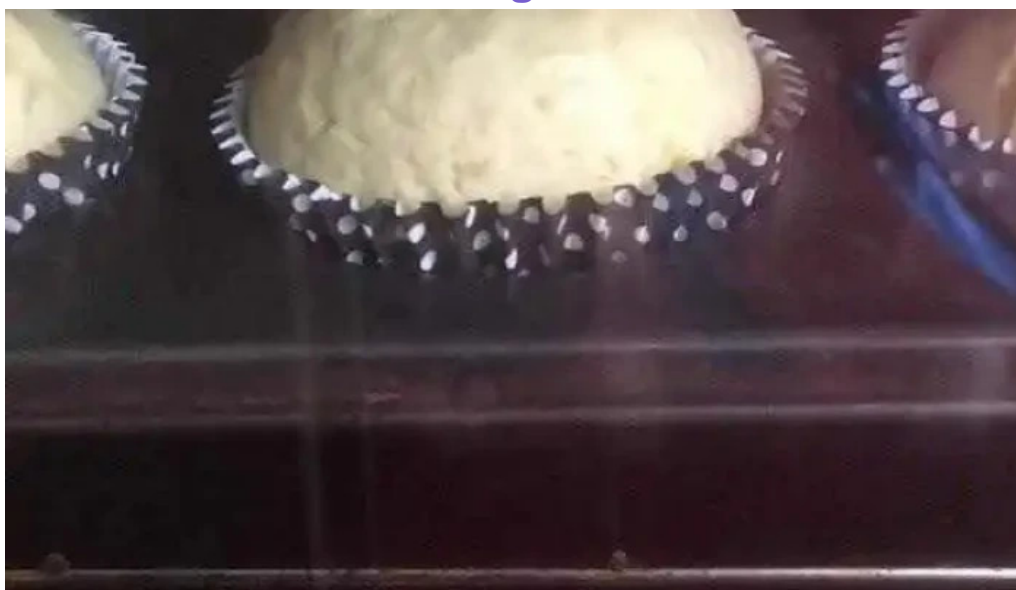
La casa de la empanada videos