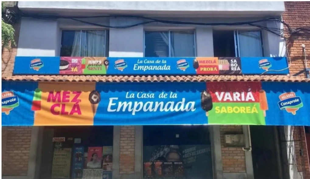
La casa de la empanada todas