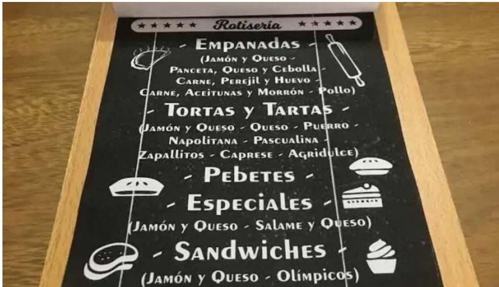
La casa de la empanada menu