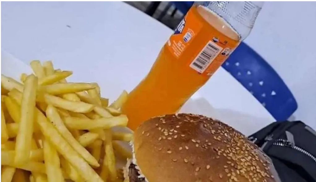
Facuntino comida reconfortante