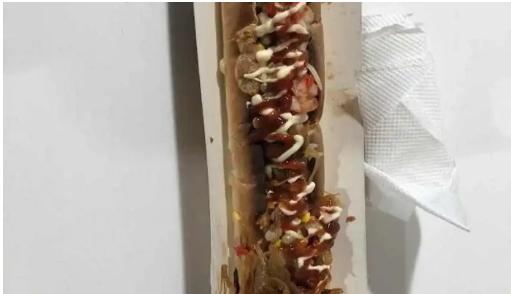
Facuntino comida y bebida