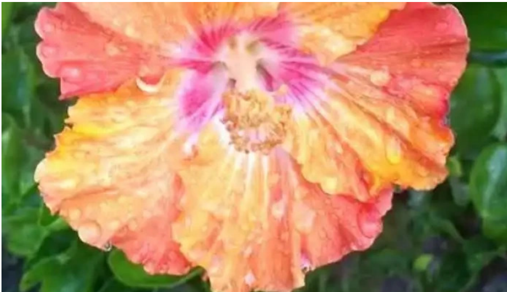
El gordo y yo juan l lacaze