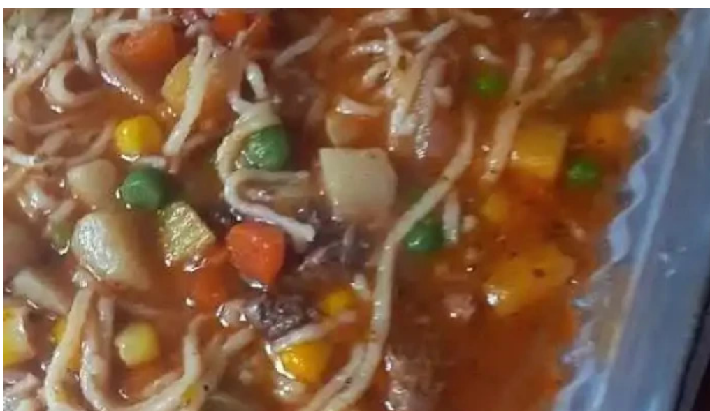
El gordo y yo comida reconfortante