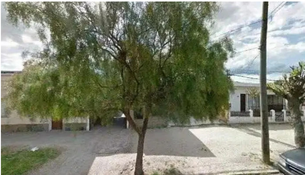
El gordo y yo street view y 360