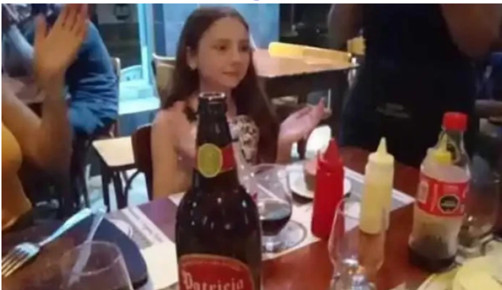
El borrego restaurante videos