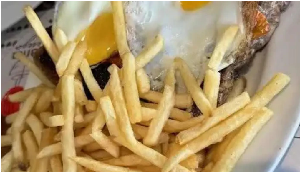
El borrego restaurante mas recientes