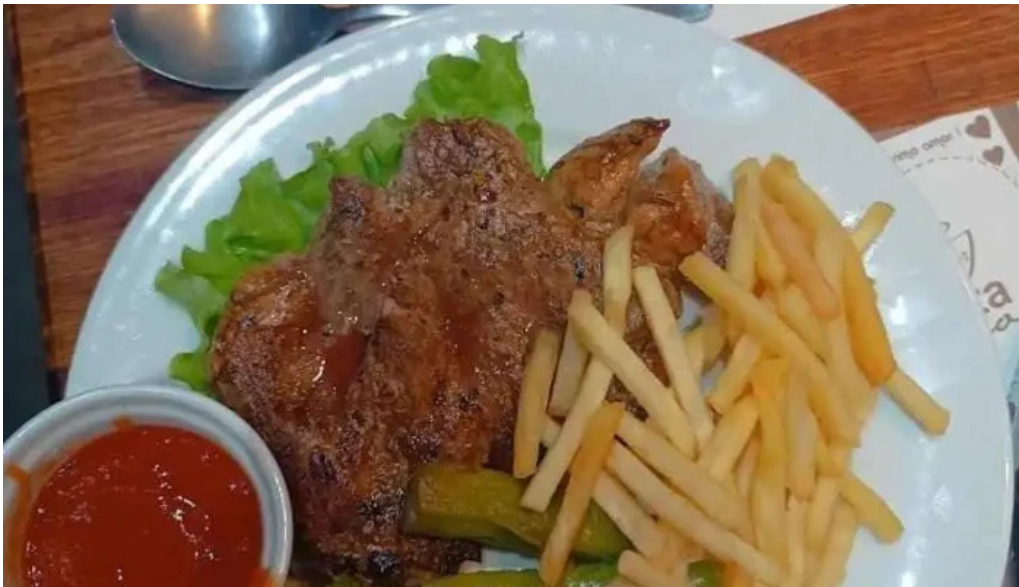
El borrego restaurante san jacobo