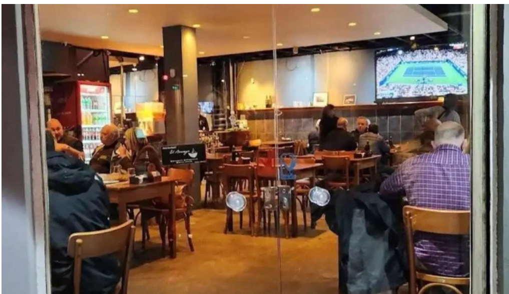
El borrego restaurante todas