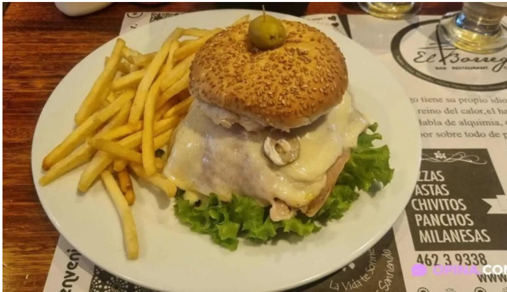
El borrego restaurante papas fritas