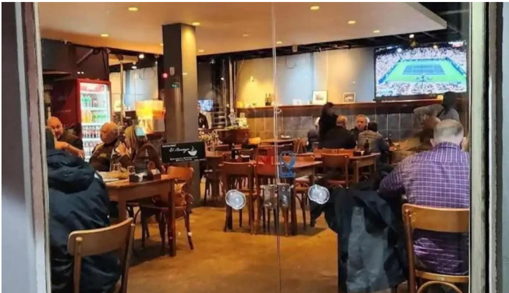
El borrego restaurante rivera