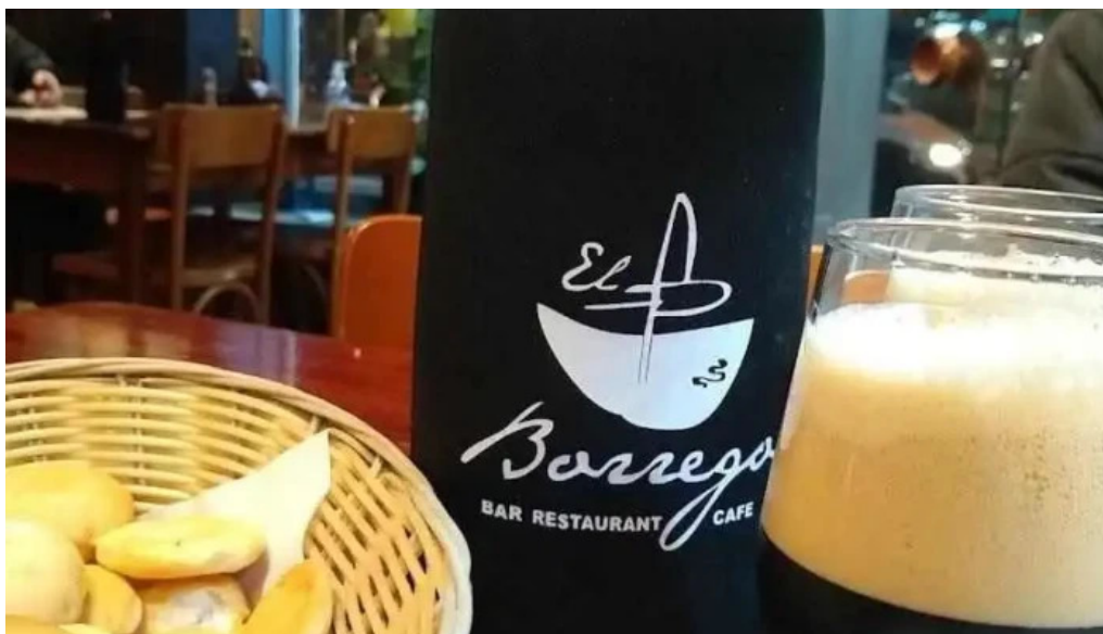
El borrego restaurante cerveza