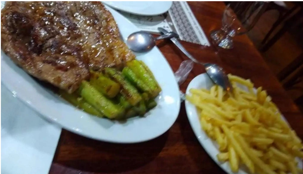
El borrego restaurante comida reconfortante