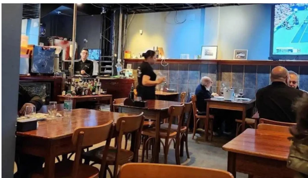
El borrego restaurante ambiente