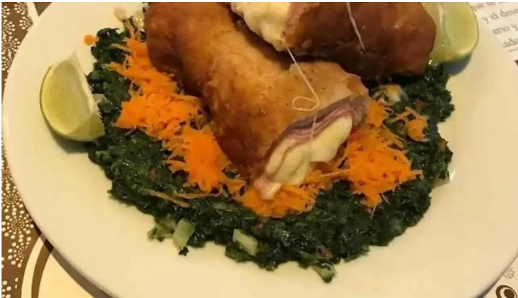
El borrego restaurante comida y bebida