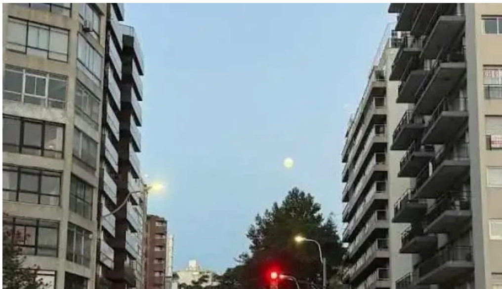
Costa azul mas recientes