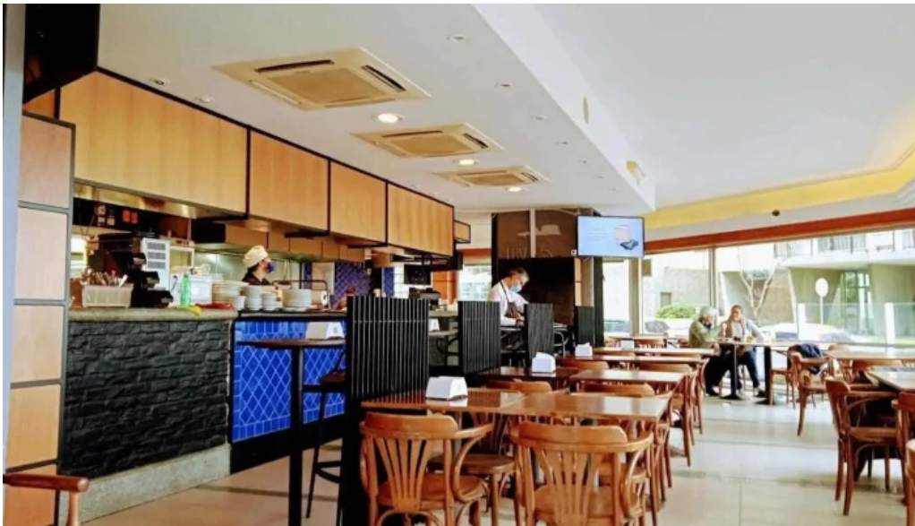
Costa azul montevideo