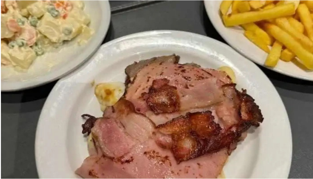
Costa azul papas fritas