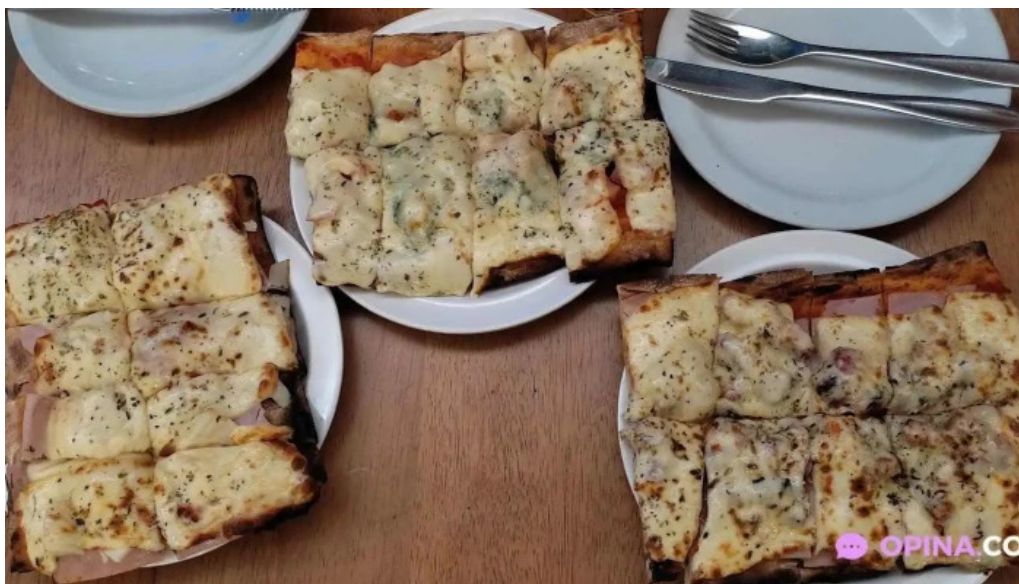
Costa azul comida reconfortante