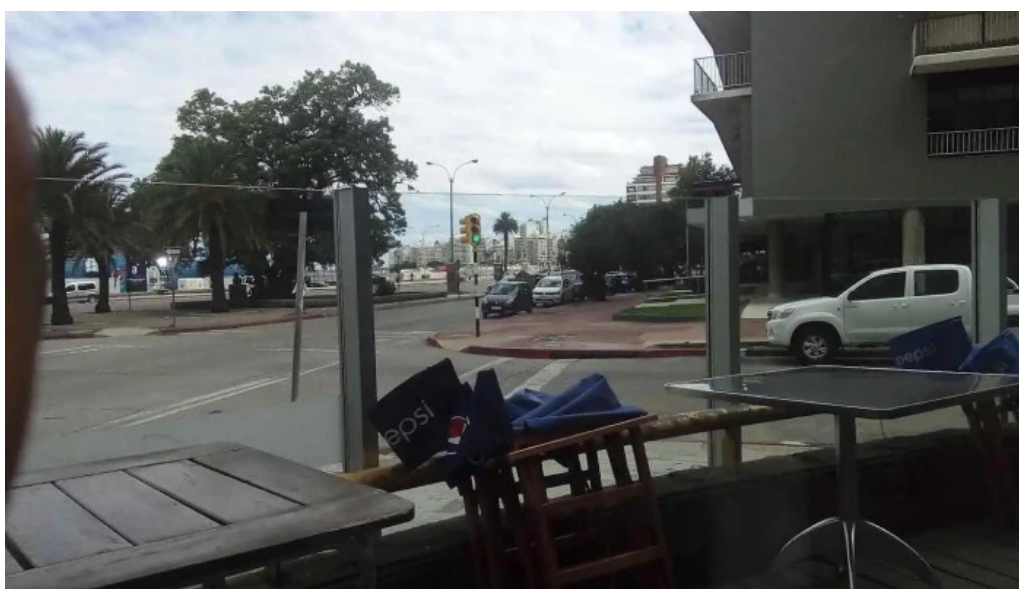
Costa azul ambiente