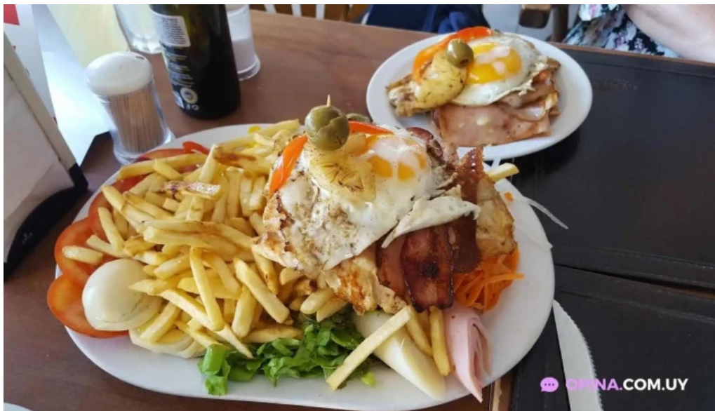
Costa azul comida y bebida