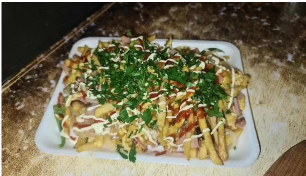
Carrito mi sueño comida reconfortante