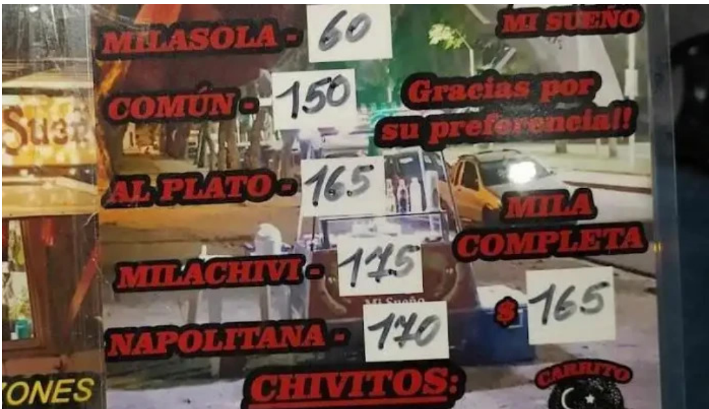
Carrito mi sueno menu