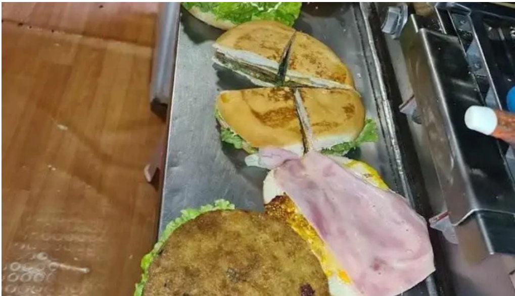
Carrito mi sueno todas