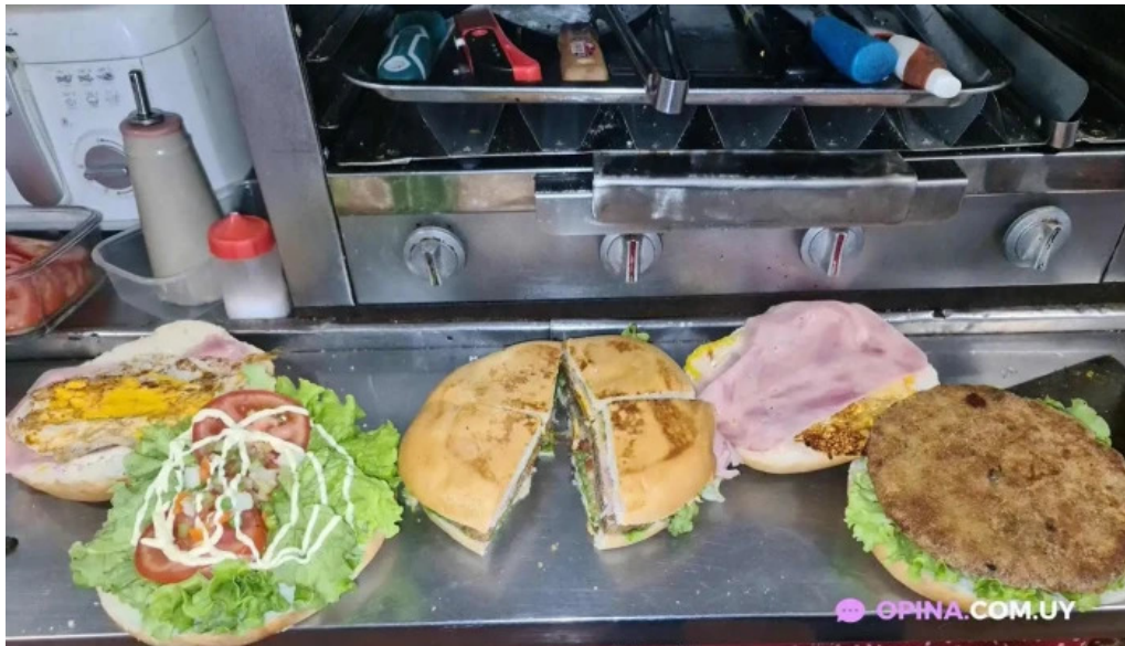
Carrito mi sueño comida y bebida