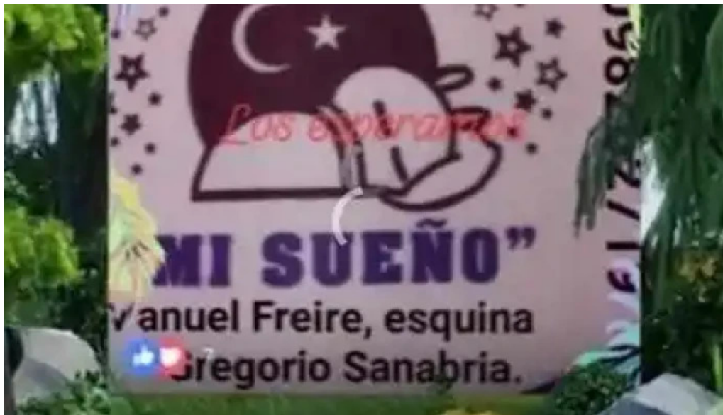
Carrito mi sueño del propietario