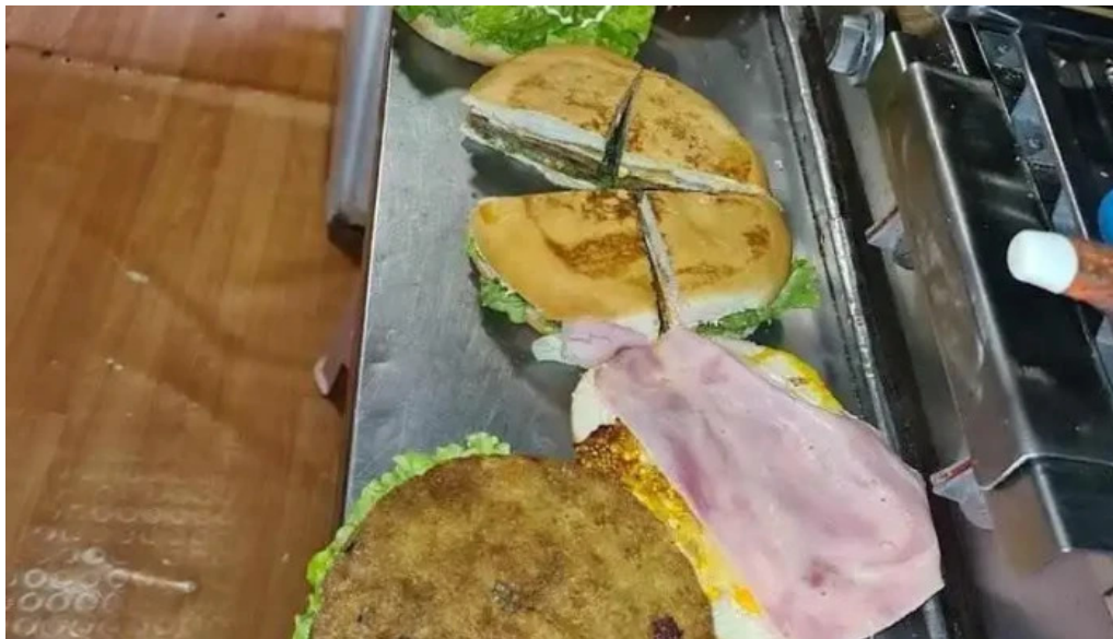
Carrito mi sueno treinta y tres