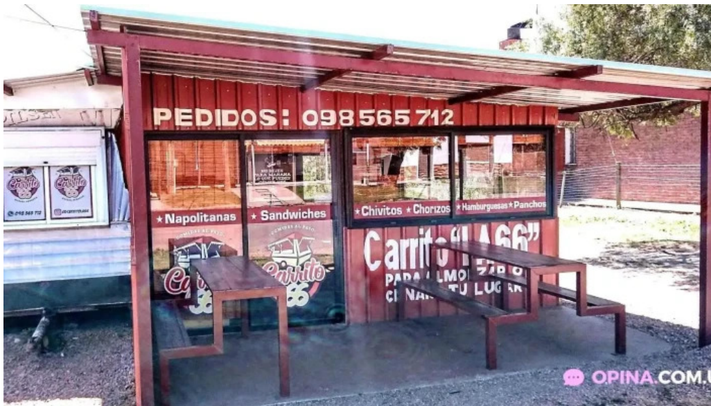
Carrito al paso la 66 rafael perazza