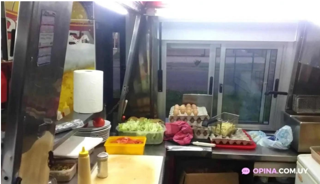
Carrito al paso la 66 videos