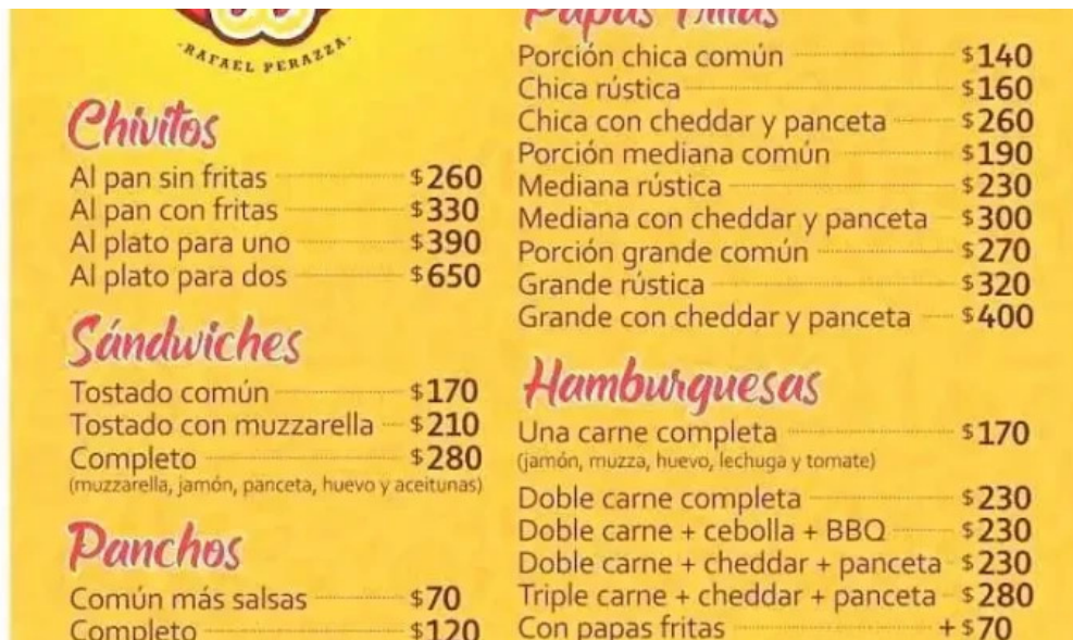
Carrito al paso la 66 menu