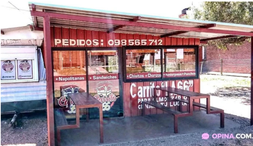
Carrito al paso la 66 todas