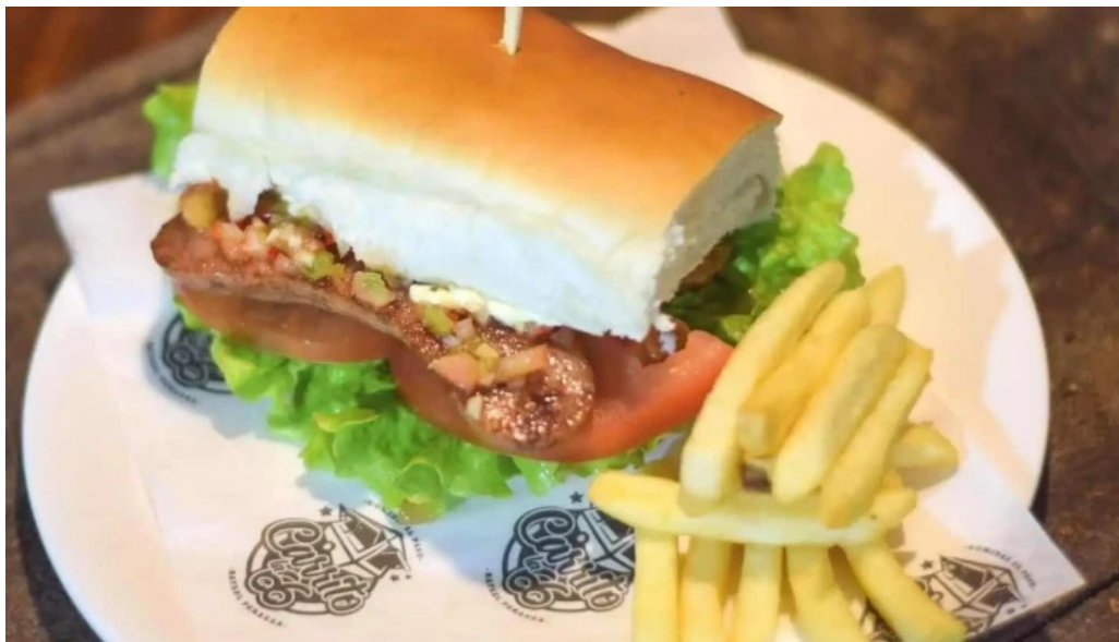
Carrito al paso la 66 papas fritas