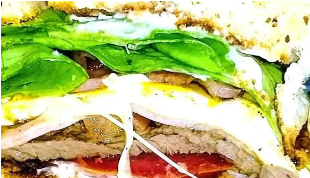
Carrito al paso la 66 sandwich