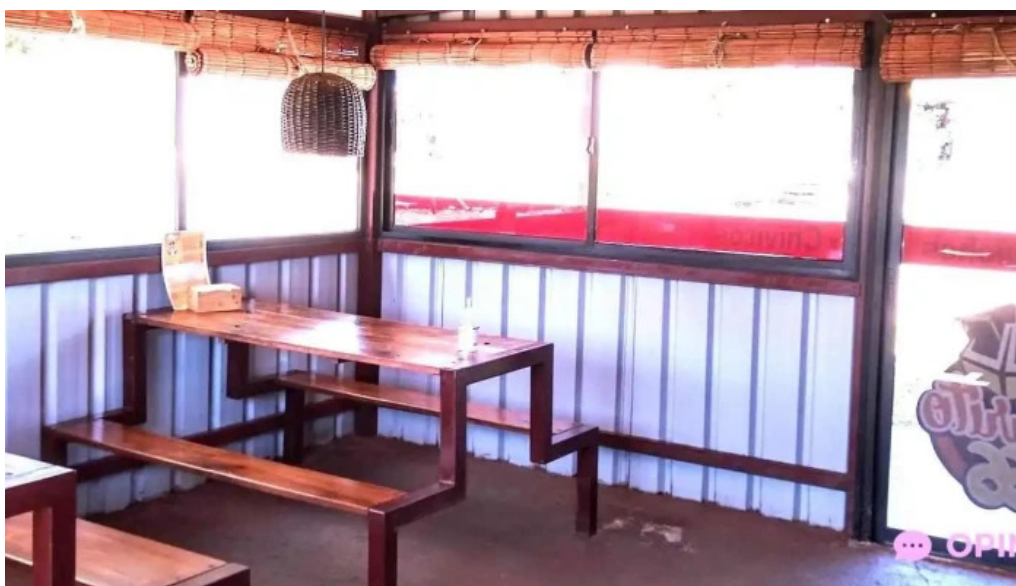
Carrito al paso la 66 ambiente