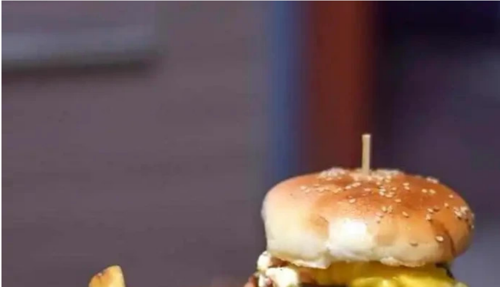
Carrito al paso la 66 hamburguesa