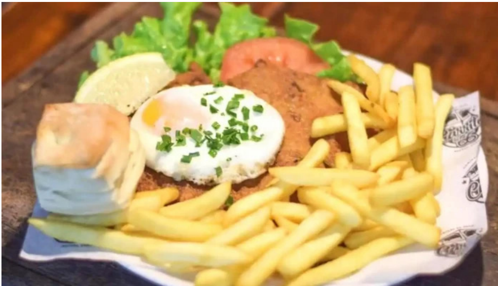
Carrito al paso la 66 comida reconfortante