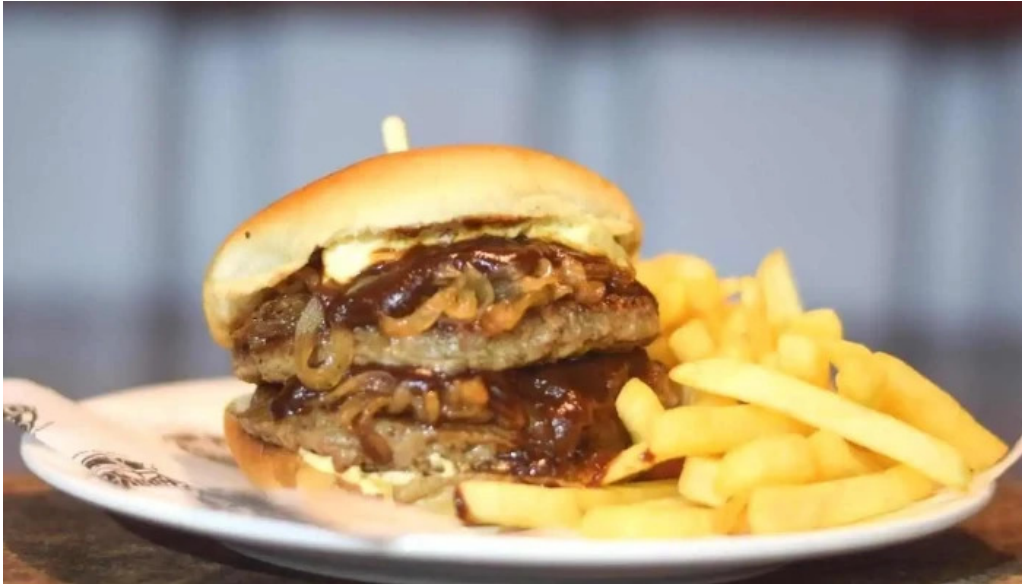
Carrito al paso la 66 comida y bebida