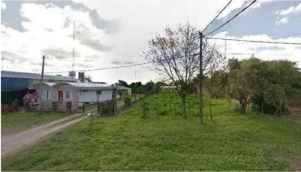
Carrito al paso la 66 street view y 360