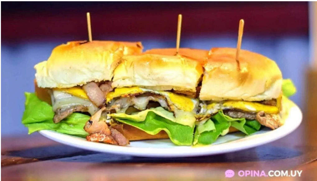
Carrito al paso la 66 del propietario