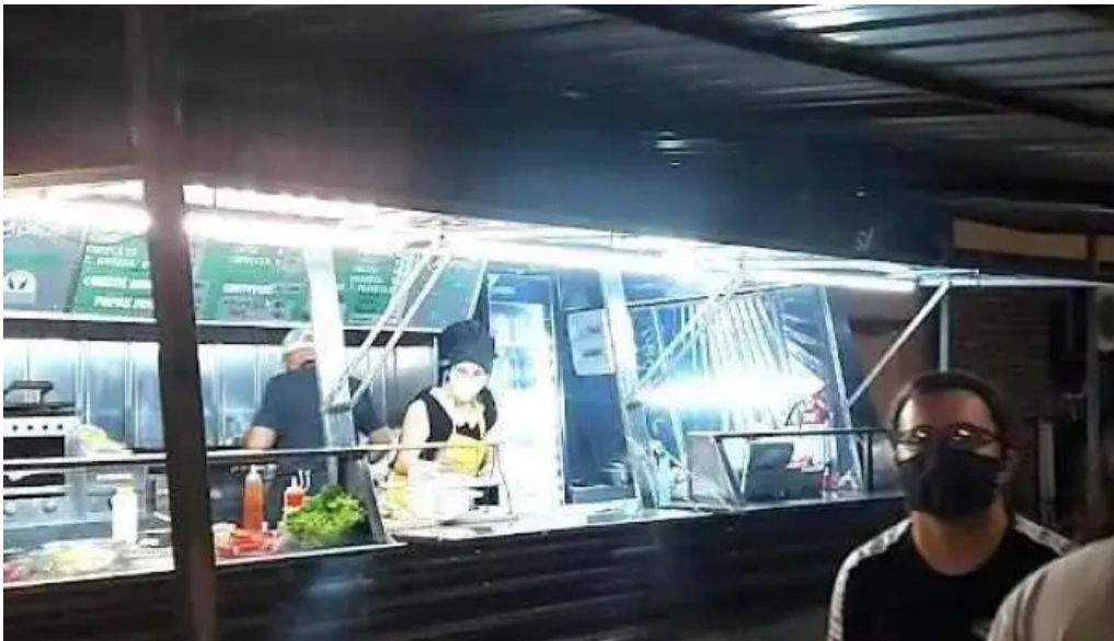
Carribar lo de ana todas