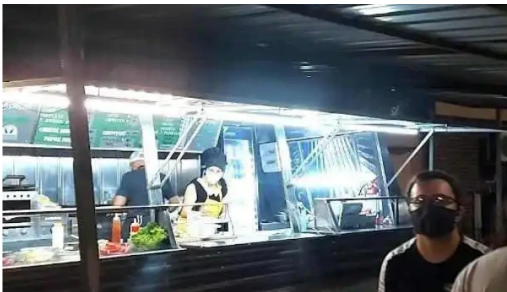
Carribar lo de ana durazno