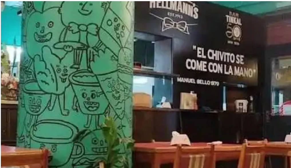
Bar tinkal montevideo