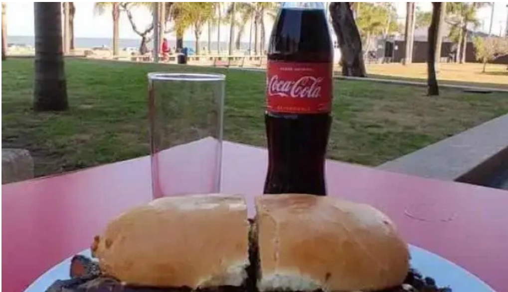
Bar tinkal comida reconfortante