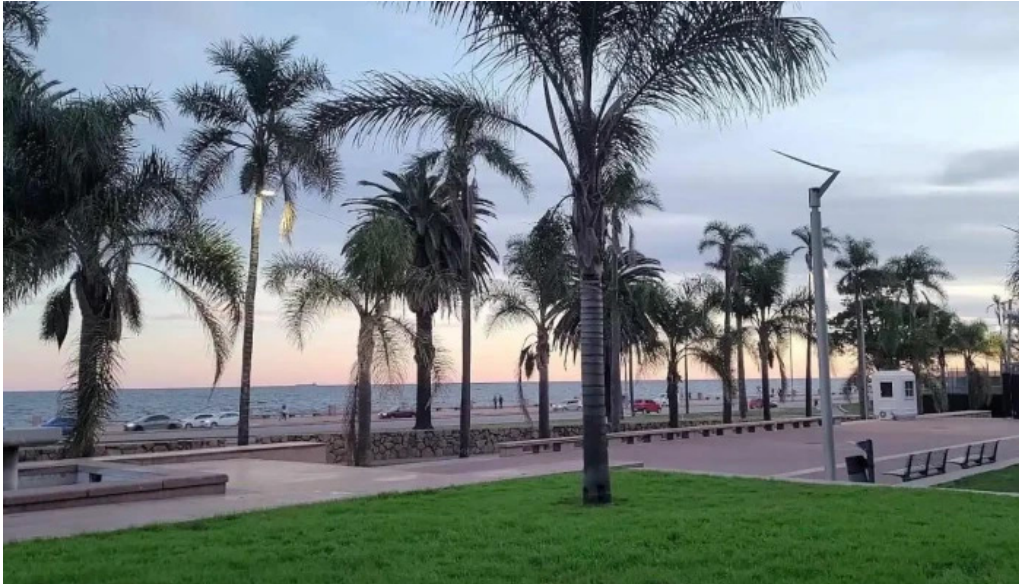
Bar tinkal videos