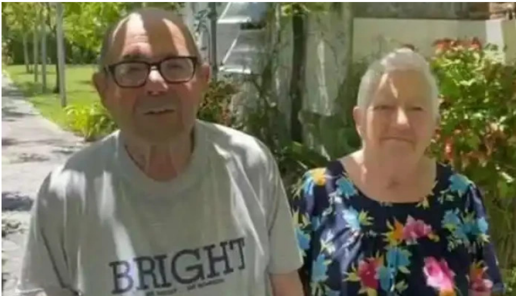
Bar tinkal del propietario