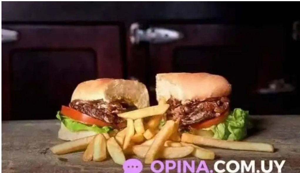
Bar tinkal hamburguesa