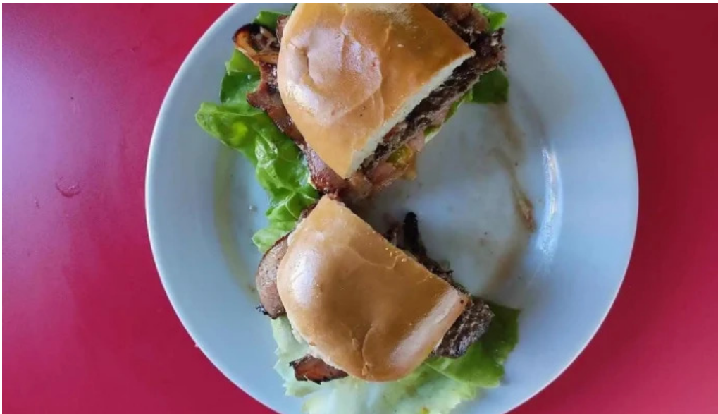
Bar tinkal sandwich de pollo