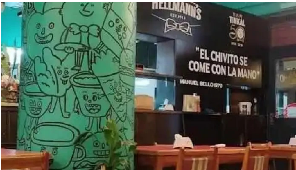
Bar tinkal todas