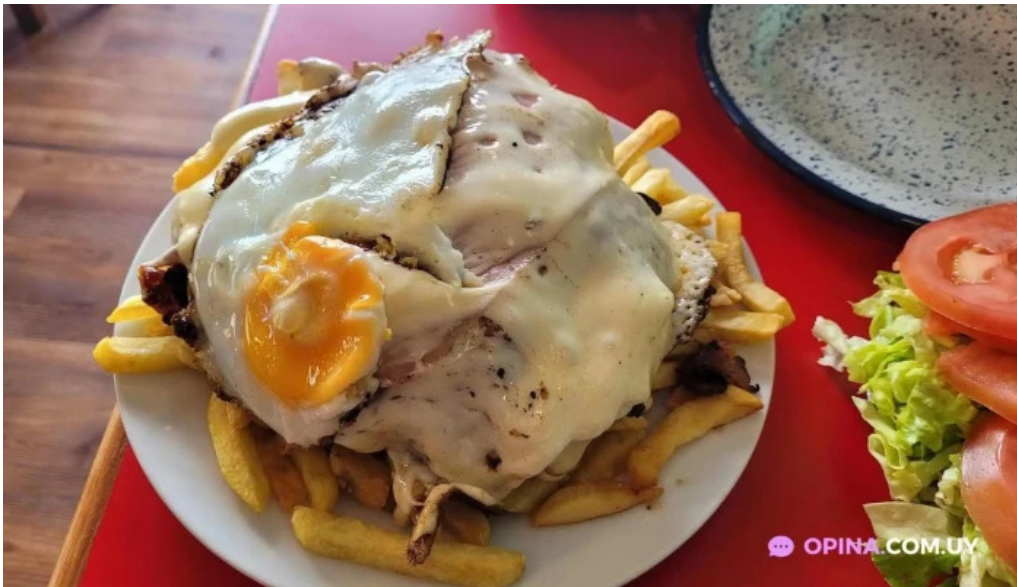
Bar tinkal milanese