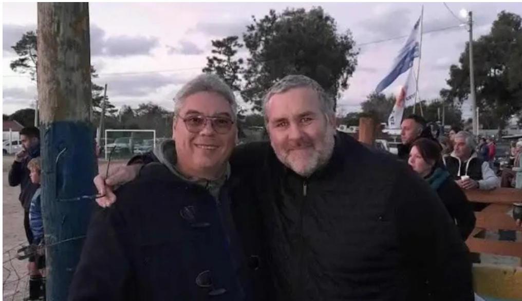
Bar tinkal mas recientes