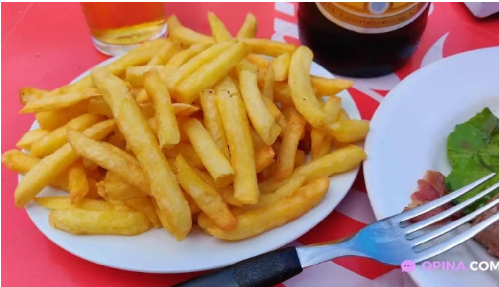
Bar tinkal papas fritas