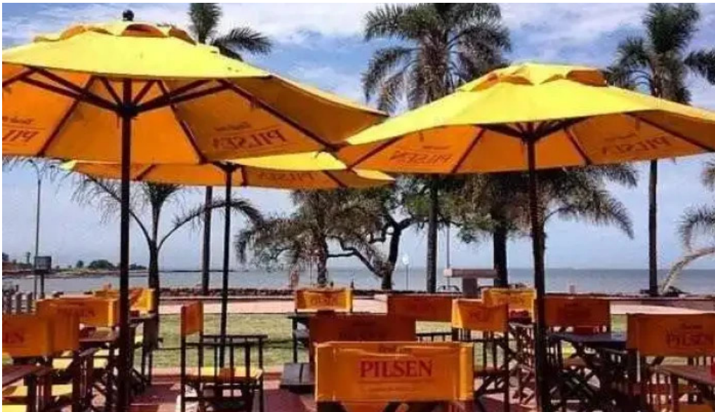
Bar tinkal ambiente