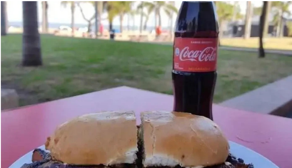
Bar tinkal comida y bebida