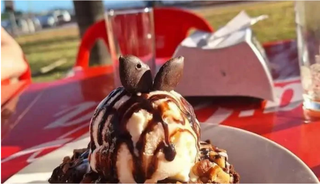
Bar tinkal brownie