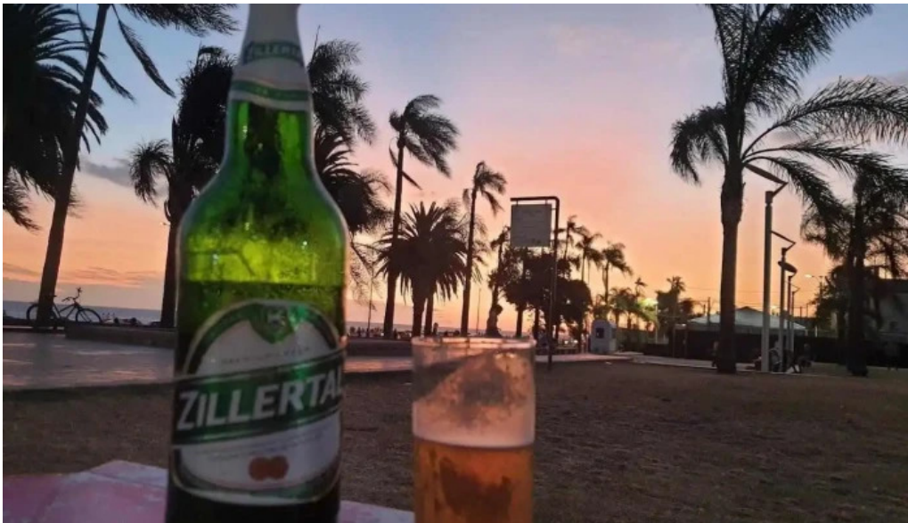
Bar tinkal cerveza