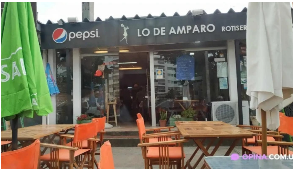
Lo de amparo atlantida