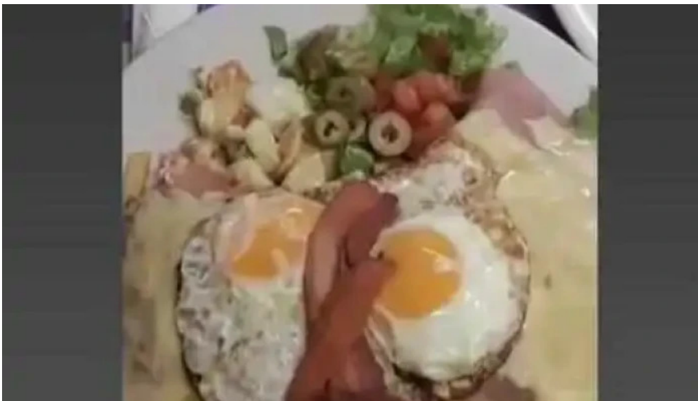
Lo de amparo videos