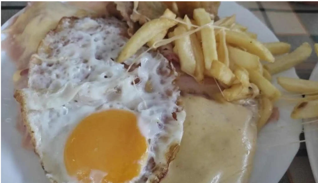
Lo de amparo papas fritas