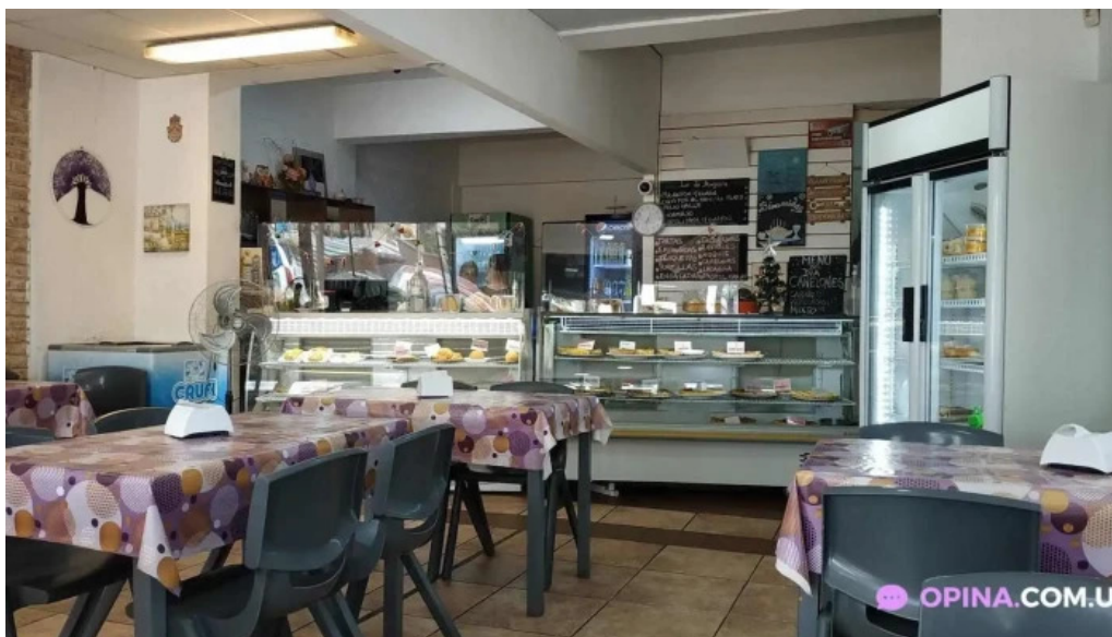
Lo de amparo ambiente