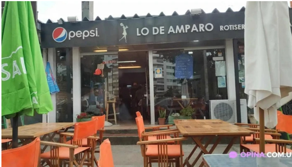
Lo de amparo todas