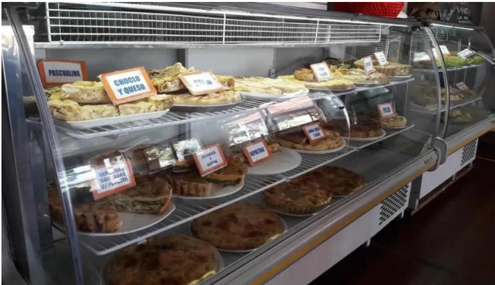
Lo de amparo comida reconfortante