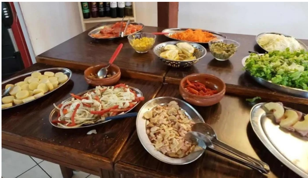
Lo de amparo comida y bebida