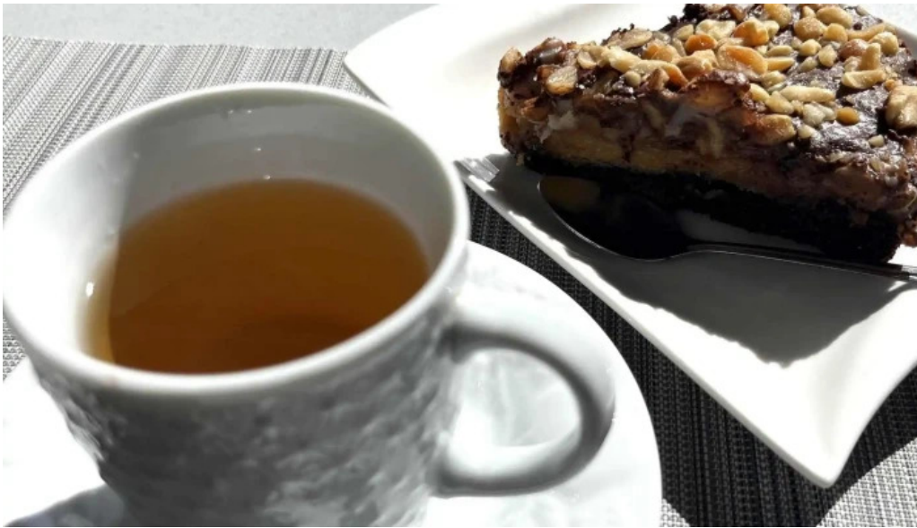
Lo de juan comentario 2