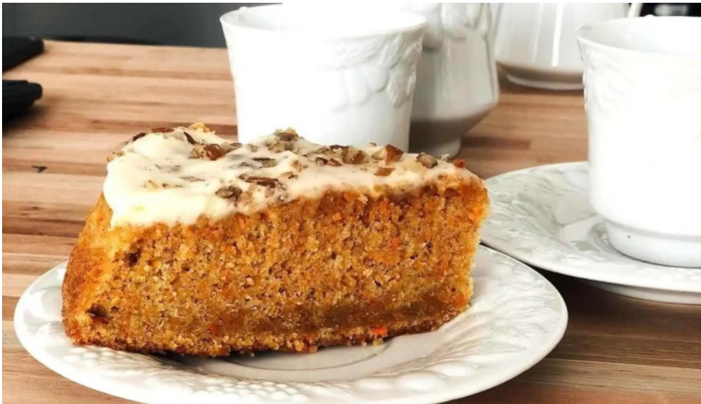
Lo de juan del propietario