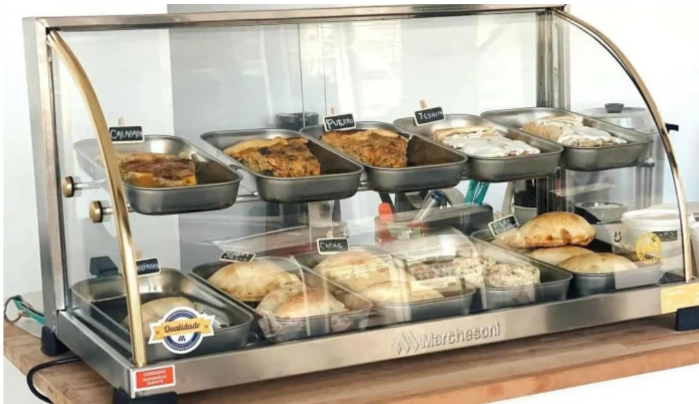
Lo de juan todo