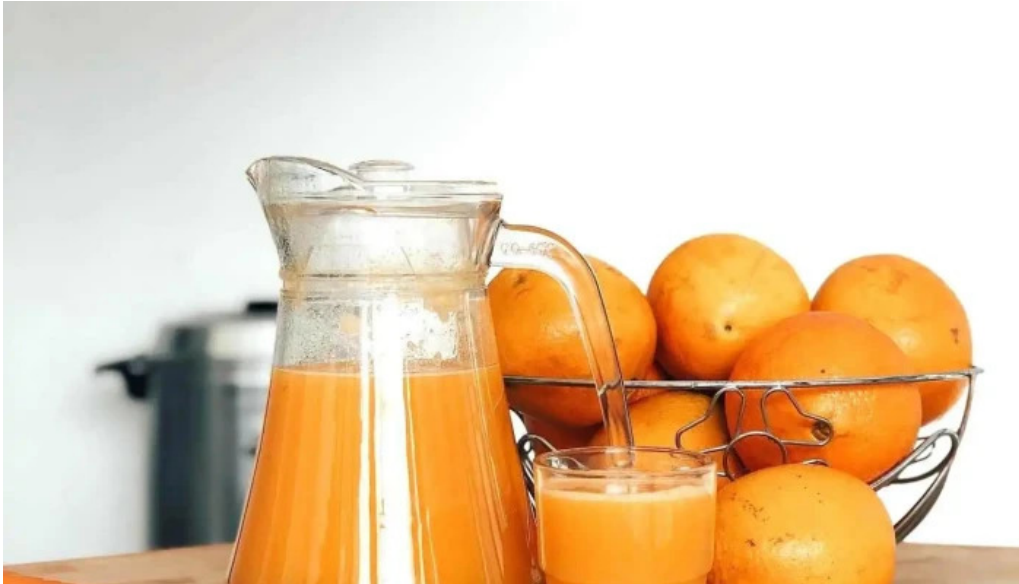
Lo de juan comidas y bebidas