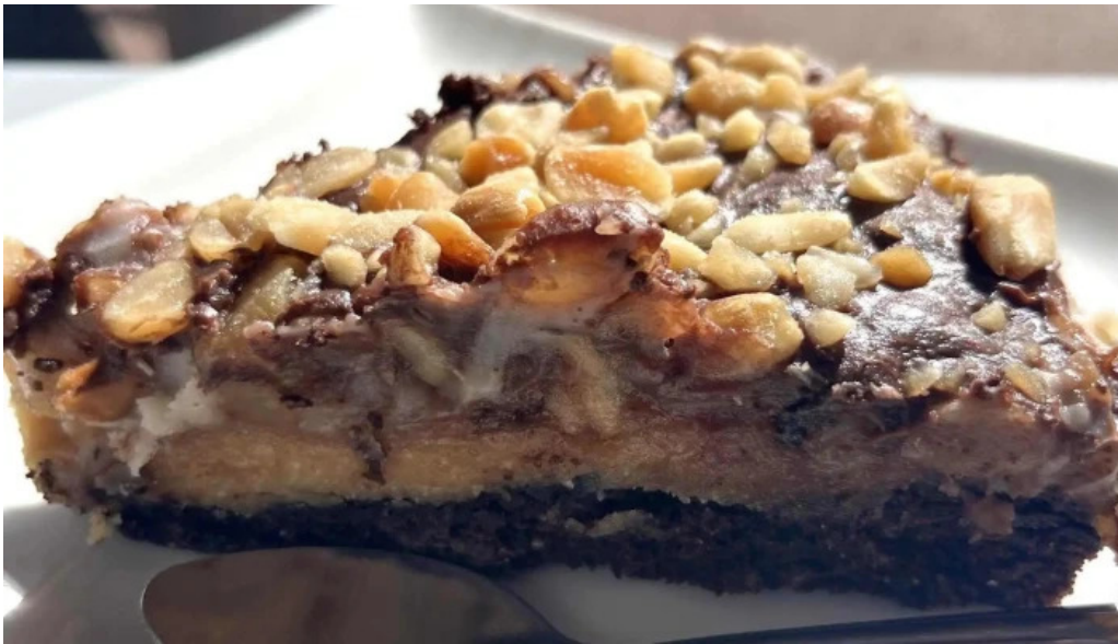
Lo de juan comentario 7