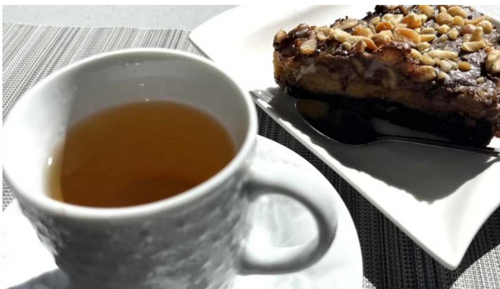
Lo de juan comentario 10