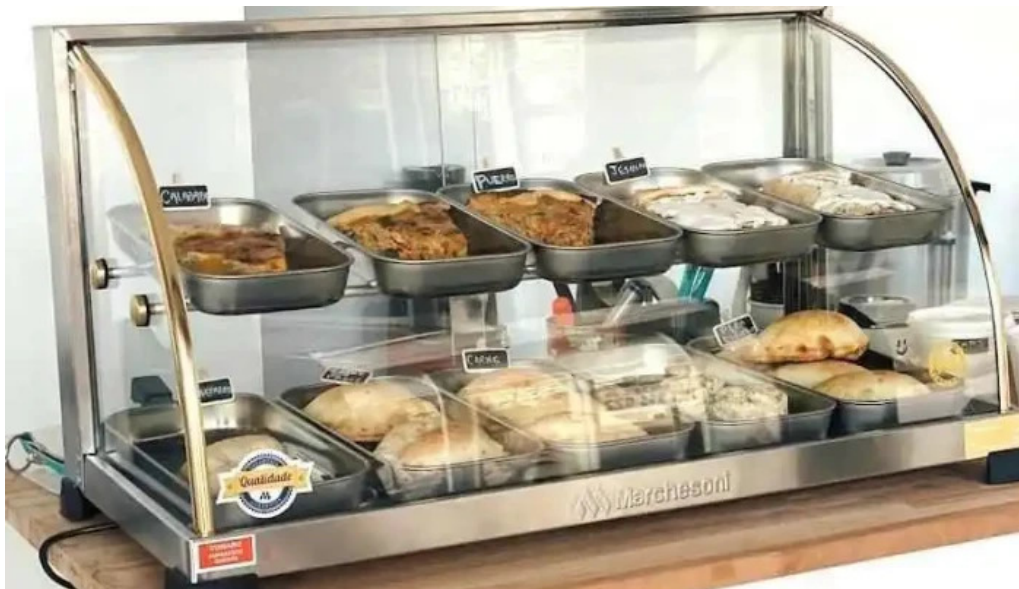
Lo de juan montevideo