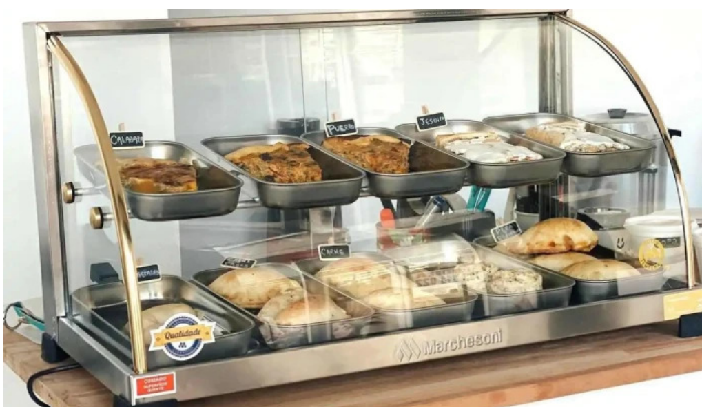
Lo de juan ambiente