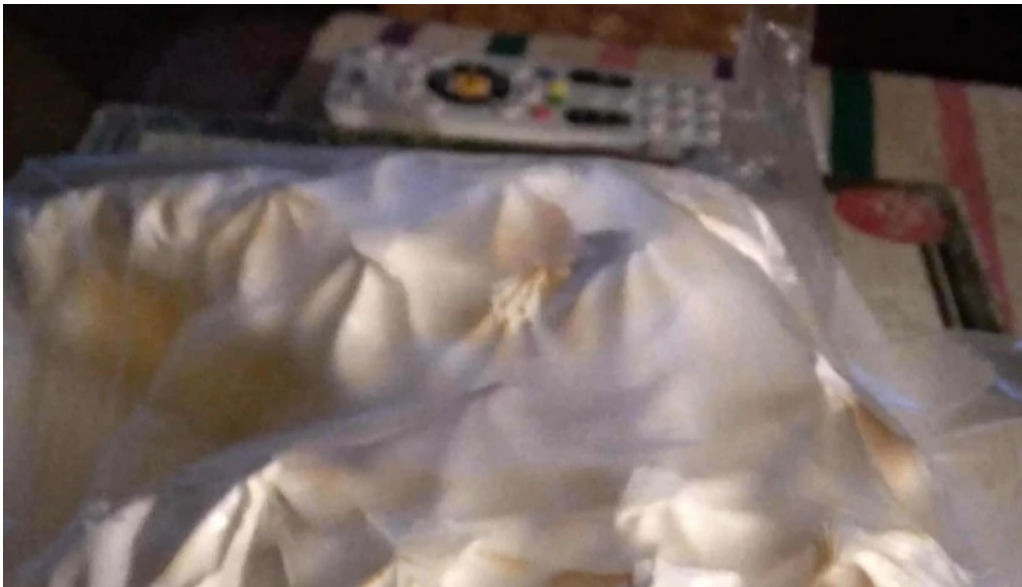
Caprichos confiteria rotiseria comentario 5