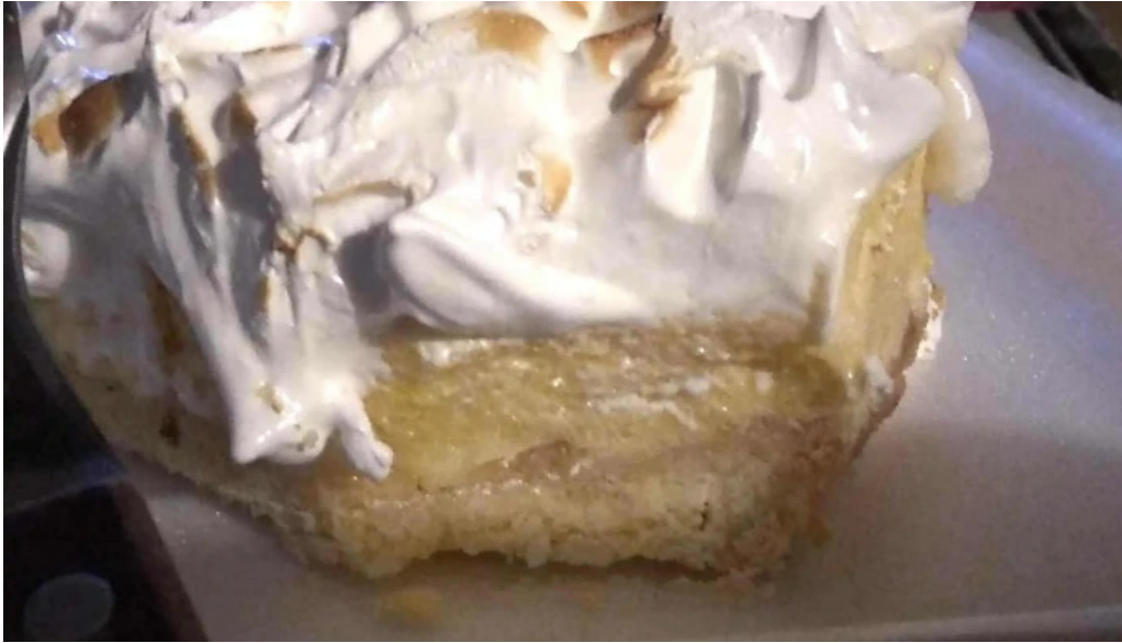
Caprichos confiteria rotiseria comentario 6