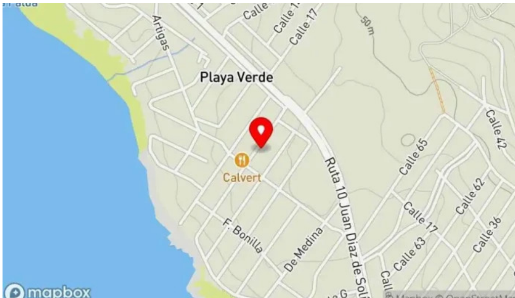
Caprichos confiteria rotiseria mapa