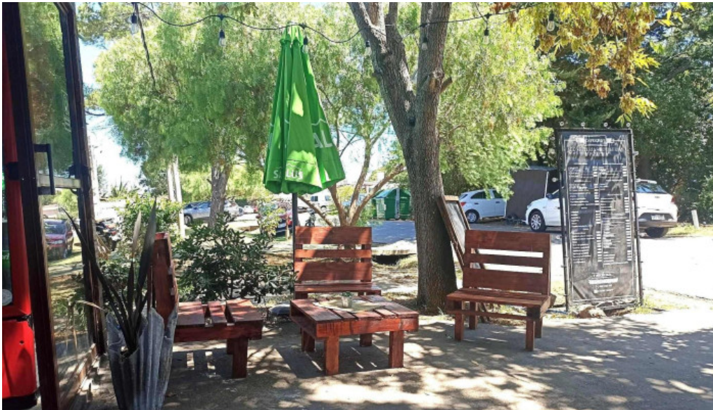
Caprichos confiteria rotiseria todo