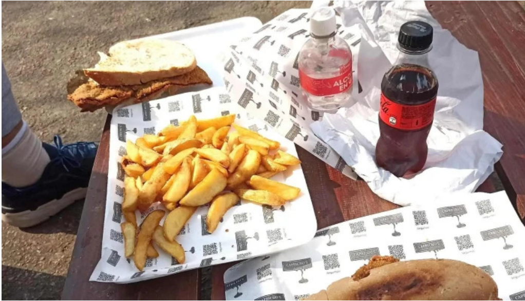
Caprichos confiteria rotiseria comidas y bebidas