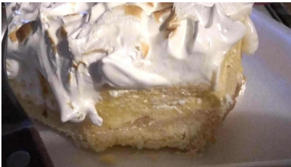
Caprichos confiteria rotiseria comentario 10