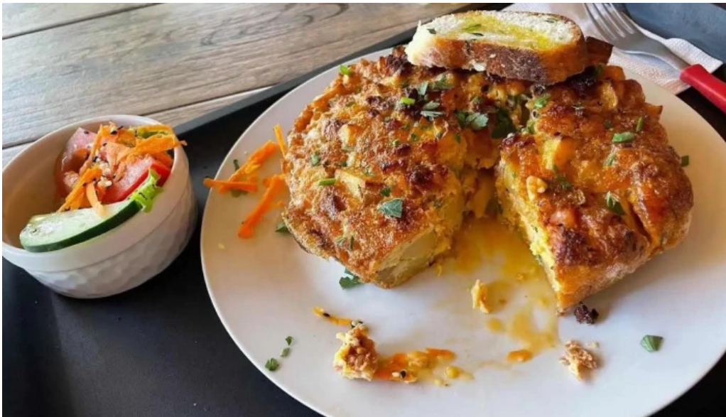
Plaza de chueca montevideo