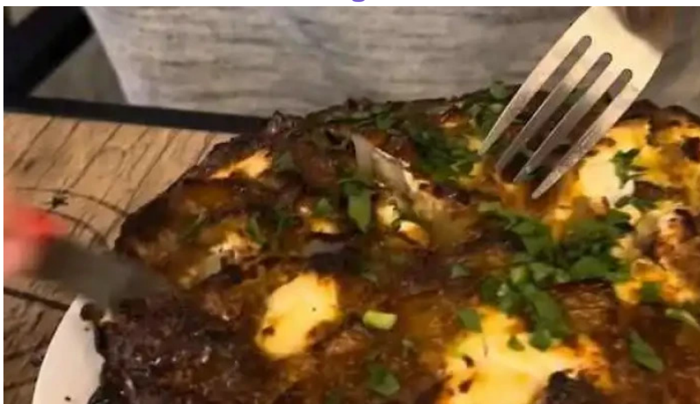
Plaza de chueca videos