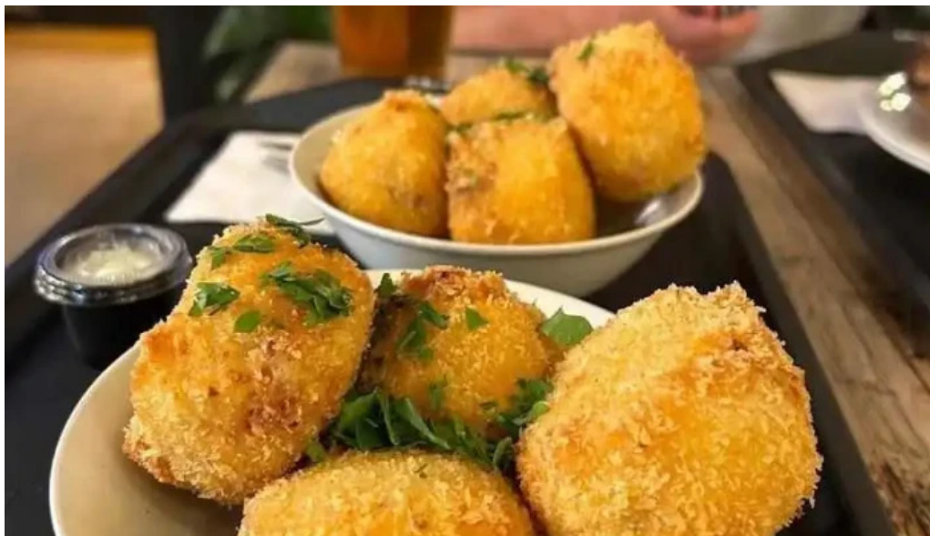
Plaza de chueca comida y bebida