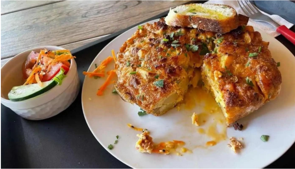
Plaza de chueca todas