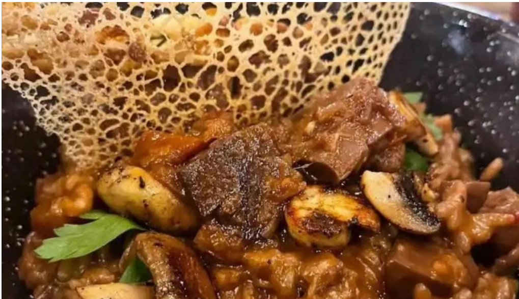
Lombardia comida y bebida