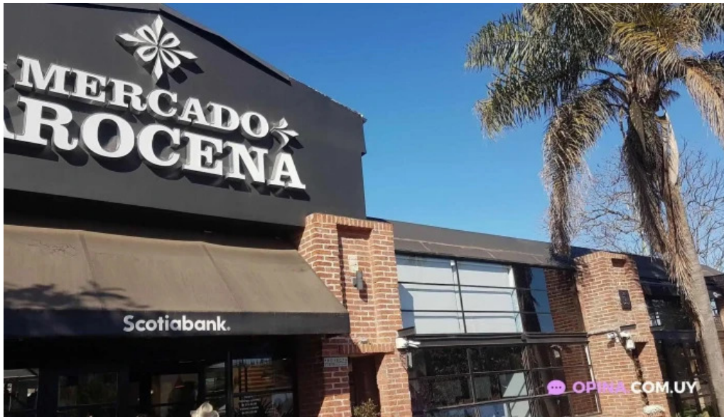
Miss shawarma todas