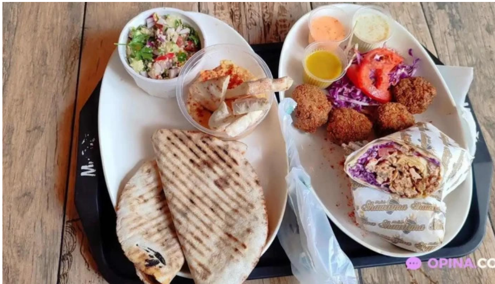
Miss shawarma comida y bebida