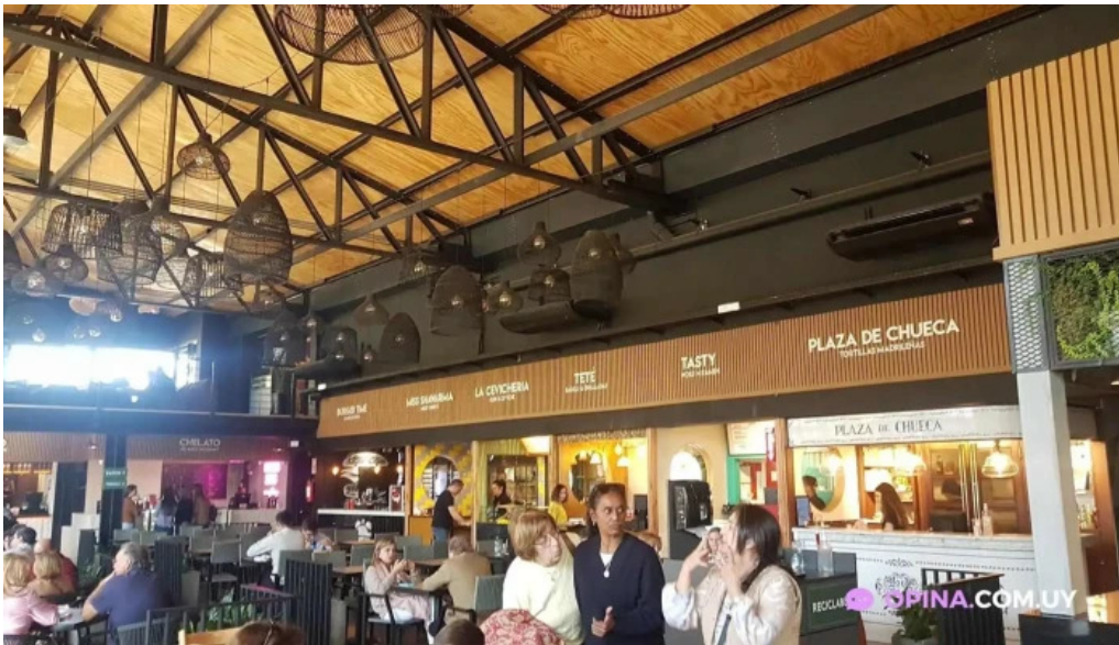
Miss shawarma mercado arocena