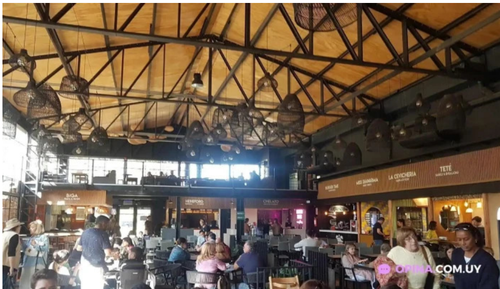
Miss shawarma ambiente