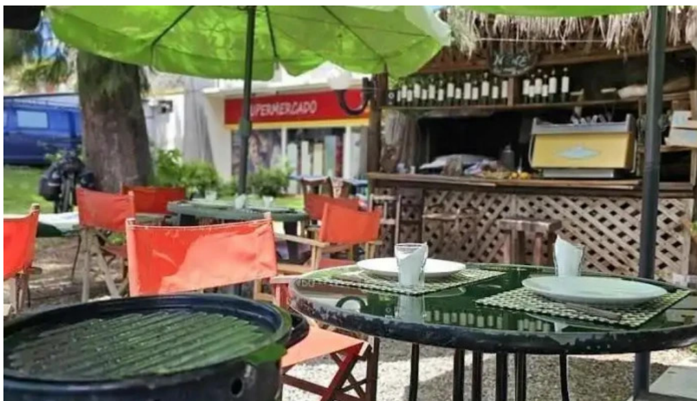
Lo de pedro col del sacramento