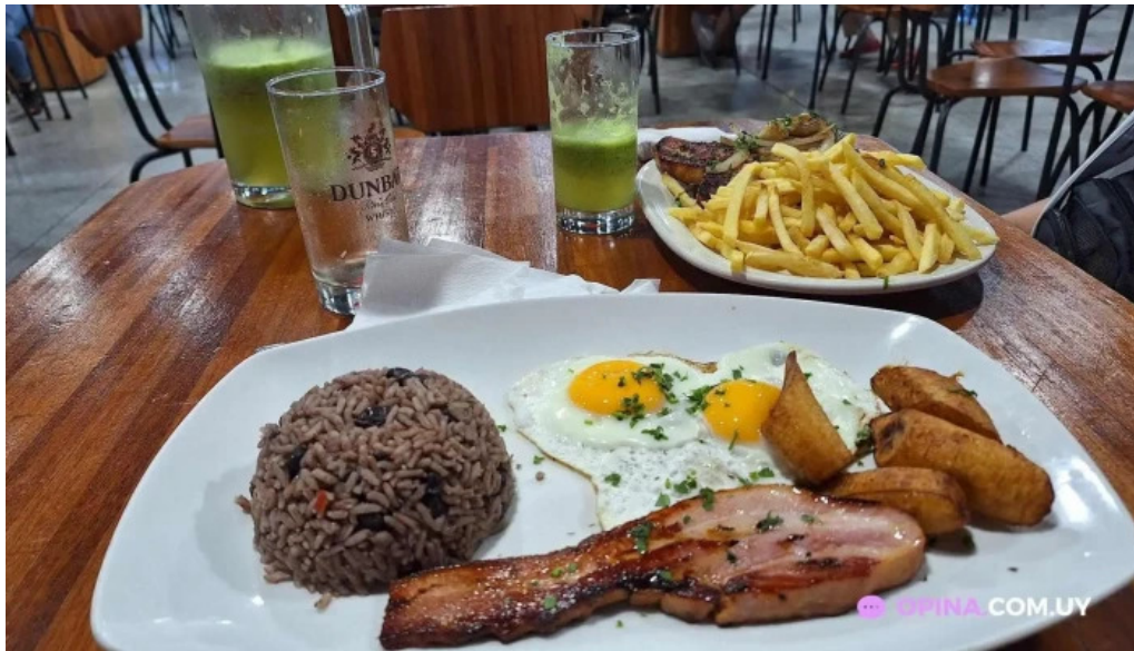
Chekere de cuba comida y bebida