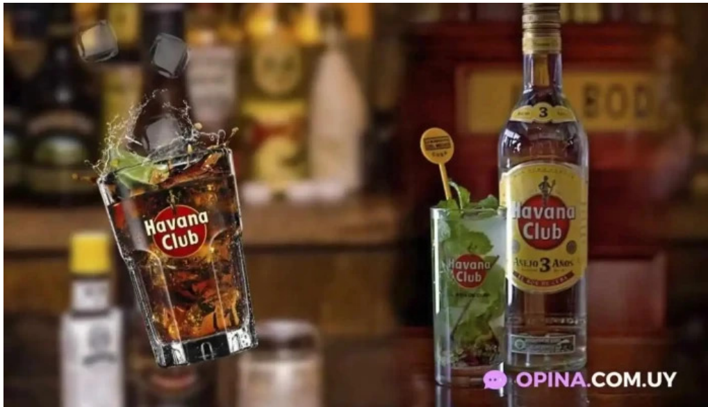
Chekere de cuba ron