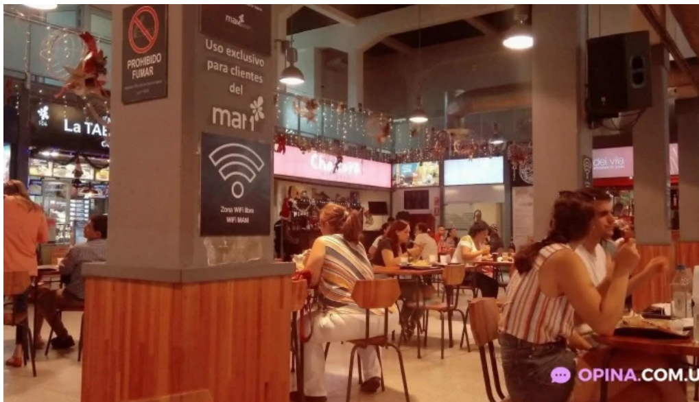
Chekere de cuba ambiente