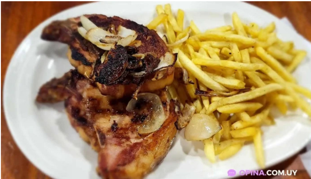
Chekere de cuba mas recientes