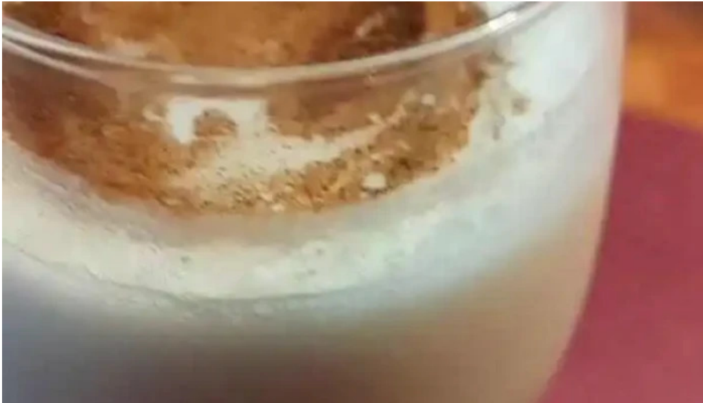
Chekere de cuba videos