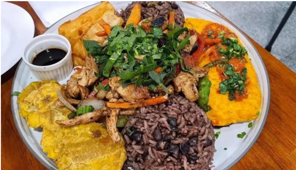
Chekere de cuba patacon