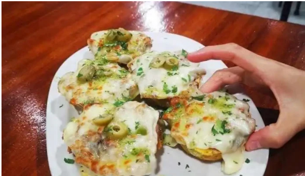
Chekere de cuba potato skins