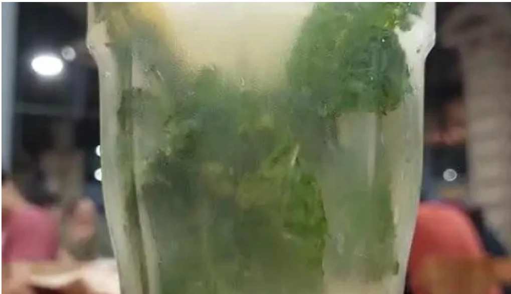
Chekere de cuba mojito