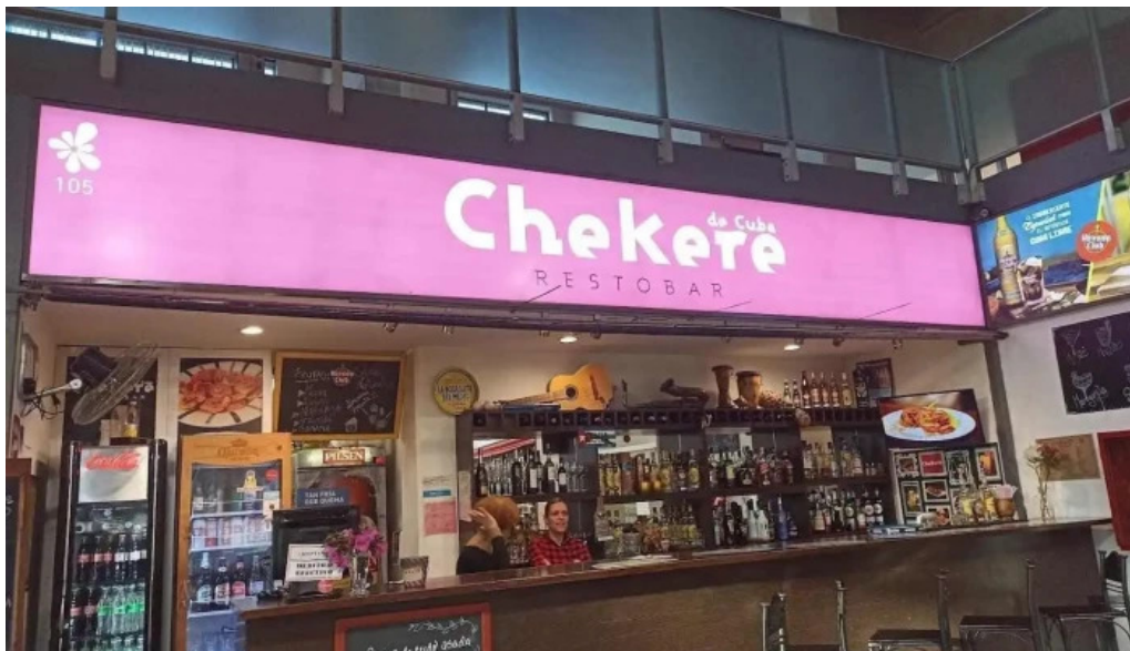
Chekere de cuba todas