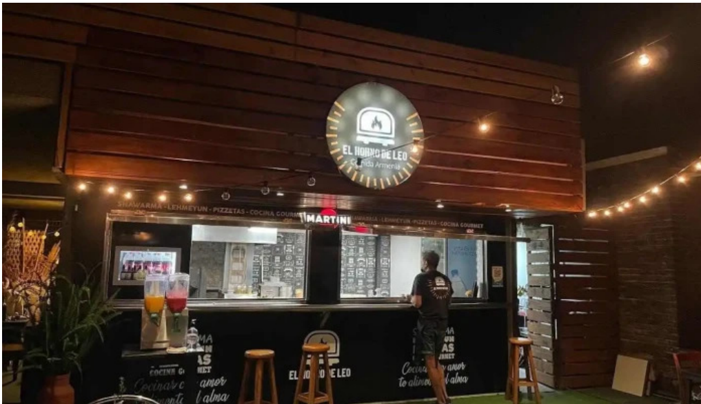
El horno de leo todas