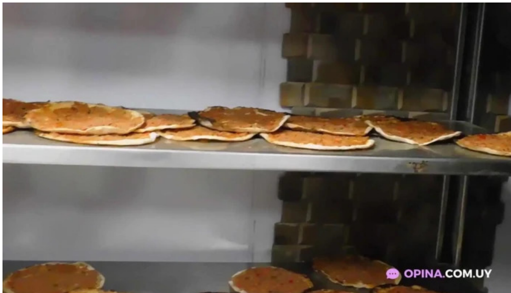
El horno de leo videos