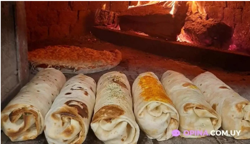
El horno de leo comida y bebida