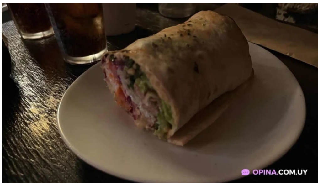
El horno de leo burrito