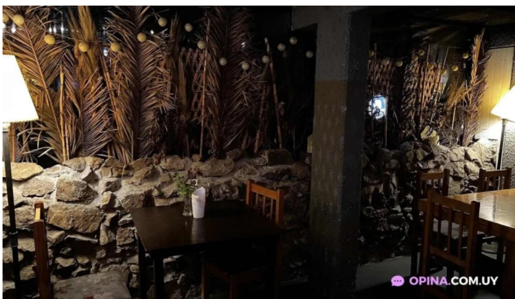
El horno de leo ambiente