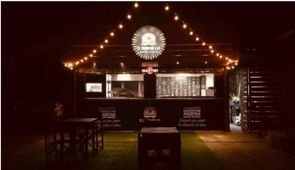
El horno de leo del propietario