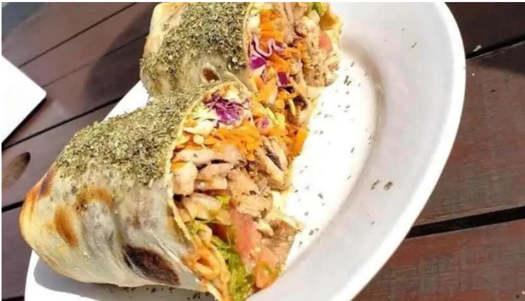
Armenian food truck comida y bebida