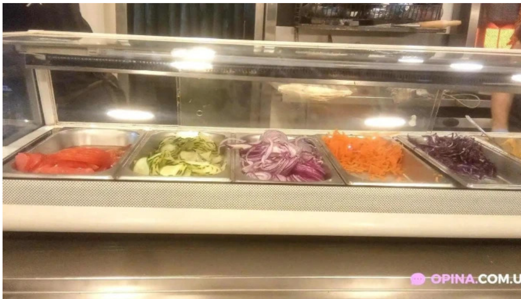
Armenian food truck ambiente