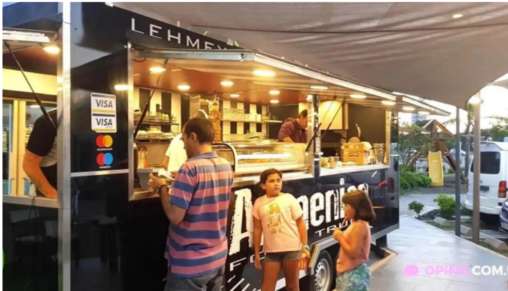
Armenian food truck ciudad de la costa