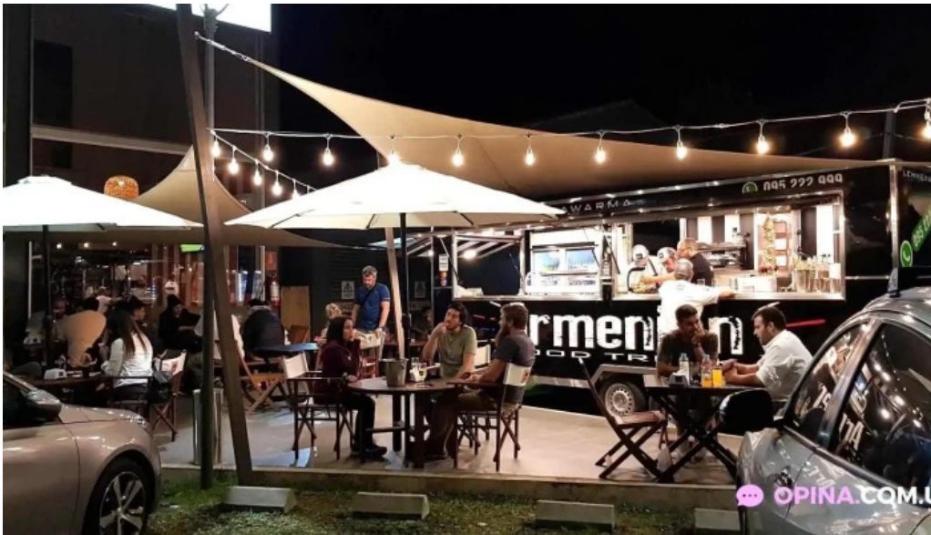
Armenian food truck del propietario