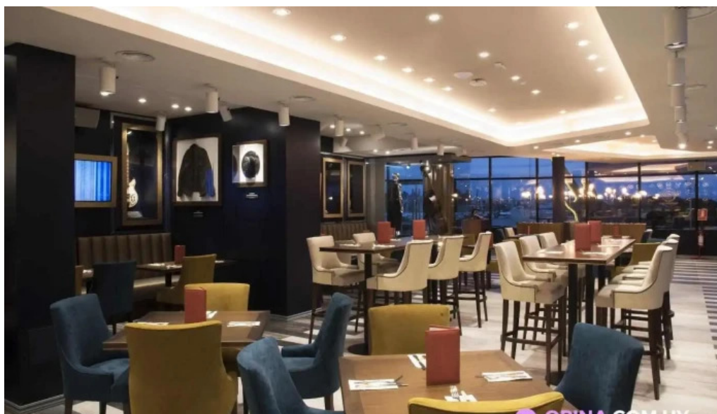
Hard rock cafe montevideo todas