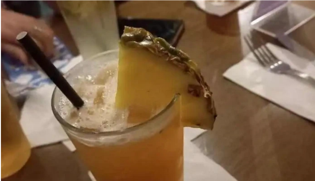
Hard rock cafe montevideo mas recientes