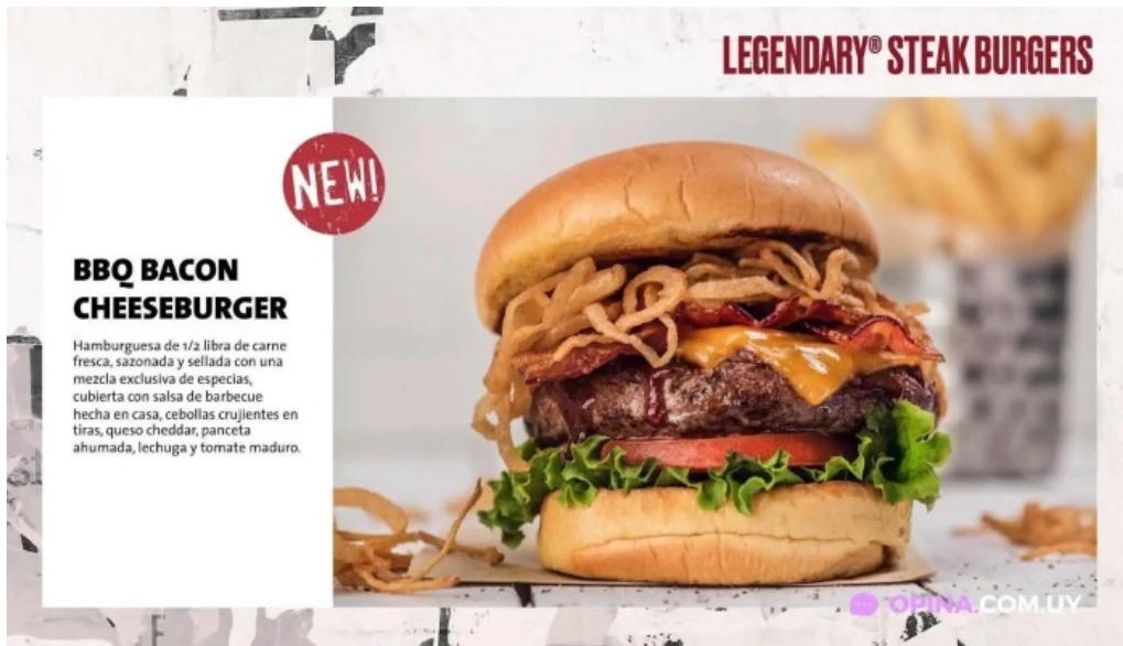
Hard rock cafe montevideo menu