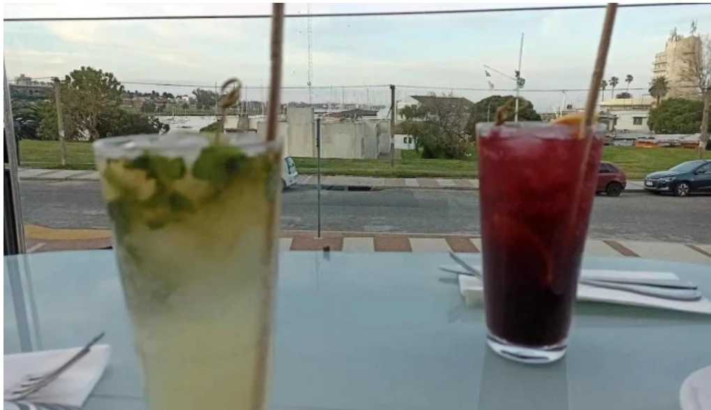
Hard rock cafe montevideo mojito