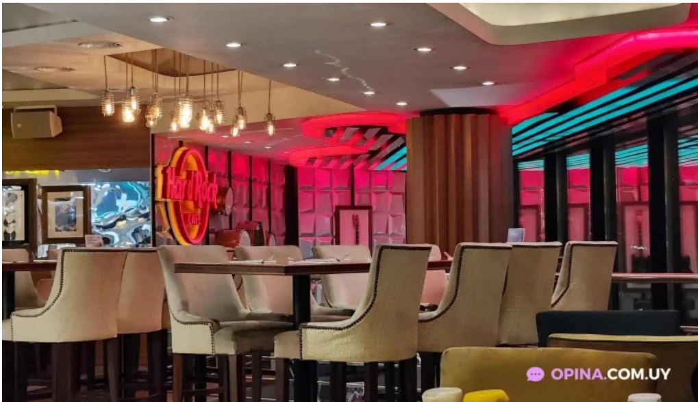
Hard rock cafe montevideo ambiente