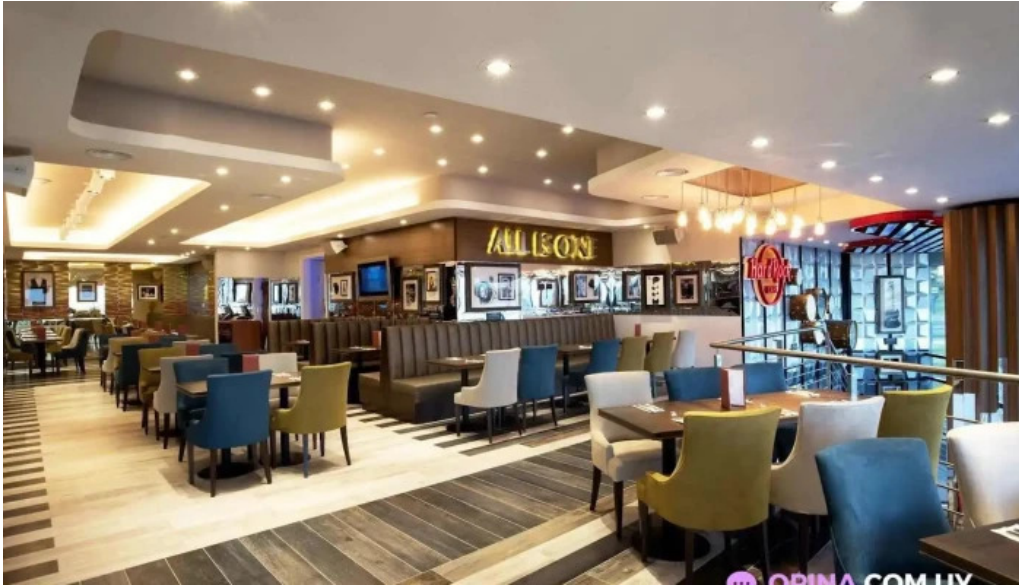
Hard rock cafe montevideo del propietario