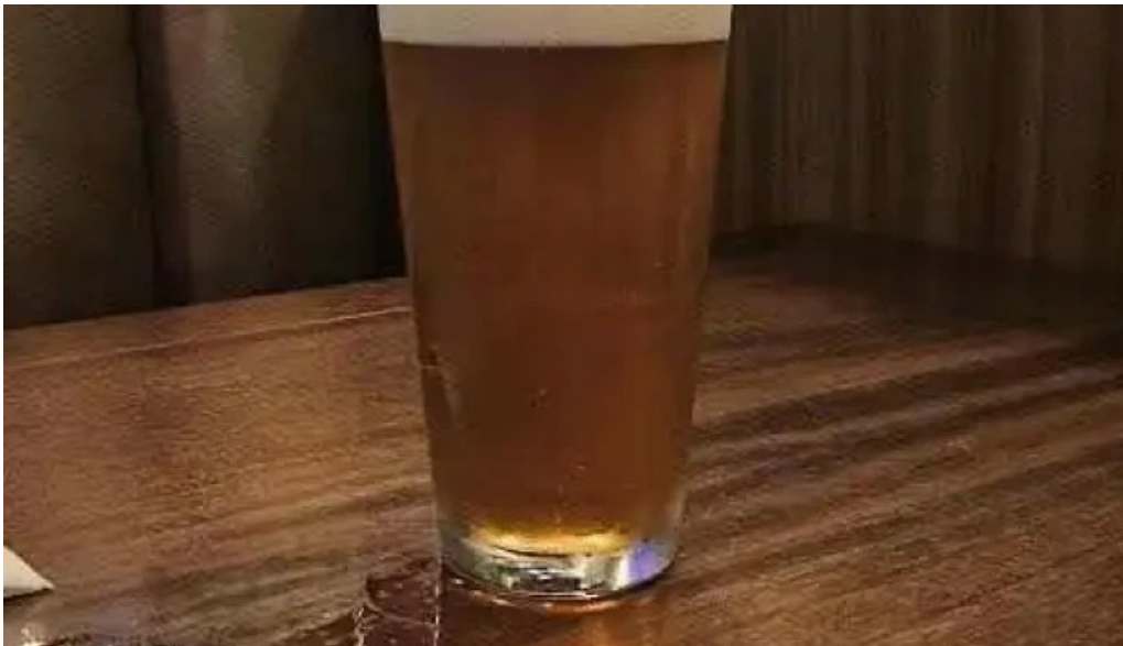
Hard rock cafe montevideo cerveza