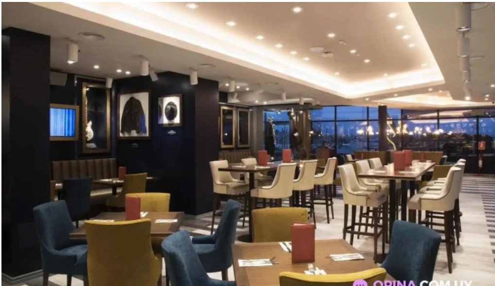
Hard rock cafe montevideo montevideo