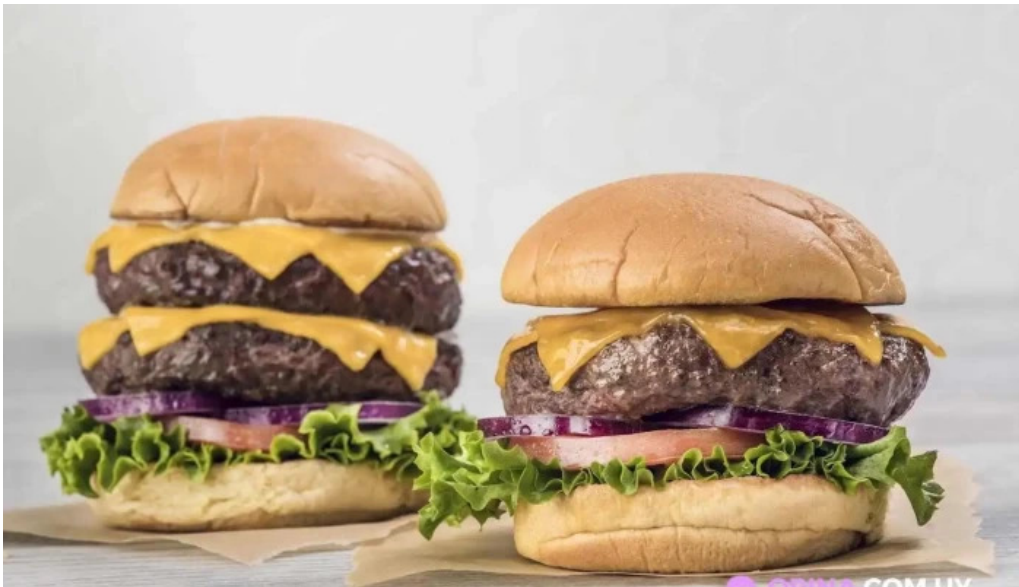
Hard rock cafe montevideo comida y bebida