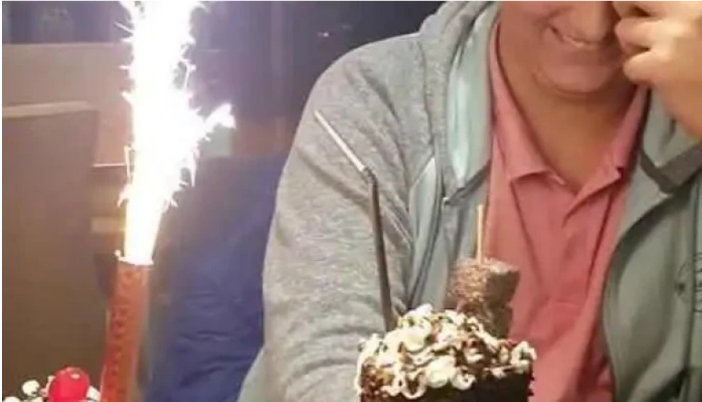
Hard rock cafe montevideo batido