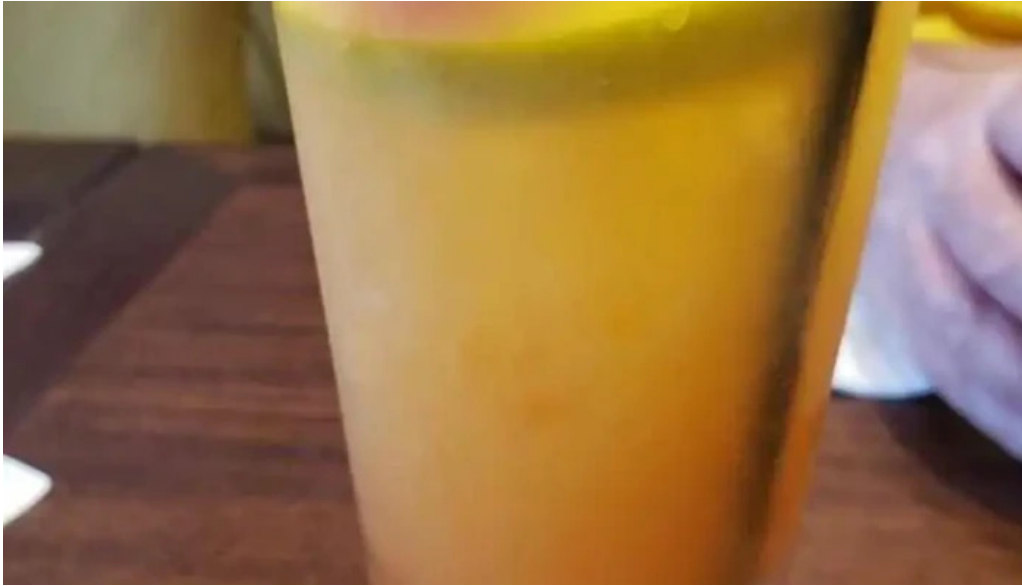
Hard rock cafe montevideo mai tai