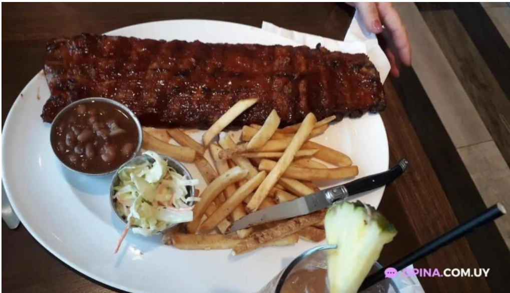
Hard rock cafe montevideo costillas