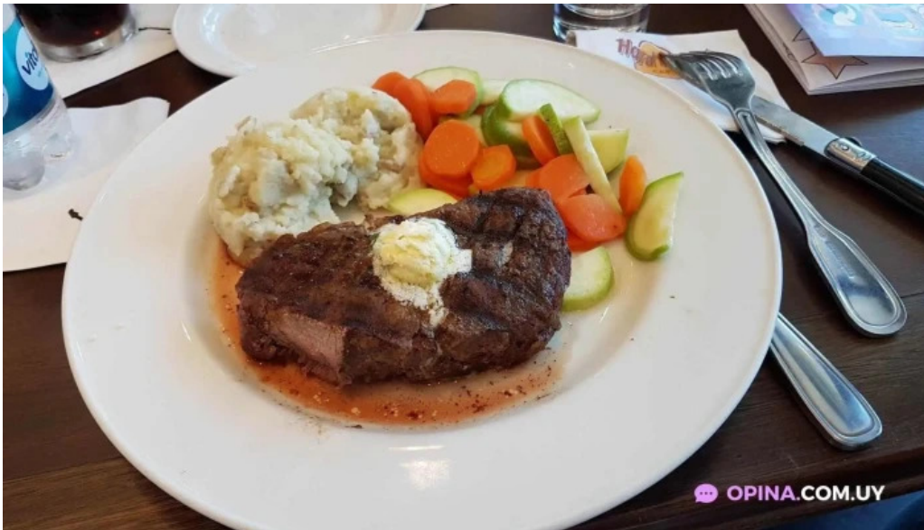
Hard rock cafe montevideo filete