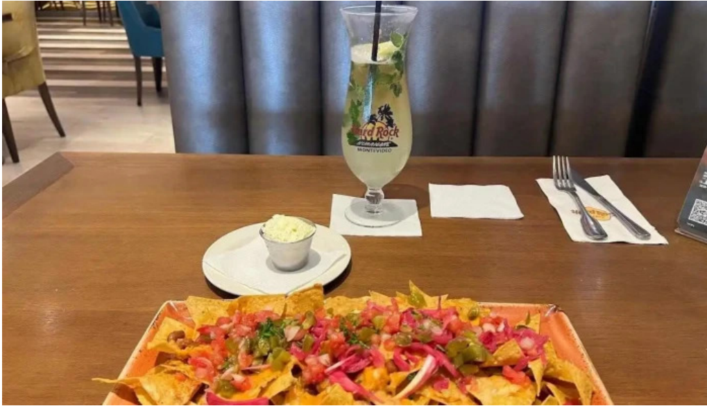
Hard rock cafe montevideo nachos