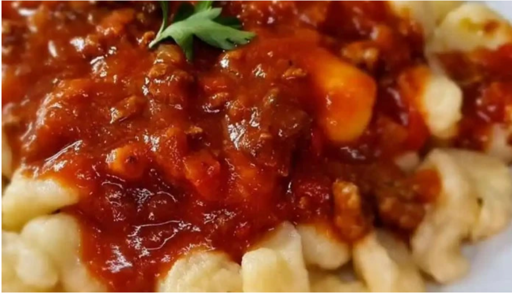
Capitan jack comida y bebida