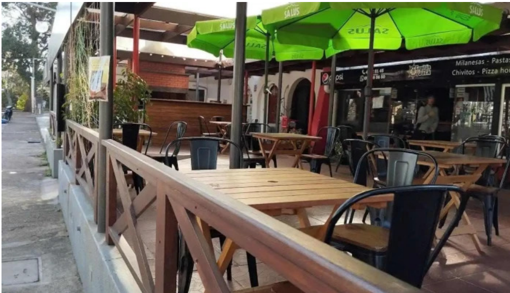
Capitan jack todas