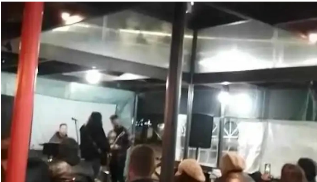
Capitan jack videos