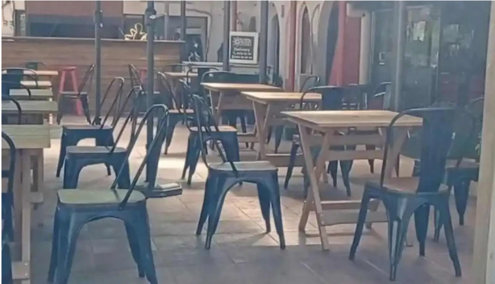
Capitan jack ambiente