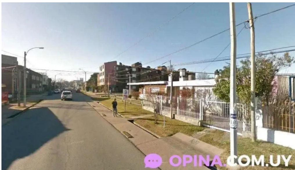
Don bruno las piedras