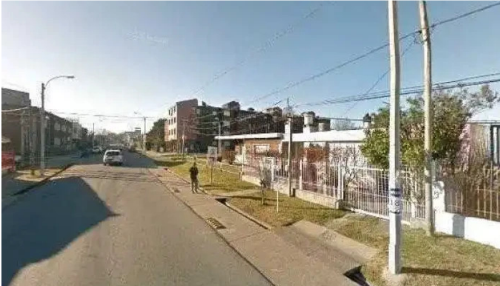
Don bruno opiniones