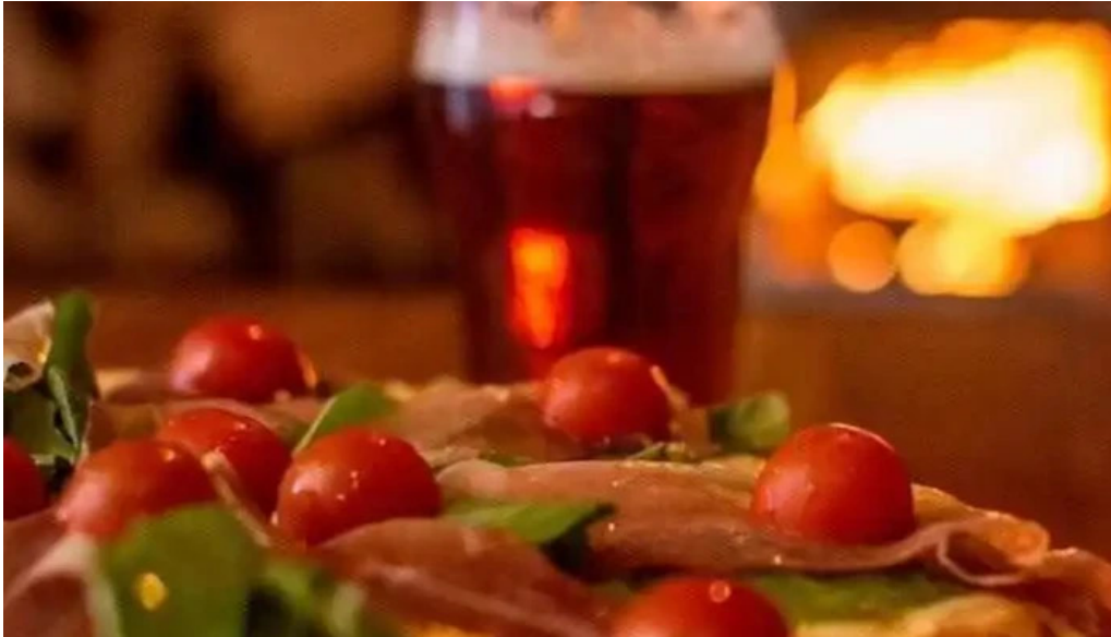
Me dijeron comida y bebida