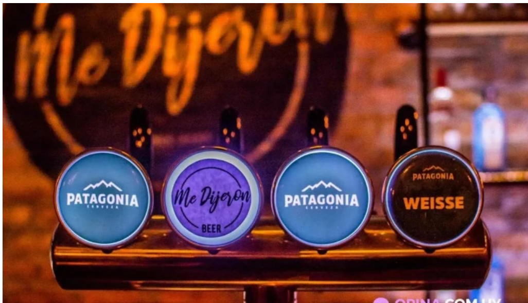
Me dijeron del propietario