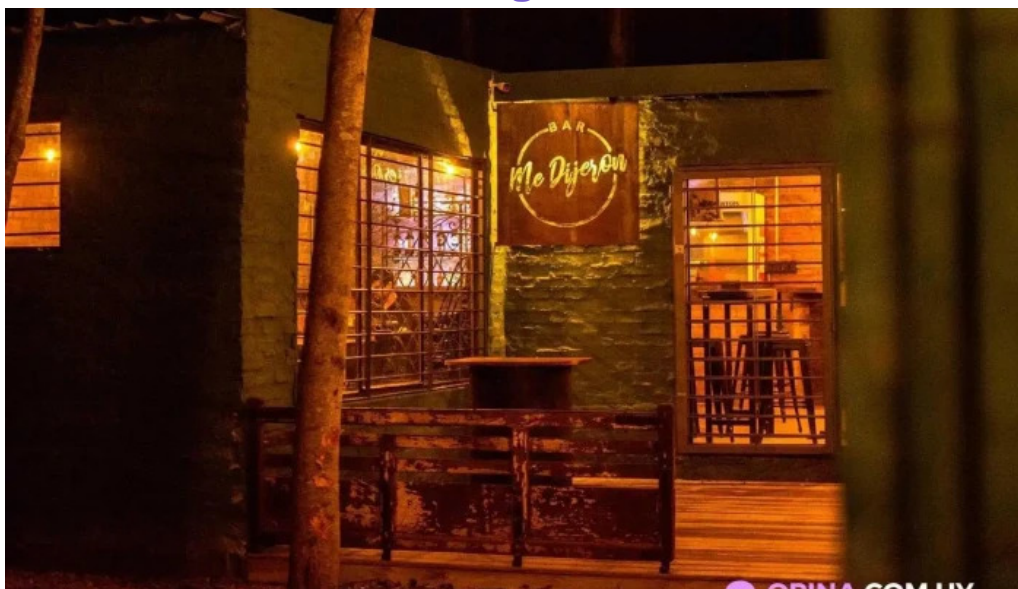
Me dijeron todas