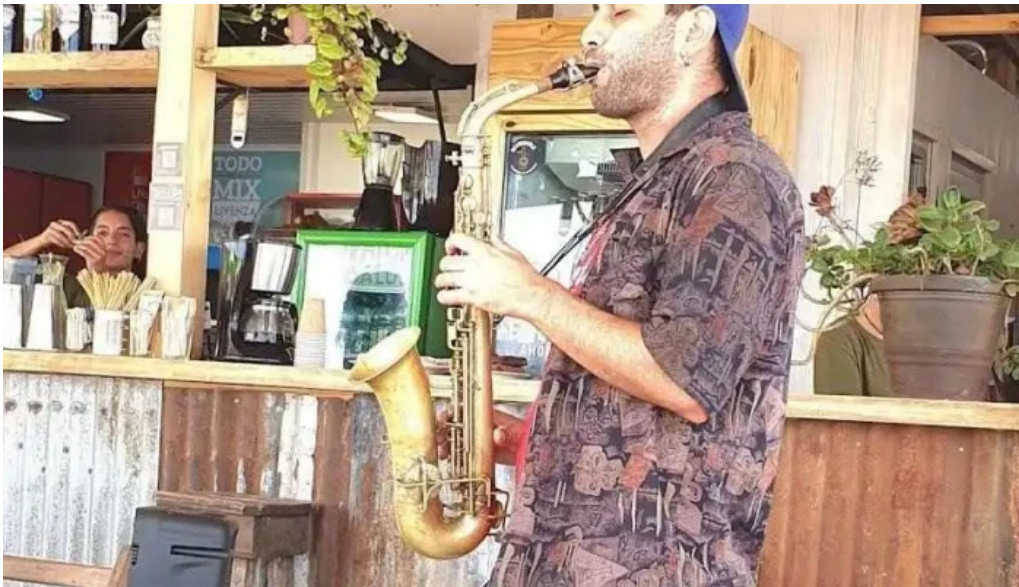
Yaros parador la pedrera