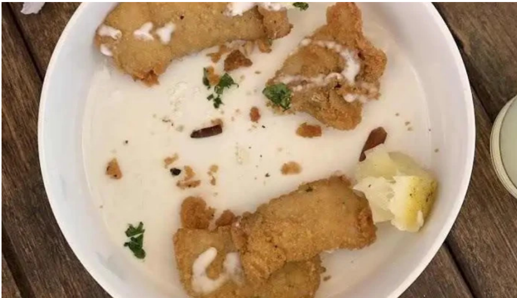
Yaros parador comida y bebida