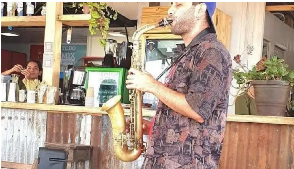
Yaros parador todas