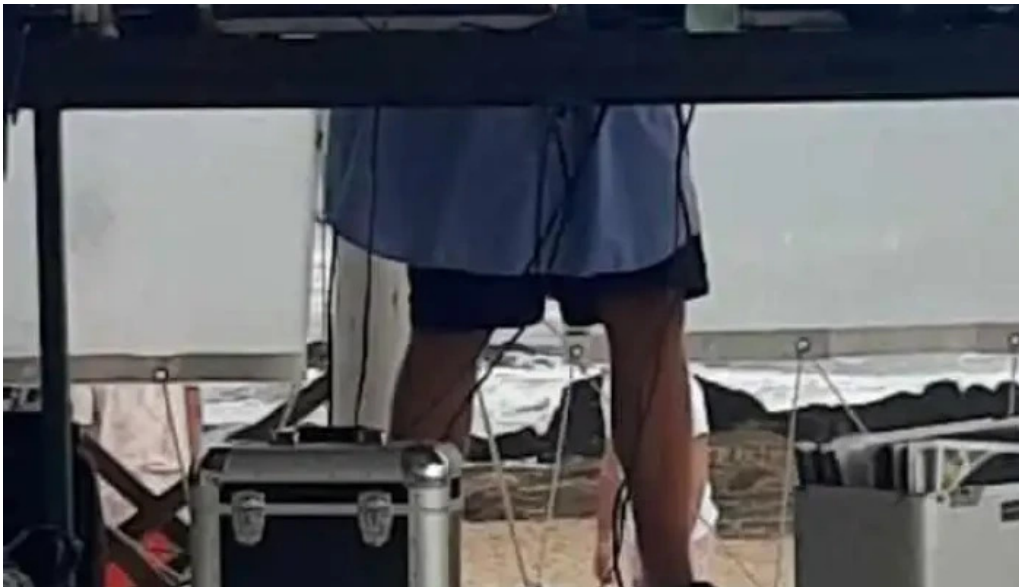
Yaros parador videos