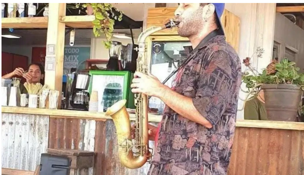
Yaros parador ambiente