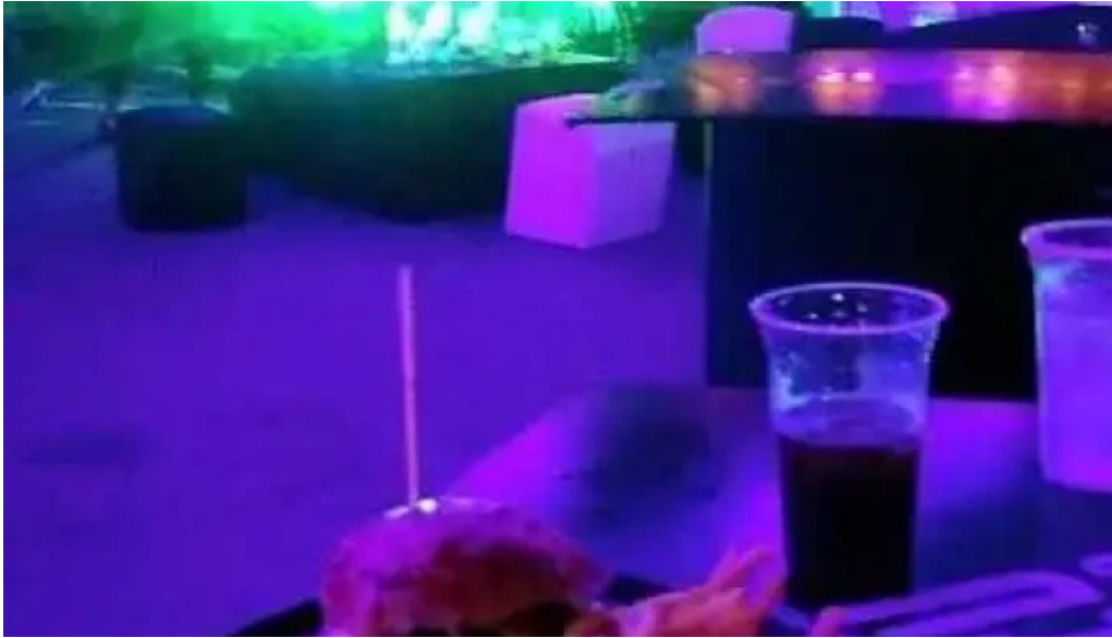
Parador mercado atlantida comida y bebida