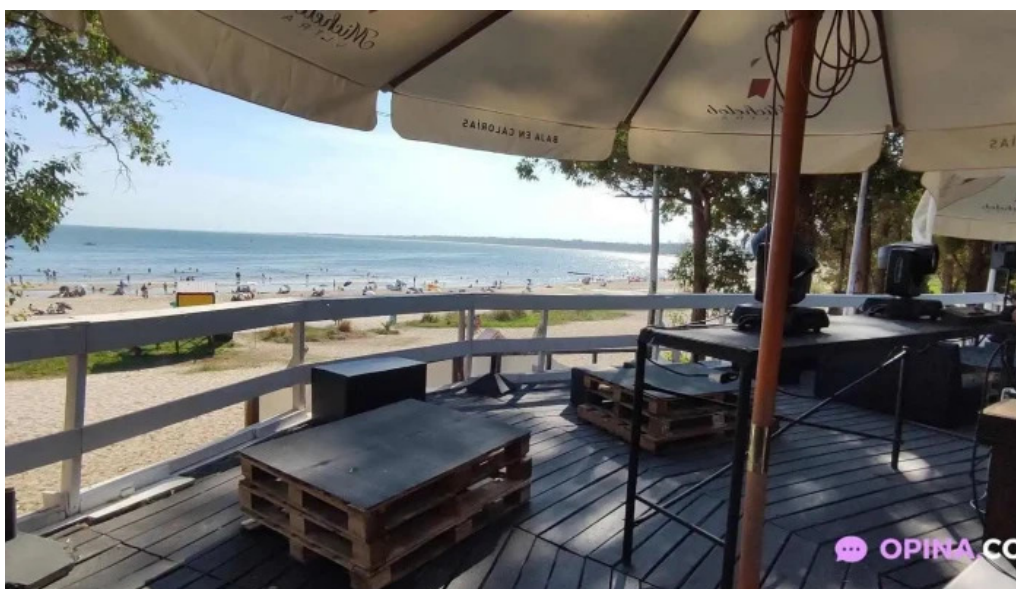
Parador mercado atlantida todas