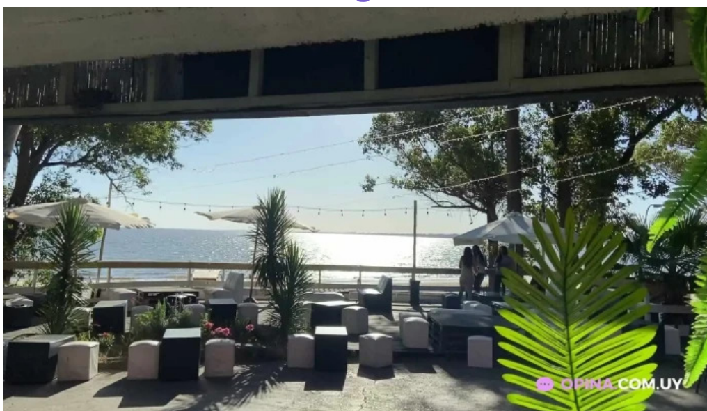
Parador mercado atlantida videos