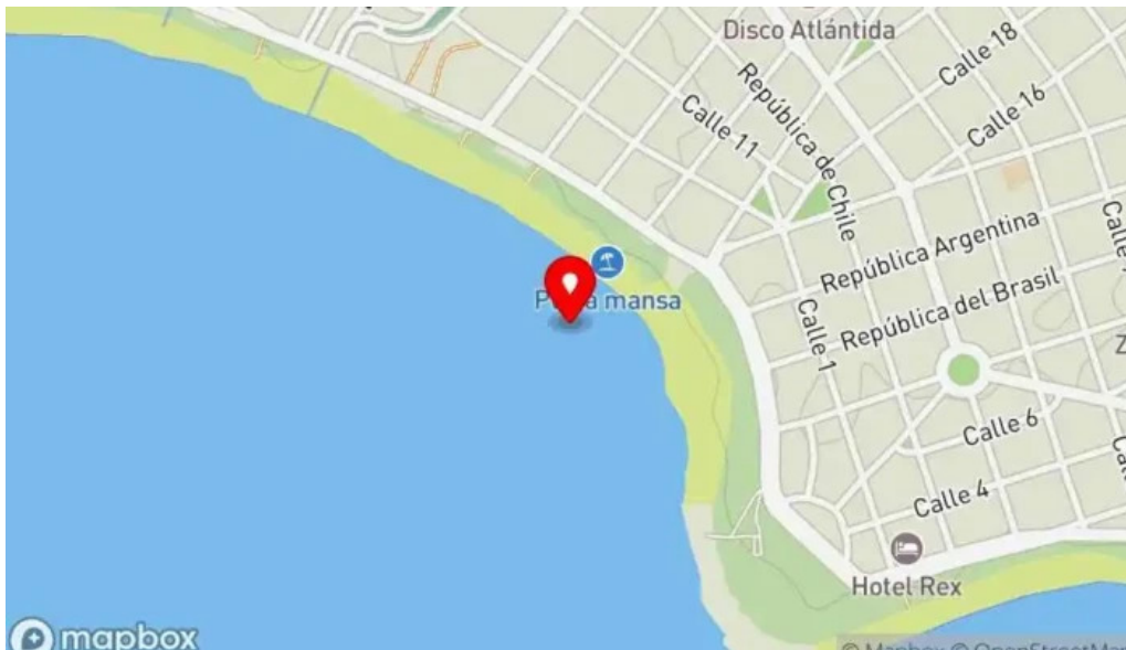
Parador mercado atlántida mapa