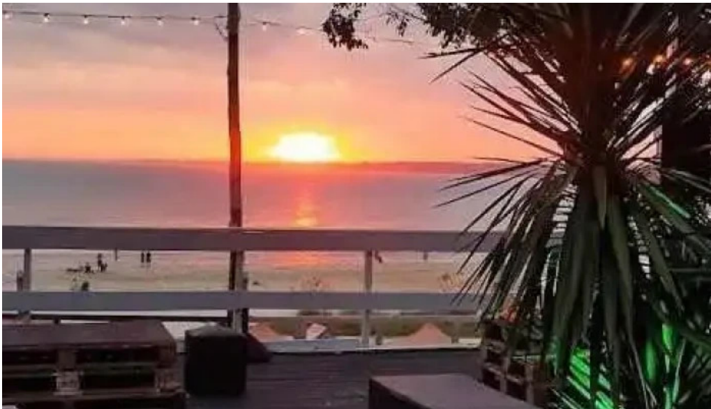
Parador mercado atlántida del propietario