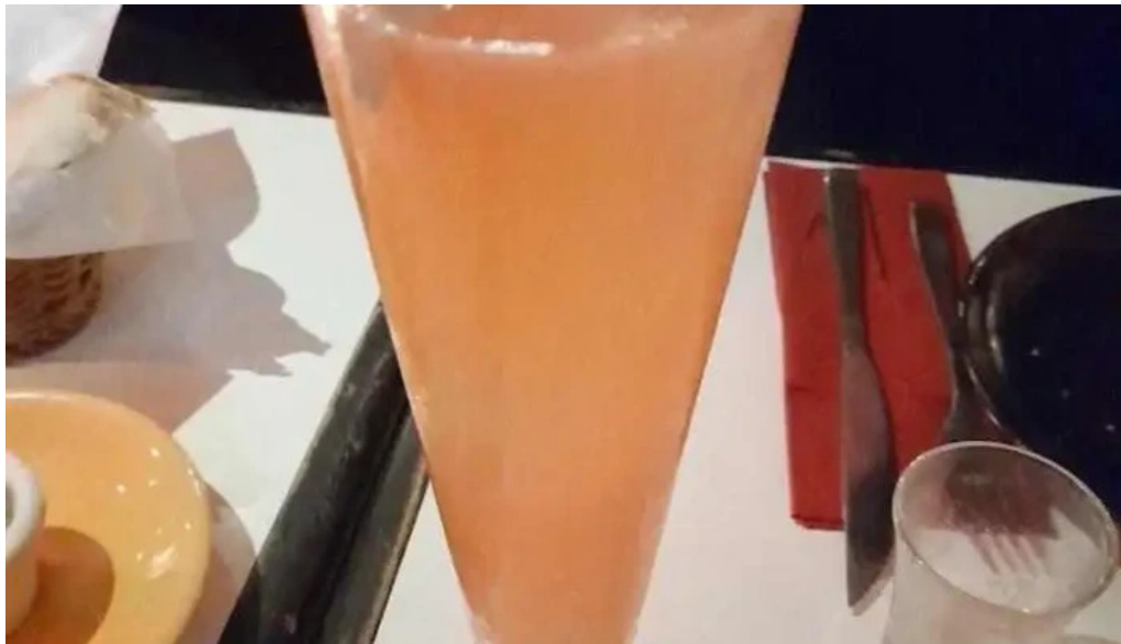
La vanguardia 1934 jugo