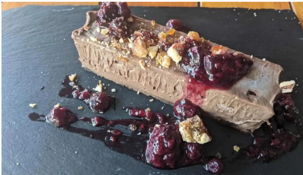
La vanguardia 1934 pastel de queso