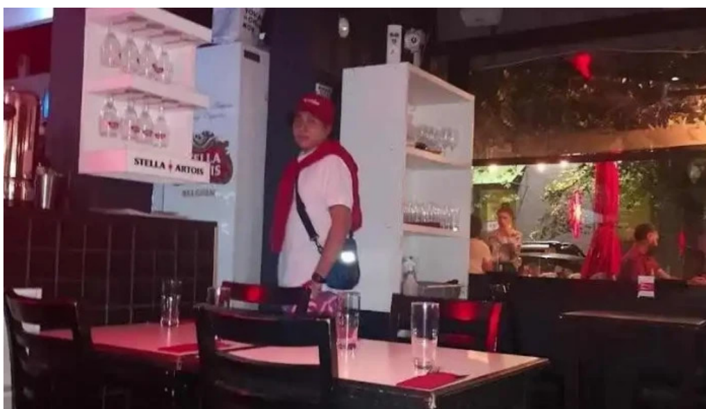
La vanguardia 1934 ambiente