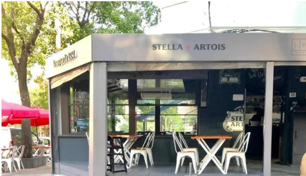
La vanguardia 1934 todas