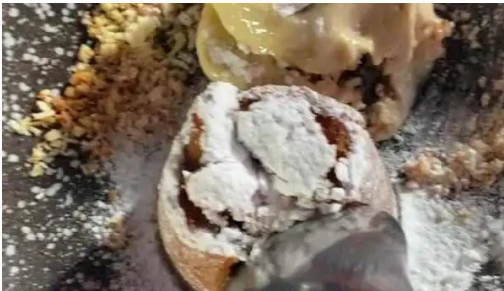
La vanguardia 1934 videos