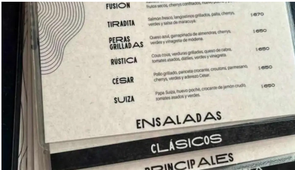
La vanguardia 1934 menu