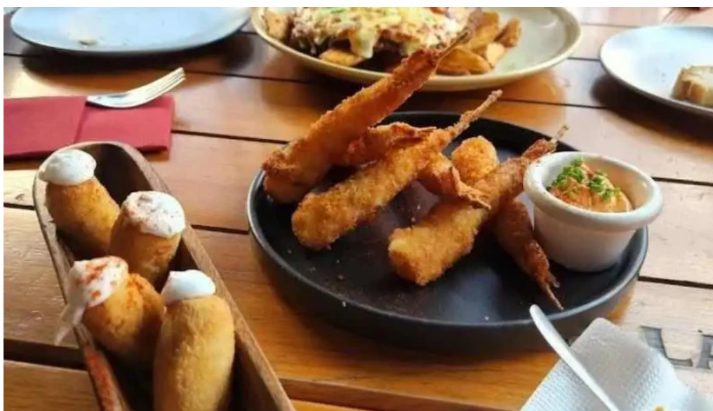
La vanguardia 1934 comida y bebida