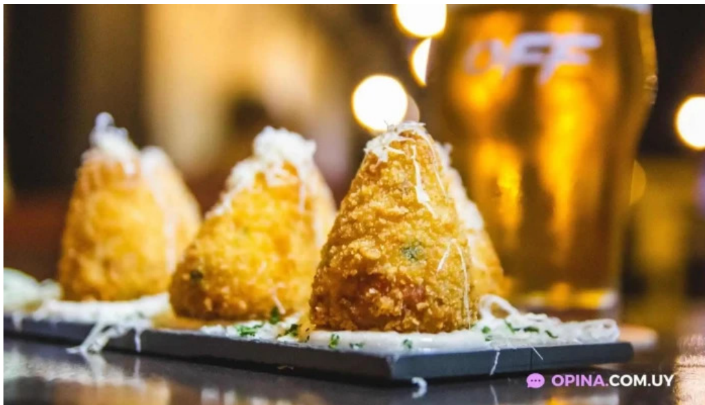
Dona coxinha del propietario