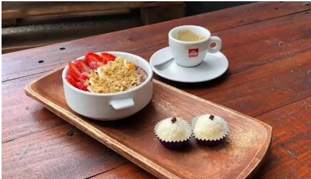
Dona coxinha mas recientes