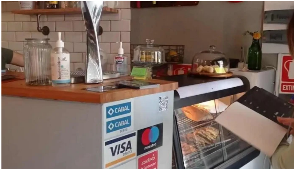
Dona coxinha ambiente