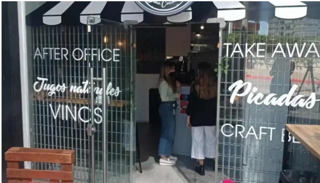
Dona coxinha todas