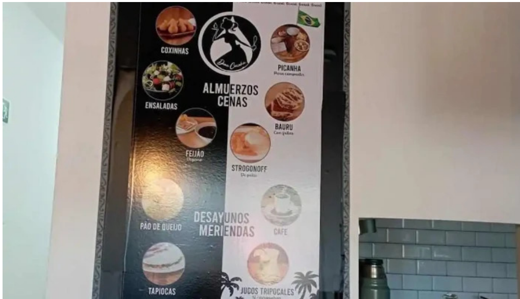
Dona coxinha menu