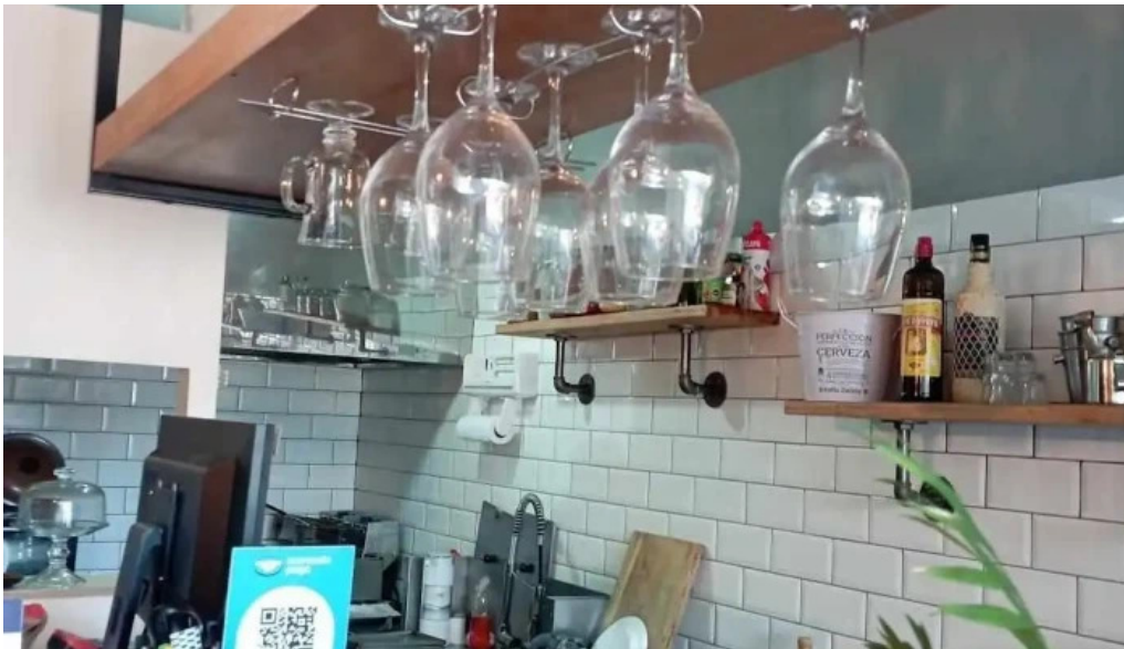
Dona coxinha bar