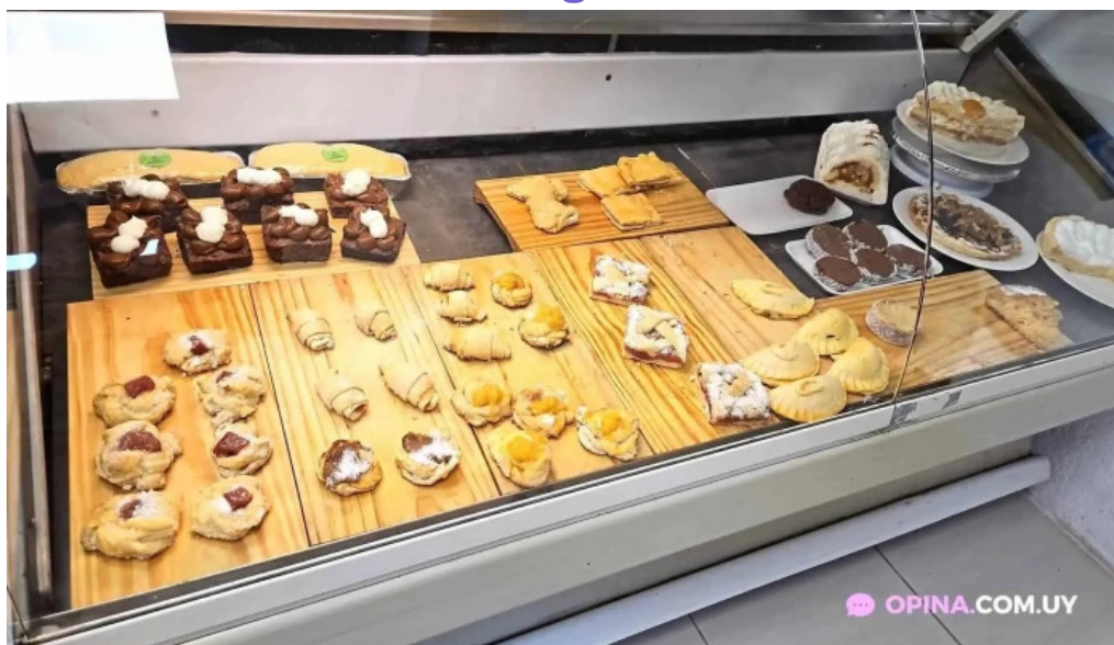
Cositas sin gluten todo