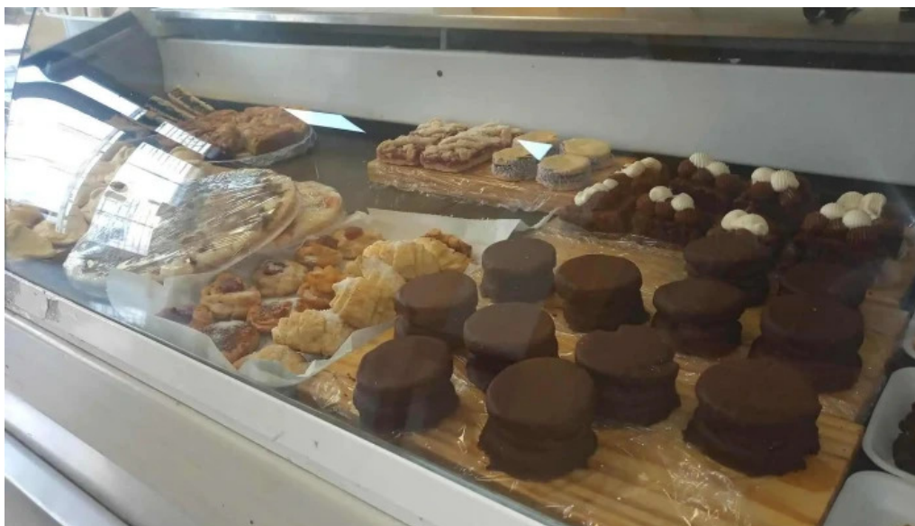
Cositas sin gluten ambiente