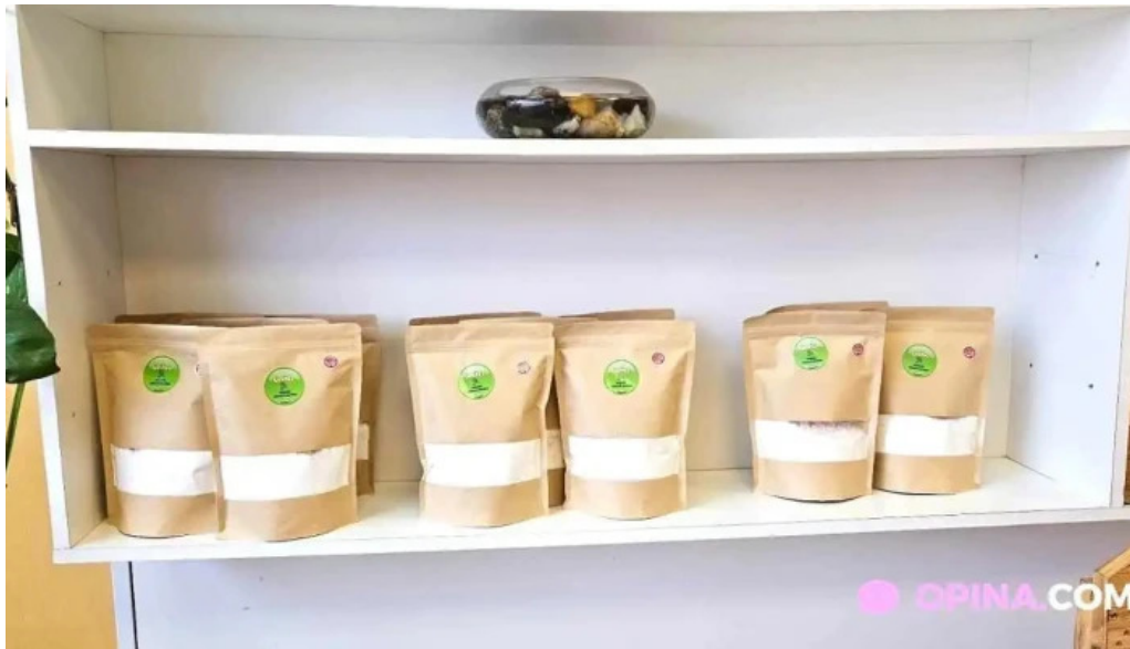
Cositas sin gluten del propietario