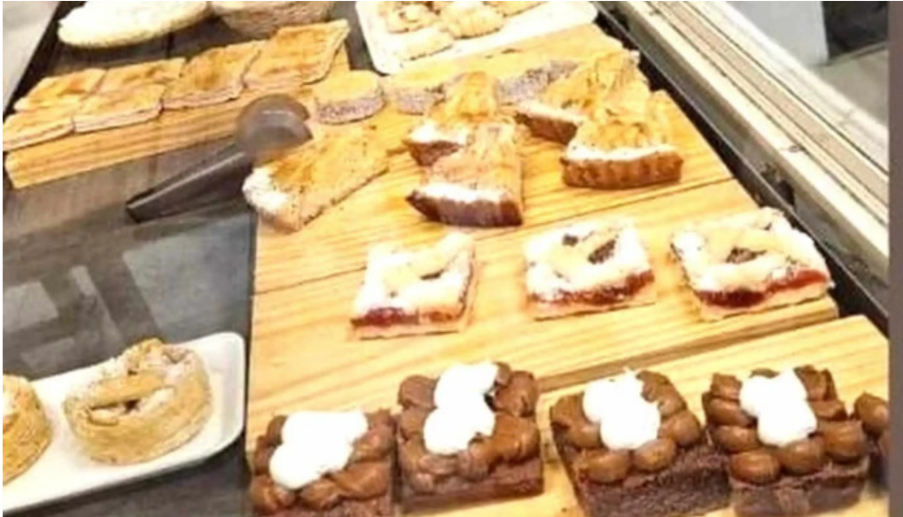
Cositas sin gluten comentario 2