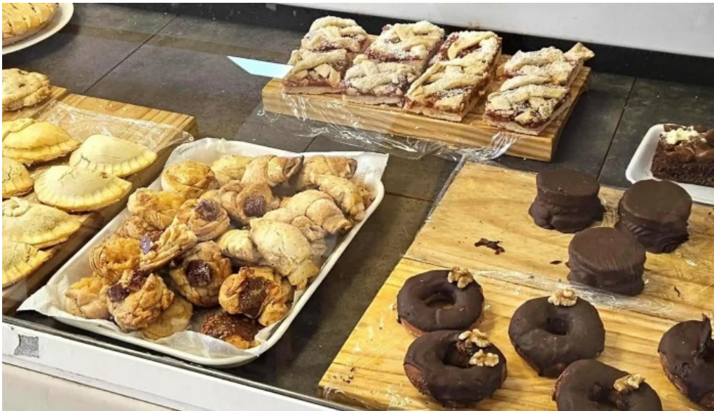
Cositas sin gluten comentario 3