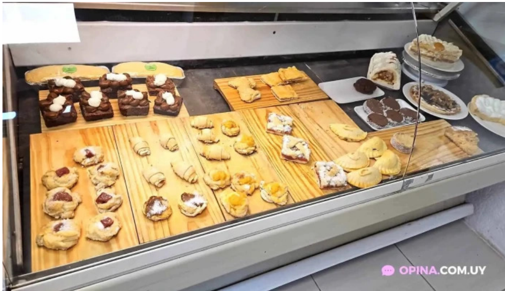
Cositas sin gluten pan de azucar