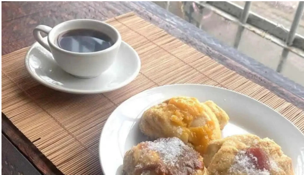
Cositas sin gluten comidas y bebidas