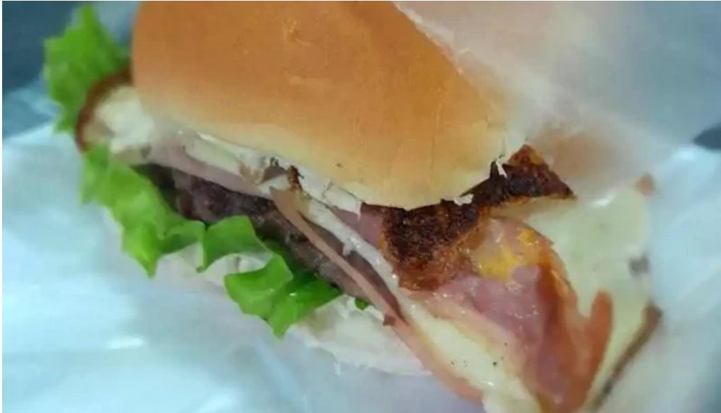
Coby bar del propietario