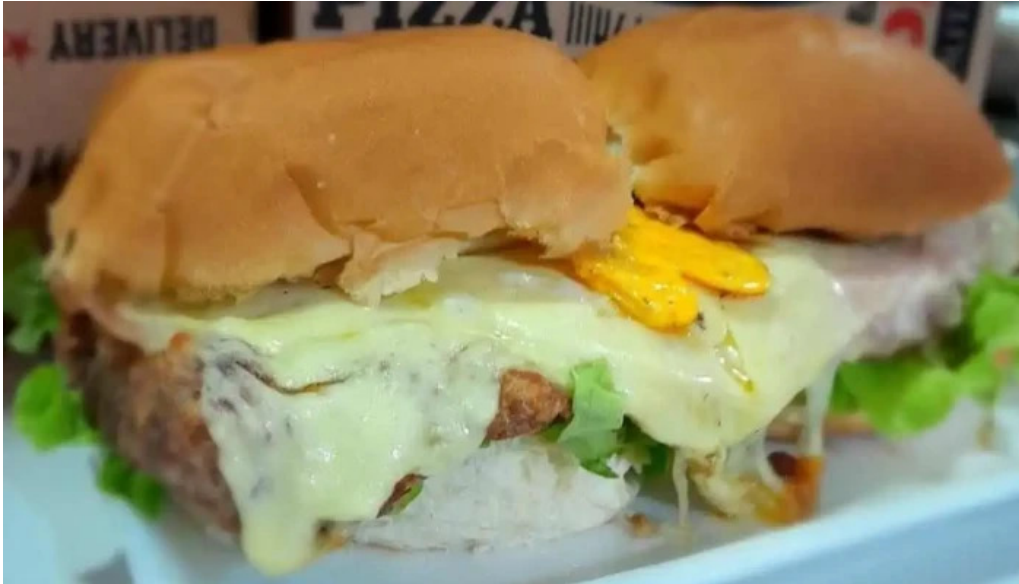
Coby bar montevideo