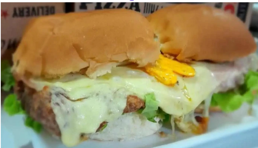
Coby bar todas