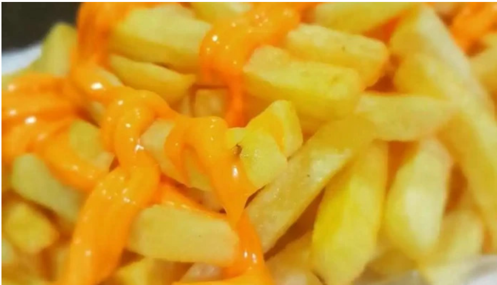
Coby bar papas fritas