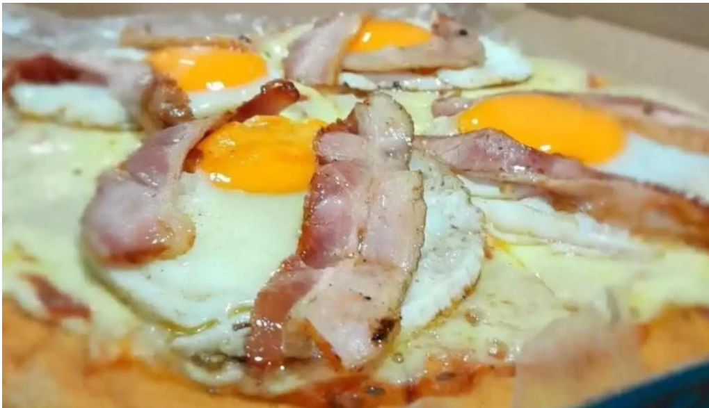
Coby bar comida y bebida