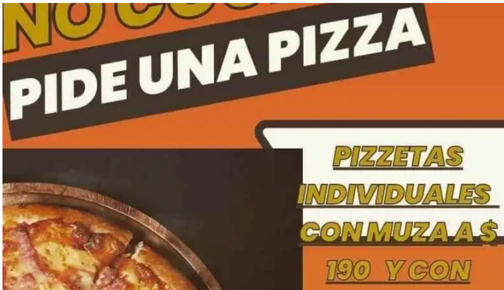
Coby bar menu