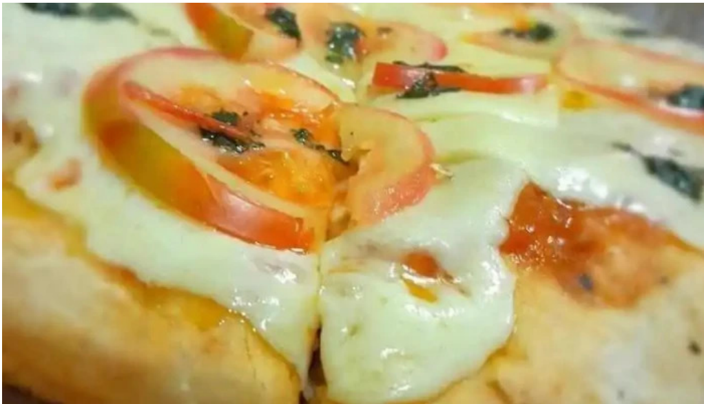
Coby bar pizza