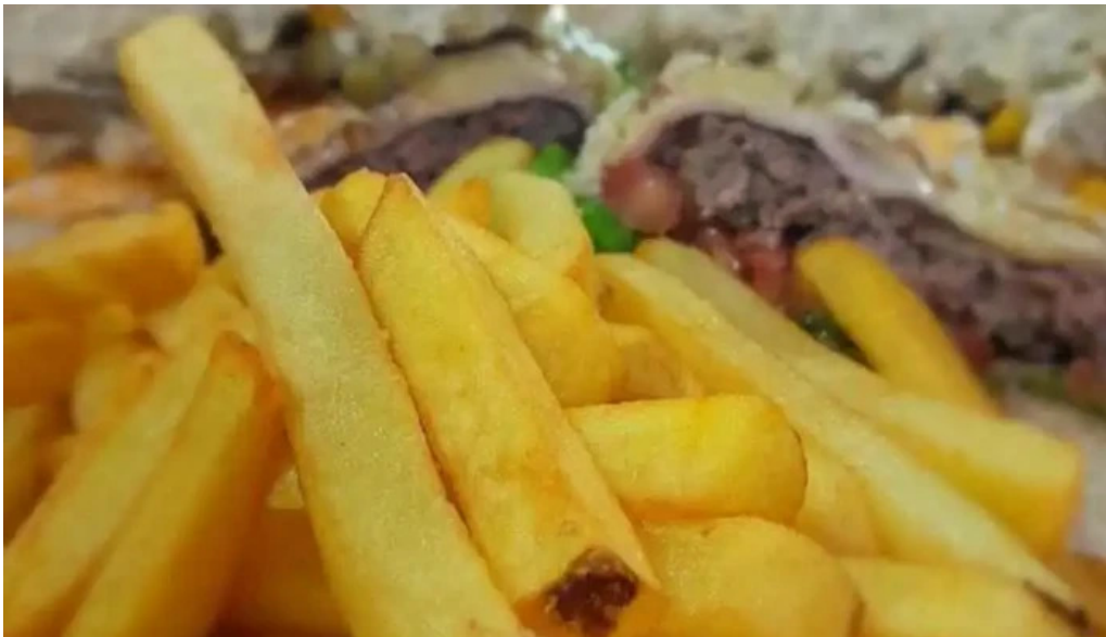
Coby bar hamburguesa