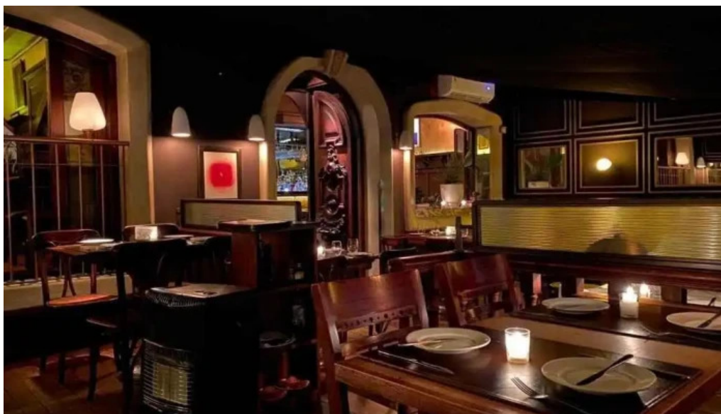
Clyde s montevideo