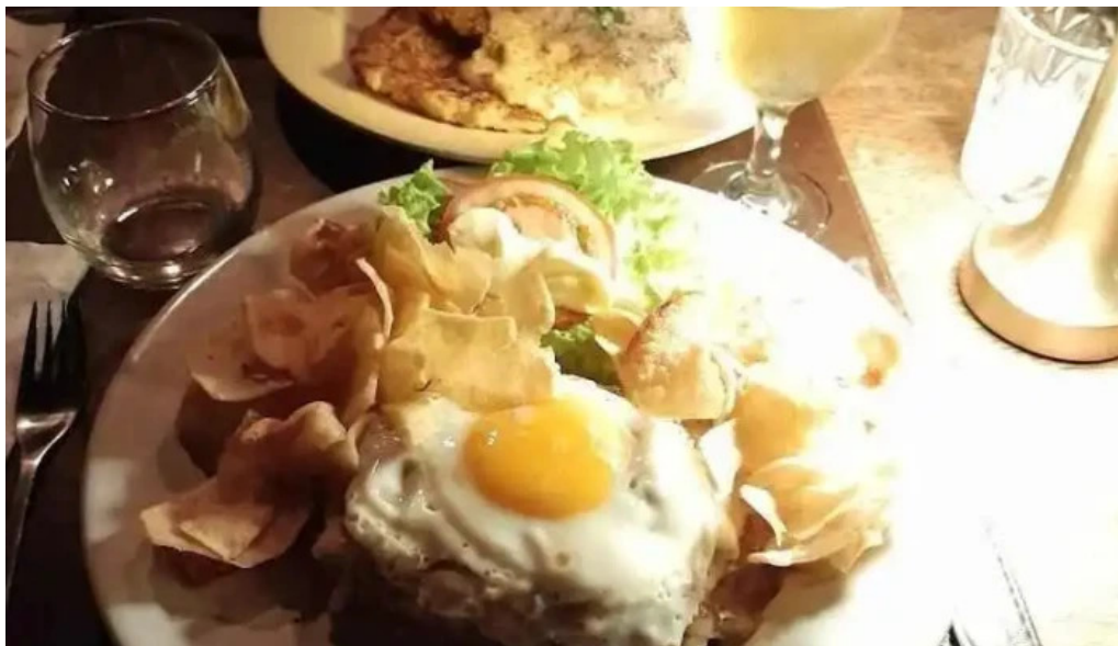
Clydes comida y bebida