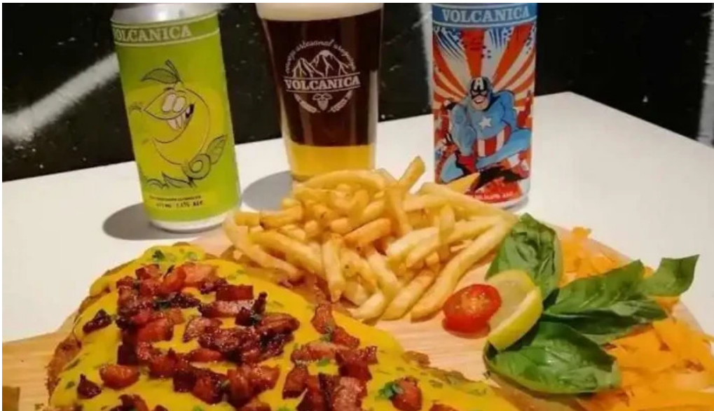
Punto beer papas fritas