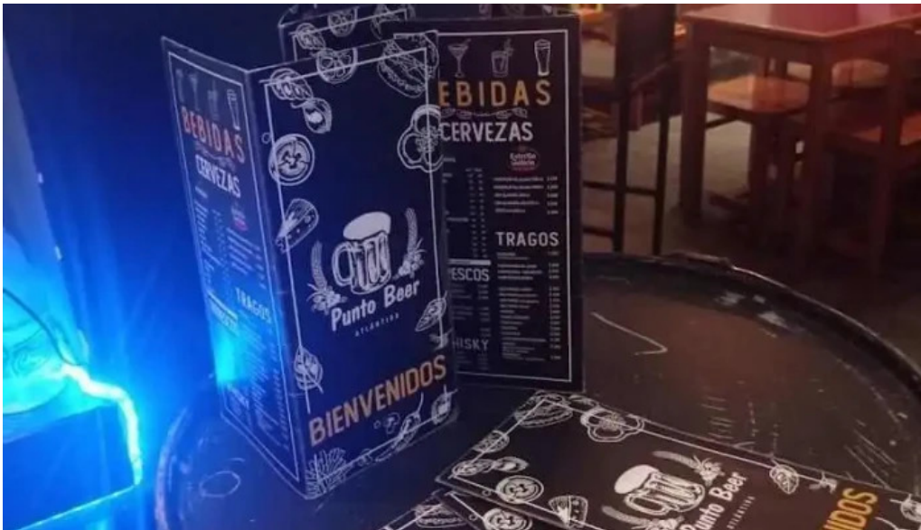
Punto beer menu