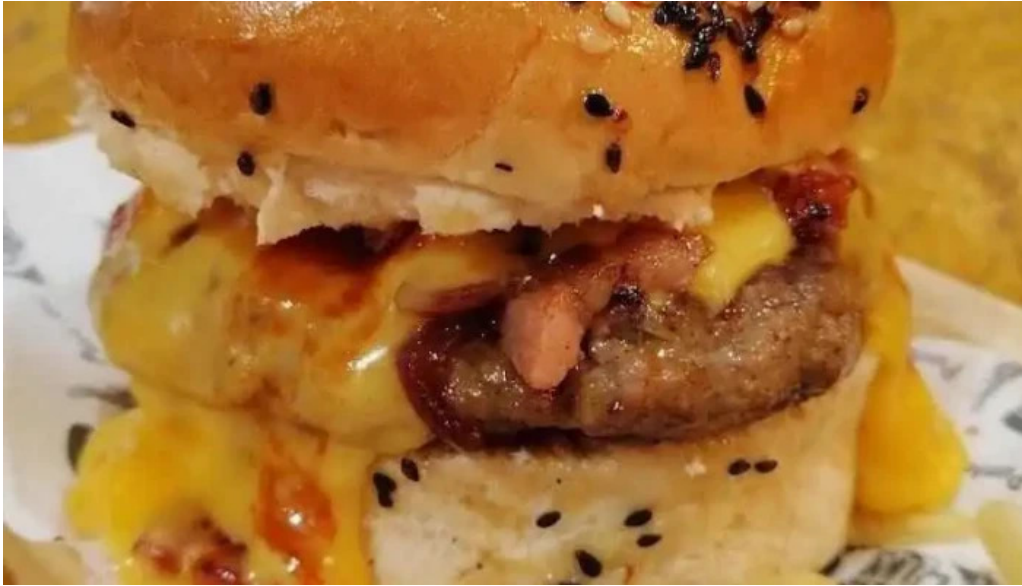
Punto beer comida y bebida