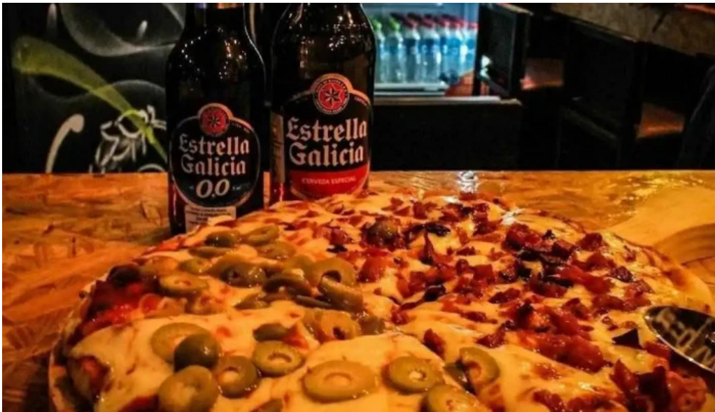
Punto beer bar