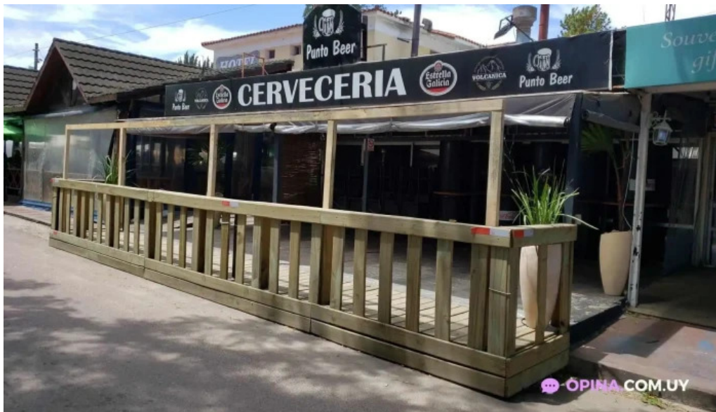
Punto beer del propietario