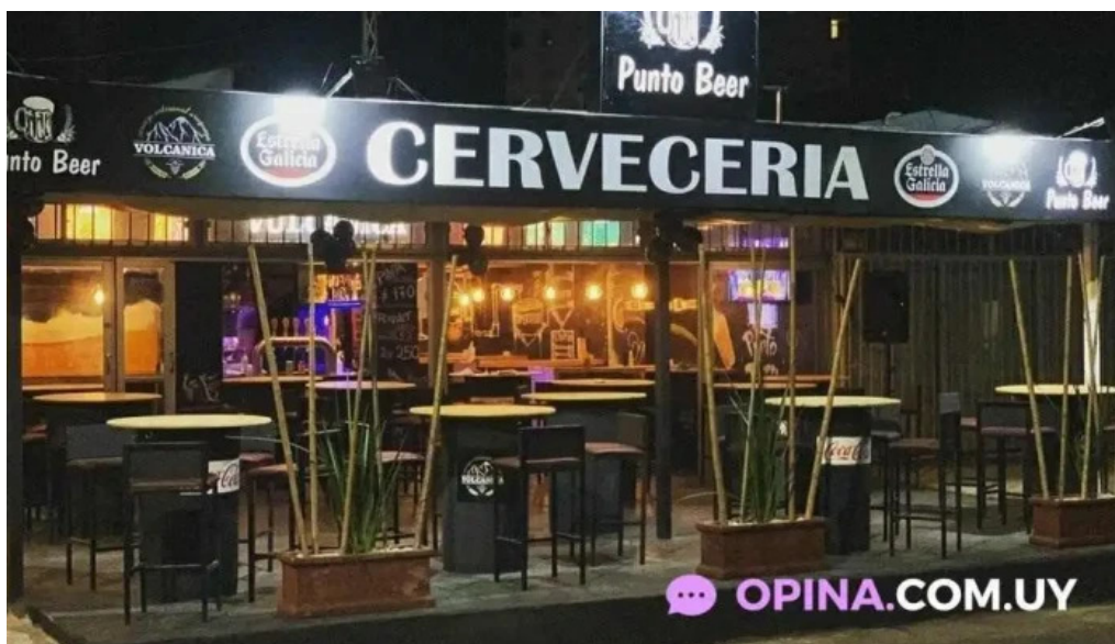
Punto beer atlantida