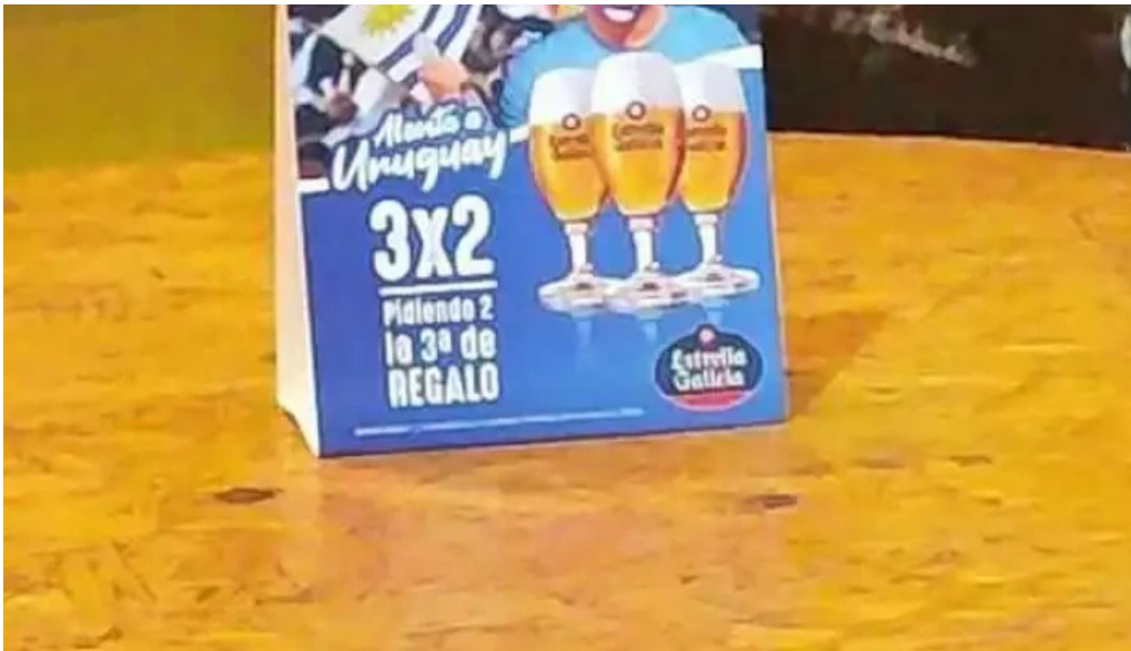
Punto beer videos