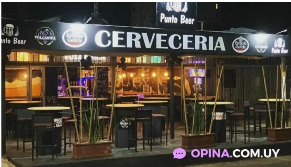
Punto beer todas