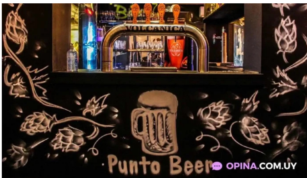
Punto beer ambiente