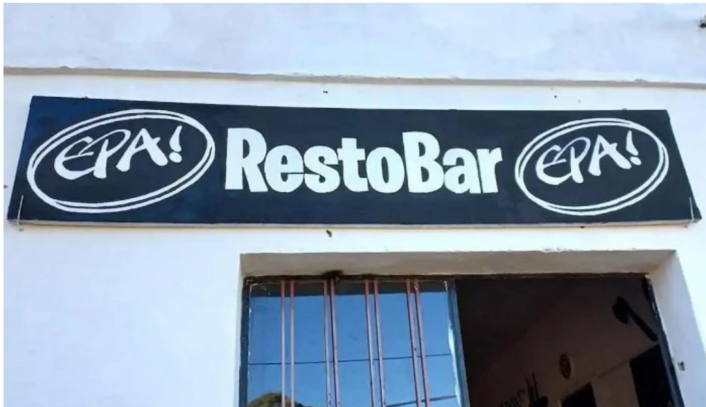
Epa restobar todas