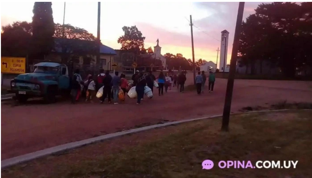
Epa restobar videos