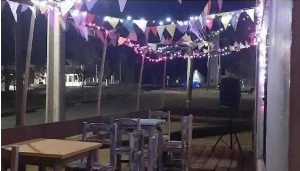
Epa restobar ambiente