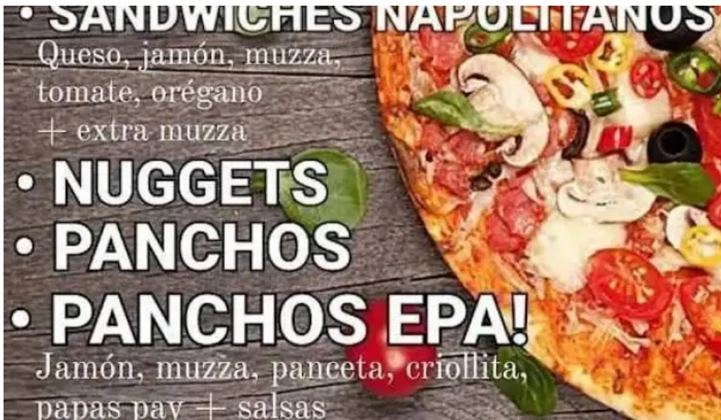
Epa restobar menu