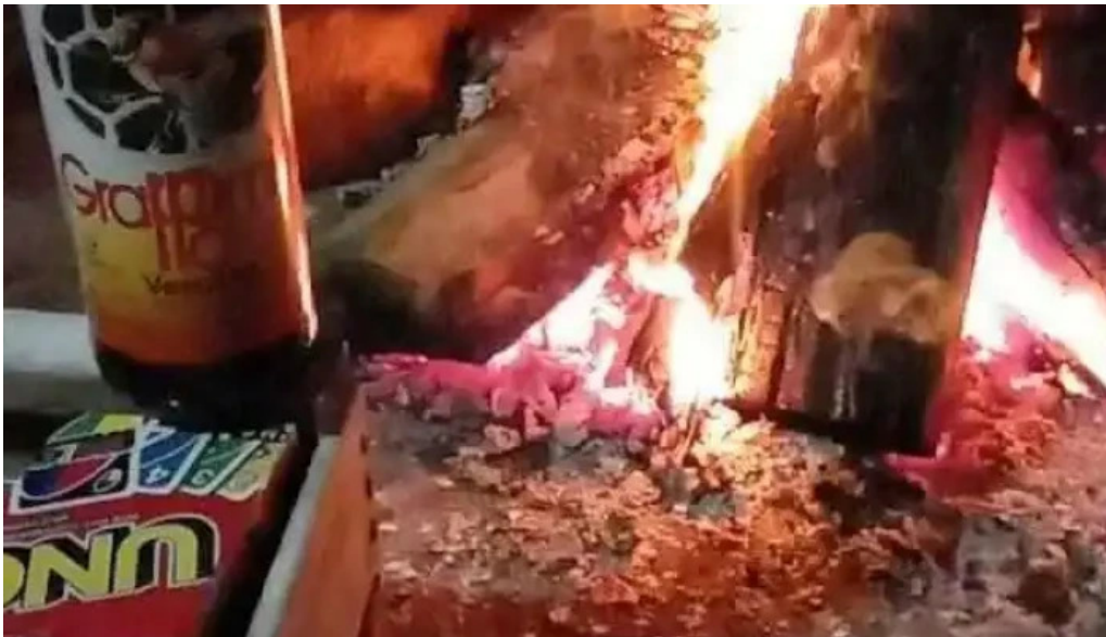
Epa restobar del propietario