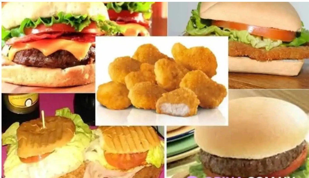
Epa restobar hamburguesa