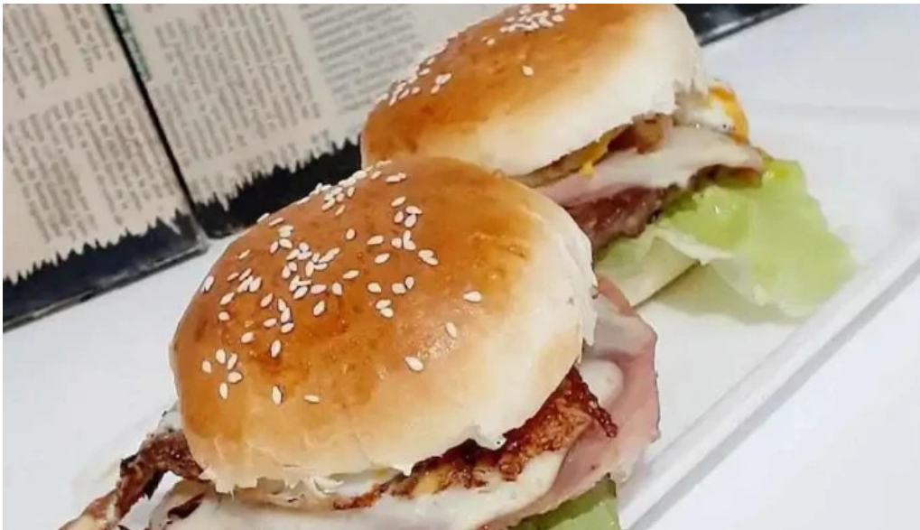
Epa restobar comida y bebida