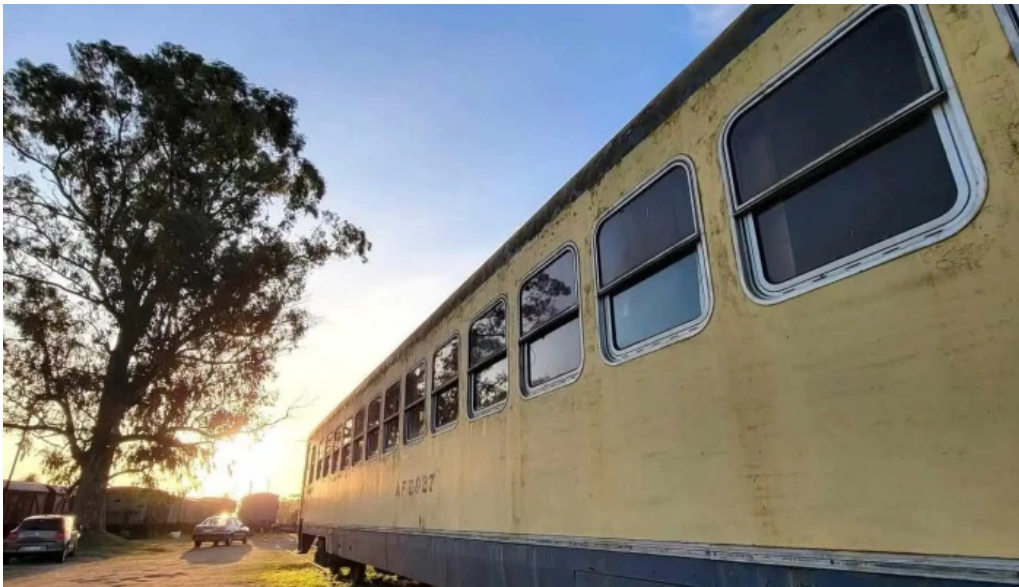
Empalme olmos descuentos