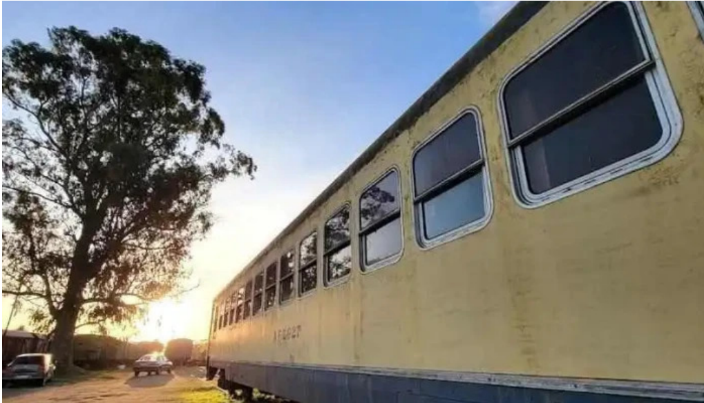
Empalme olmos empalme olmos