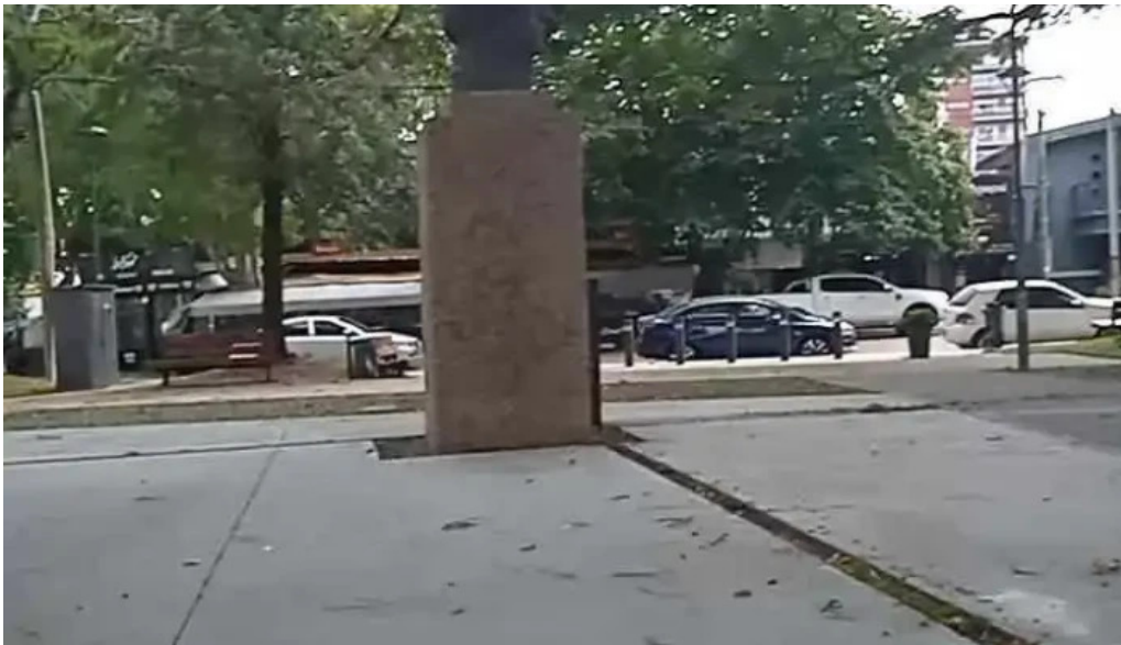
Empalme olmos videos