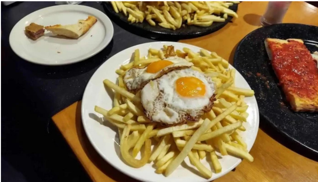
Valerio comida y bebida