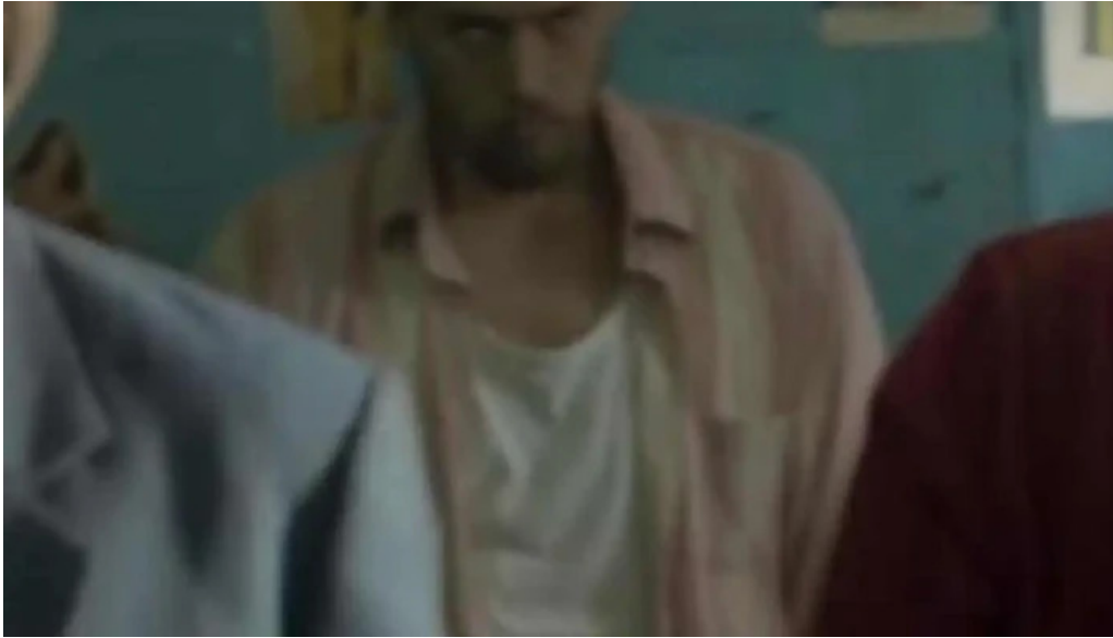
Valerio del propietario